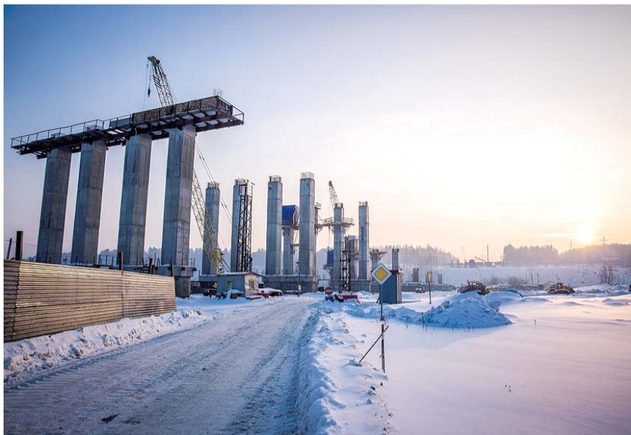
НА ФОТО: СТРОИТЕЛЬСТВО ВОСТОЧНОГО ОБЪЕЗДА ЗАТЯНУЛОСЬ ИЗ-ЗА НЕДОФИНАНСИРОВАНИЯ

Противостояние местных активистов чиновникам разных уровней, ответственных за строительство, продолжается уже не первый год. Однако