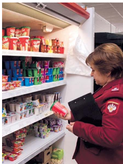
НА ФОТО: ИНСПЕКТОР ЗА РАБОТОЙ

По этим фактам в правоохранительные органы направлено более 250 материалов для возбуждения уголовных дел, судами приостановлена деятельность 12 предприятий, отозваны де-