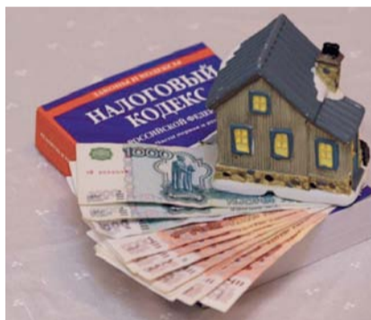
НА ФОТО: НАЛОГ ДОЛЖЕН СООТВЕТСТВОВАТЬ ДОХОДУ

Нынешнее соотношение доходов различных групп населения и существенное расслоение общества, особенно, в последние 10 лет, вызвали резкий рост недовольства в обществе проводимой экономической и социальной политикой руководства страны. Социальное напряжение в обществе нарастает пропорционально росту доходов сверхбогатых людей и тотальному обнищанию подавляющей массы населения.