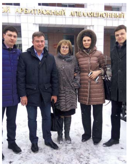
НА ФОТО: ИНТЕРЕСЫ ГОРОДА ОТСТОЯЛИ!

— Данное судебное решение означает то, что 2,5 миллиарда рублей у новосибирцев не отберут, причем не отберут довольно нагло, потому что доказательная база у «Сибмоста» была смешная. Изначально, когда подавался иск, к нему, наверное, не столь серьезно отнеслись. Он не выдерживает никакой критики. Когда во второй раз суд внезапно принял решение в пользу «Сибмоста», все, мягко говоря, были страшно удивлены, потому что непонятно было, чем руководствовался суд, принимая решение в интересах «Сибмоста». А сегодня восторжествовала справедливость.