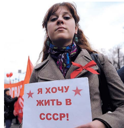
НА ФОТО: ЛЮДИ ГОРДЯТСЯ ДОСТИЖЕНИЯМИ СОВЕТСКОГО ПЕРИОДА

При этом на вопрос о том, какие события и явления в отечественной истории вызывают чувство стыда, 54% от-