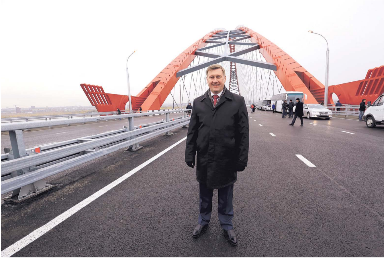
НА ФОТО: МЭРИЯ НОВОСИБИРСКА, ВОЗГЛАВЛЯЕМАЯ АНАТОЛИЕМ ЛОКОТЬ, ЗАЩИТИЛА БЮДЖЕТ ГОРОДА ОТ ПОСЯГАТЕЛЬСТВ «СИБМОСТА»