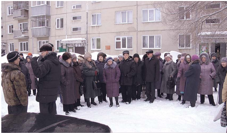
НА ФОТО: ИСКИТИМЦАМ НУЖЕН ДВОР С ДЕТСКОЙ ПЛОЩАДКОЙ, А НЕ МНОГОЭТАЖКА

— Занимаюсь проектированием и строительством 47 лет, — рассказывает