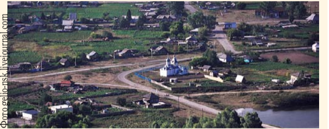
НА ФОТО: ПРЕДМЕТ СПЕКУЛЯЦИИ — ЗЕМЛЯ