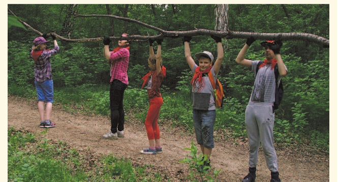
НА ФОТО: ПИОНЕРЫ — ЗА ЧИСТУЮ ТЕРРИТОРИЮ!