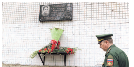
НА ФОТО: ОТКРЫТИЕ МЕМОРИАЛЬНОЙ ДОСКИ