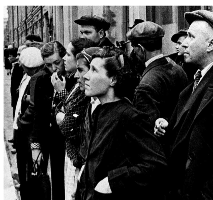
НА ФОТО: КОГДА ОБЪЯВИЛИ ВОЙНУ

Это неслыханное нападение на нашу страну является беспримерным в истории цивилизованных народов вероломством. Нападение на нашу страну произведено, несмотря на то, что между СССР и Германией заключен договор о ненападении и Советское правительство со всей добросовестностью выполняло все условия этого договора... Это разбойничье нападение на Советский Союз целиком и полностью падает на германских фашистских правителей.