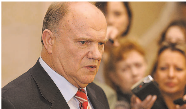
НА ФОТО: ГЕННАДИЙ ЗЮГАНОВ

«Пенсионный возраст мужчинам продлевают на пять лет, женщинам — на восемь. Это проявление циничного отношения к женщинам», — считает лидер КПрФ.