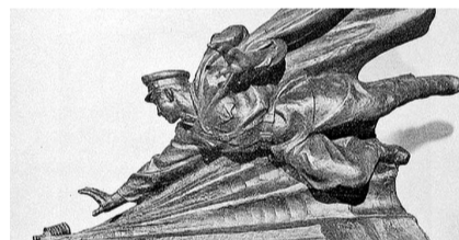
НА ФОТО: ПАМЯТНИК В КНДР