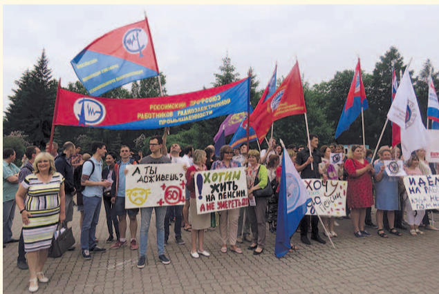
НА ФОТО: НА ПИКЕТЕ