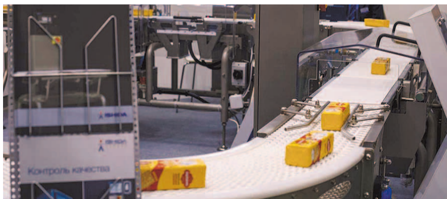
НА ФОТО: ОТЕЧЕСТВЕННОЕ ОБОРУДОВАНИЕ В БЛИЖАЙШЕЙ ПЕРСПЕКТИВЕ — УТОПИЯ

Пищевое машиностроение не является чем-то недостижимым в плане технологий. Здесь не нужно самой продвинутой электроники, например. Но в РФ угроблены или влачат достаточно жалкое существование многие производители, и поэтому практически вся мясная, молочная, сырная продукция делается именно на импортном оборудовании. Никакого импортозамещения нет и не будет в сфере разлива соков, производства упаковки и так далее. Даже производство макарон в РФ —