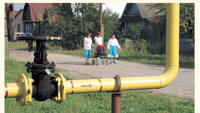
НА ФОТО: У СОСЕДЕЙ ГАЗ, А У НАС?