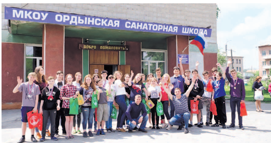
НА ФОТО: ВОСПИТАННИКИ ОРДЫНСКОЙ САНАТОРНОЙ ШКОЛЫ-ИНТЕРНАТА