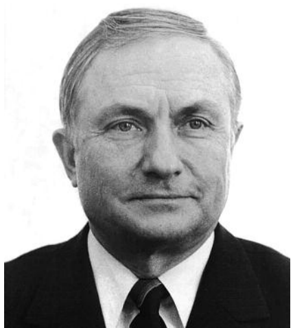
■ НА ФОТО: ПЕРВЫЙ СЕКРЕТАРЬ ОБКОМА КПСС