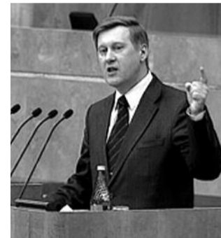
● НА ФОТО: АНАТОЛИЙ ЛОКОТЬ

Анатолий ЛОКОТЬ выступил на заседании Госдумы с заявлением, в котором коснулся проблем местного самоуправления в Новосибирской области. Депутат обратился к комитетам Госдумы по местному самоуправлению и безопасности с просьбой проверить административное и уголовное делопроизводство в отношении глав муниципалитетов и внести соответствующие изменения в законодательство.