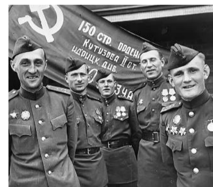
● НА ФОТО: КАНТАРИЯ, ЕГОРОВ (В ЦЕНТРЕ) И КОМБАТ НЕУСТРОЕВ (СПРАВА) У ЗНАМЕНИ 150-й ИДРИЦКОЙ СТРЕЛКОВОЙ ДИВИЗИИ

10 июля 1945 года по распоряжению Главного политуправления СА Знамя Победы было передано в Центральный музей Вооруженных Сил СССР на вечное хранение. В 1965 году знамя выносилось по случаю 20-летия Победы, среди знаменосцев были сержант Михаил Егоров и младший сержант Мелитон Кантария. Сейчас легендарное полотнище хранится в Центральном музее Вооруженных Сил РФ, где был открыт зал «Знамя Победы», в котором было размещено подлинное Знамя Победы. Знамя находится в стек-