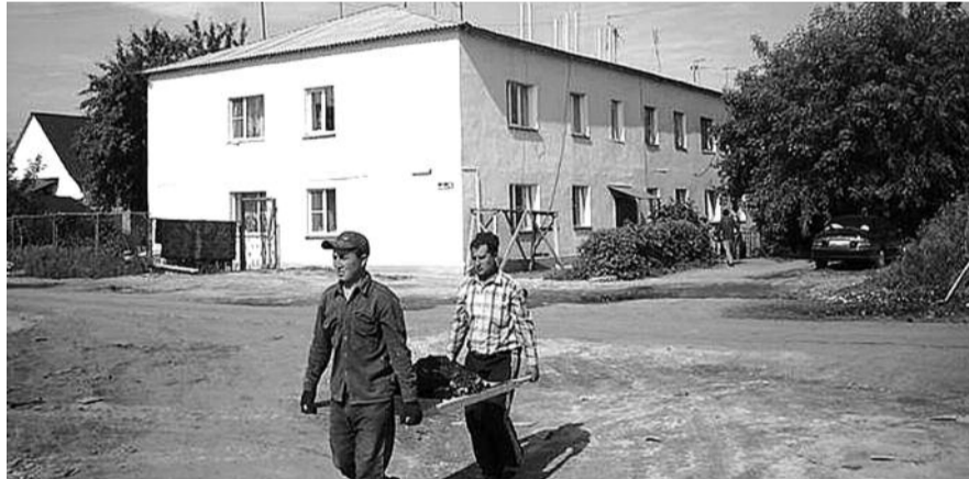
■ НА ФОТО: ТЕПЕРЬ МЫ БУДЕМ ОБЯЗАНЫ ПЛАТИТЬ ЗА РЕМОНТ ЧУЖИХ ДОМОВ?

Насколько это нововведение ударит по карманам россиян, пусть каждый посчитает самостоятельно. Для этого необходимо количество своих квадратных метров умножить минимум на 5, максимум — на 10 рублей. Предположим, Ваша жилплощадь насчитывает 50 «квадратов». Получается, вы должны будете плюс к