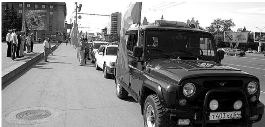
● НА ФОТО: ВСТРЕЧАЙТЕ КРАСНУЮ КОЛОННУ АВТОПРОБЕГА В СВОЕМ НАСЕЛЕННОМ ПУНКТЕ!

16:00 Встреча автоколонны в Новосибирске на площади Ленина