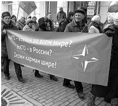
■ НА ФОТО: АКЦИЯ В УЛЬЯНОВСКЕ