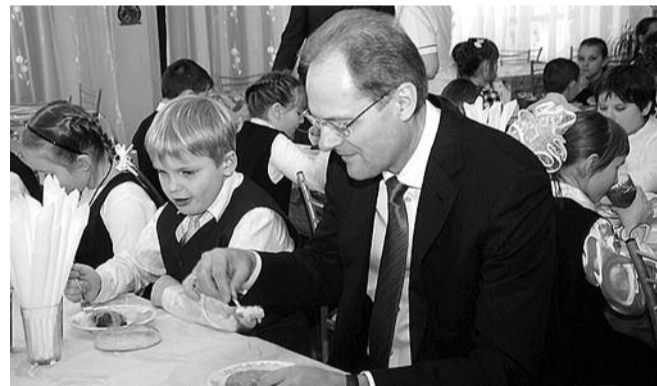
■ НА ФОТО: СЛУШАЕТ ДА ЕСТ. ГУБЕРНАТОР В ШКОЛЬНОЙ СТОЛОВОЙ