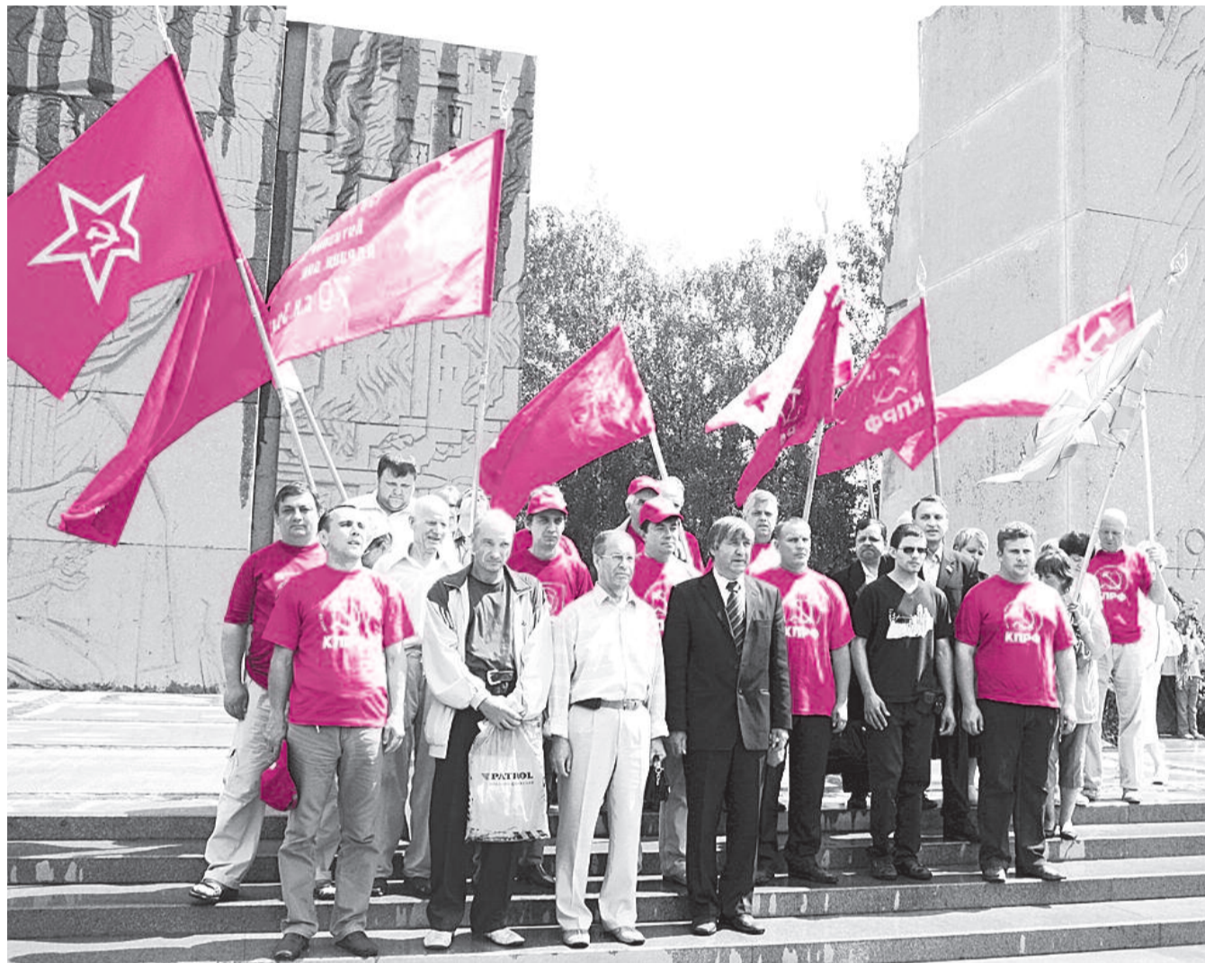
● НА ФОТО: В ПРОШЛОМ ГОДУ ТРАДИЦИОННЫЙ АВТОПРОБЕГ КПРФ ЗАВЕРШИЛСЯ 22 ИЮНЯ НА МОНУМЕНТЕ СЛАВЫ В НОВОСИБИРСКЕ