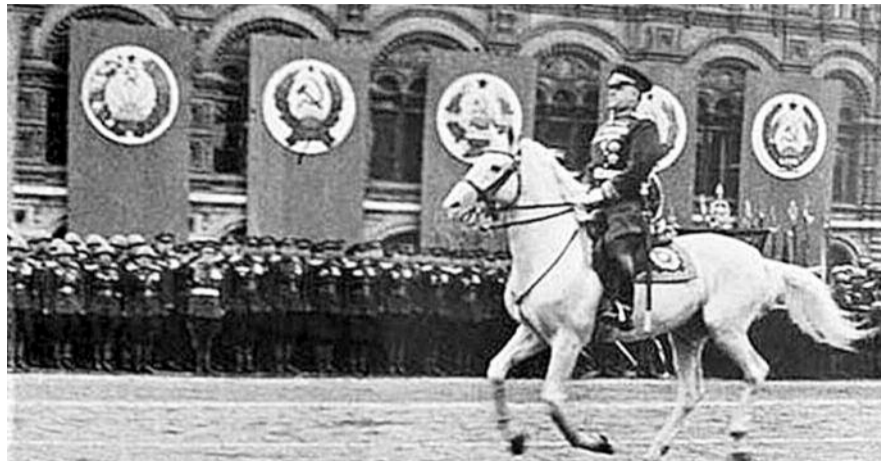
■ НА ФОТО: ПАРАД ПОБЕДЫ 1945 ГОДА МАРШАЛ ЖУКОВ ПРИНИМАЛ ВЕРХОМ

Но была на параде и такая знаменательная сцена. Она произошла, когда музыка на площади вдруг стихла, и под drobные звуки барабанов подошла к трибунам колонна из двухсот бойцов, несших знамена немецко-фашистских армий, захваченные в боях нашими частями. У Мавзолея В.И. Ленина