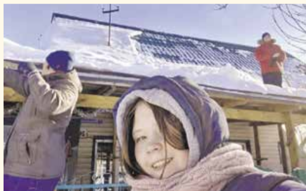
НА ФОТО: НОВОСИБИРСКИЕ КОМСОМОЛЬЦЫ В ОЧЕРЕДНОЙ РАЗ ПОМОГЛИ ПЕНСИОНЕРАМ

Одним из центров социальной акции ЛКСМ РФ «Снежный десант» в Новосибирске стал Первомайский район.