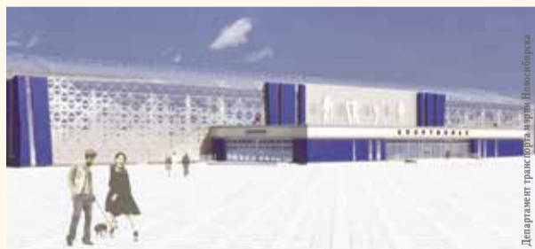
НА ФОТО: ПРОЕКТ СТАНЦИИ «СПОРТИВНАЯ»

16 февраля в Государственной думе в рамках правительственного часа вице-премьер Марат ХУСНУЛЛИН , курирующий ЖКХ и транспорт, рассказал, каким городам будет выделено дополнительное финансирование на строительство метрополитена.