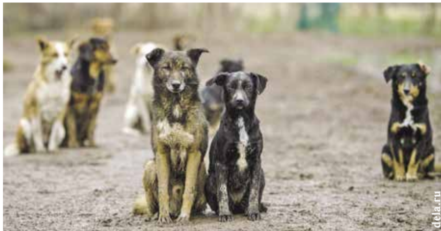
НА ФОТО: ПРОБЛЕМА БРОДЯЧИХ ЖИВОТНЫХ СТАНОВИТСЯ ВСЕ АКТУАЛЬНЕЙ

— Все зависит от людей. Если взяли животное, нужно добросовестно