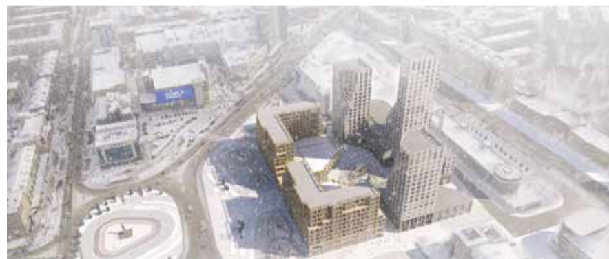
НА ФОТО: ПРОЕКТ РЕКОНСТРУКЦИИ ПЛОЩАДИ МАРКСА