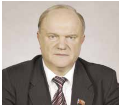
НА ФОТО: ПРЕДСЕДАТЕЛЬ ЦК КПрФ, РУКОВОДИТЕЛЬ ФРАКЦИИ КПрФ В ГОСДУМЕ ФС РФ ЗЮГАНОВ ГЕННАДИЙ АНДРЕЕВИЧ

Сегодня все, кто играет по правилам англосаксов, привычно сыпят обвинениями в адрес России и «не замечают» провокационные действия официального Киева. При этом уже длительное время игнорируется факт поэтапной бандеризации Украины. Политики Запада делают вид, что им не знакомы смысл и дух решений Нюрнбергского трибунала. Крупный капитал США и Европы, потворствовавший приходу гитлеровцев к власти, готов и сегодня способствовать кровопролитию и агрессии. В середине прошлого столетия человечество заплатило за такую политику многомиллионными жертвами. Только