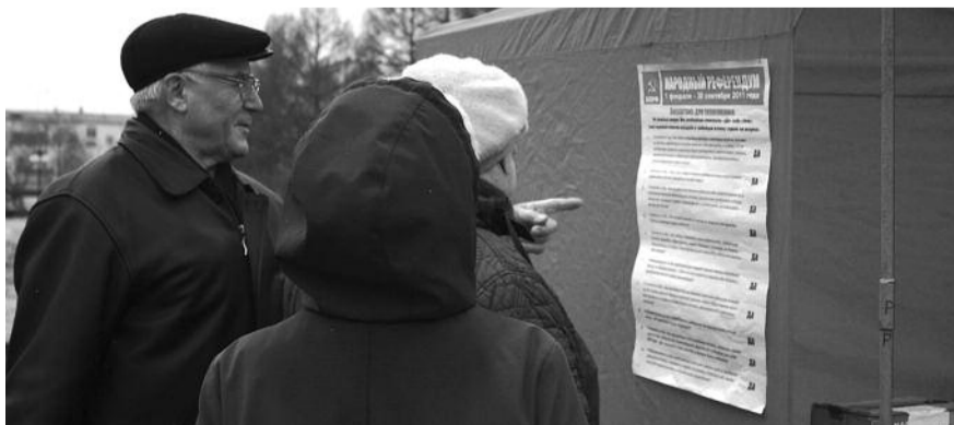
● НА ФОТО: ЧИНОВНИКИ ОБОЗВАЛИ ПРОВЕДЕНИЕ НАРОДНОГО РЕФЕРЕНДУМА «ТОРГОВЛЕЙ»