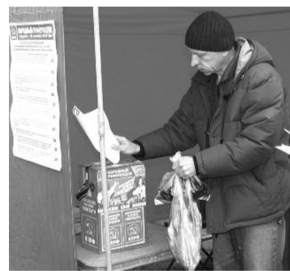
● НА ФОТО: ГОЛОСОВАНИЕ ПРОДОЛЖАЕТСЯ

ставителей КПРФ на выборах. Понятно, что местная власть, особенно в преддверии выборов в Государственную думу, постарается приложить все усилия для дискредитации коммунистов и провокаций против них. Ведь Народный референдум КПРФ — это один из самых эффективных методов агитации за КПРФ, наиболее доступно разъясняющий избирателям программу нашей партии. За несколько дней в референдуме приняли участие свыше тысячи человек. В понедельник наш райком подведет итоги, однако голосование еще продолжается, несмотря ни на какие провокации и препоны.