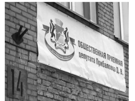
● НА ФОТО: ДЕПУТАТСКИЕ ПРИЕМНЫЕ РАСПРЕДЕЛЯЮТСЯ ПО ПАРТИЙНОМУ ПРИЗНАКУ?