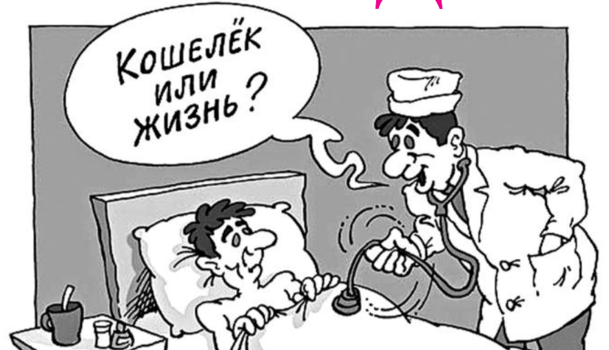
● НА РИС.: УЛЬТИМАТУМ СОВРЕМЕННОЙ РОССИЙСКОЙ СИСТЕМЫ ЗДРАВООХРАНЕНИЯ