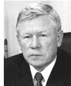
● НА ФОТО: СКОРЫЙ ОТПАВНИК ПЕРМИНОВ

Вице-премьер РФ Сергей ИВАНОВ подтвердил скорую отставку главы Роскосмоса Анатолия ПЕРМИНОВА . Напомним, что Роскосмос недавно был в центре глобального скандала в связи с неудачным запуском ракет. В результате ошибок в расчетах была сорвана программа формирования орбитальной группировки спутников ГЛОНАСС, которую Россия строит в качестве альтернативы американской GPS.