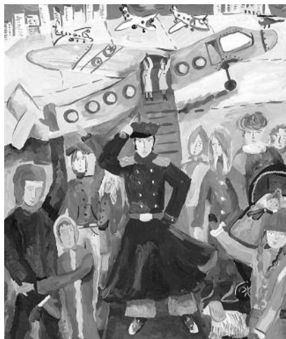
● НА РИС.: «ВОЗВРАЩЕНИЕ ГАГАРИНА»