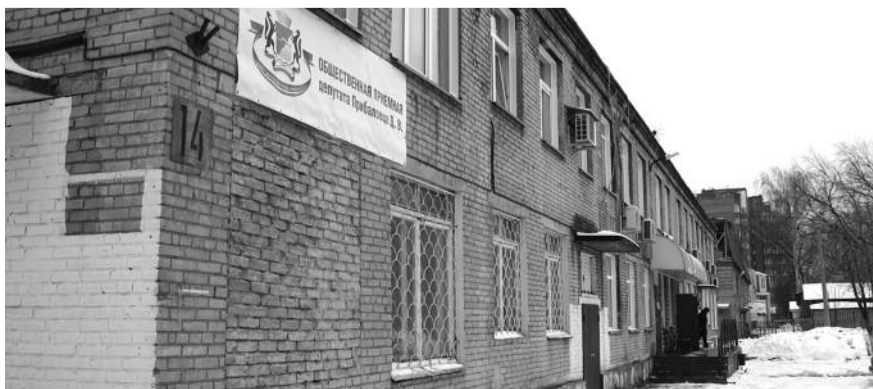
● НА ФОТО: ВМЕСТО ДЕТСКОГО САДА — ПРИЕМНАЯ ДЕПУТАТА-ЕДИНОРОССА