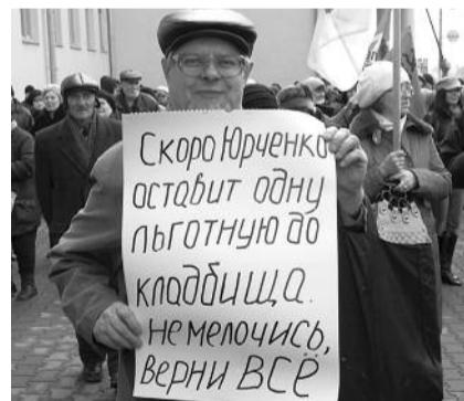
● НА ФОТО: ЛЮДИ — ЗА ПОЛНУЮ ОТМЕНУ ОГРАНИЧЕНИЙ ЛЬГОТНЫХ ПЕОЕЗДОК

Трудно, однако, сказать, что запоздалая доброта правительства к части льготников приведет к полному удовлетворению возмущенной общественности. Уже 15 апреля