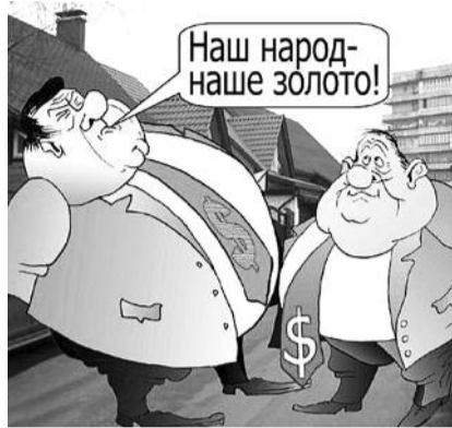
● НА РИС.: ВСЕ ДУМЫ — ТОЛЬКО О НАРОДЕ