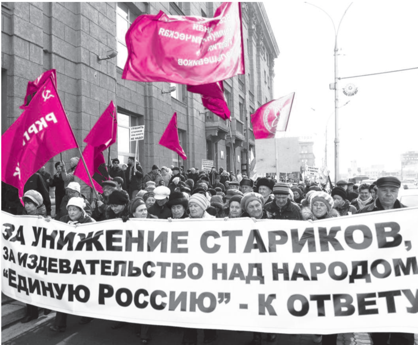
● НА ФОТО: ПОЛТОРЫ ТЫСЯЧИ ЧЕЛОВЕК ВЫШЛИ НА УЛИЦУ, ЧТОБЫ ОТСТОЯТЬ СВОЕ ПРАВО НА БЕЗЛИМИТНЫЙ ПРОЕЗД В ОБЩЕСТВЕННОМ ТРАНСПОРТЕ