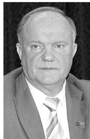
● НА ФОТО: ЛИДЕР КПРФ

Рабочая группа по исторической памяти Совета по правам человека при президенте РФ разразилась очередной порцией гробокопательских идей, именуемых планом де-сталинизации. Предлагается преследовать людей, отрицающих «преступления тоталитарного режима» в СССР, сделать день памяти жертв репрессий чуть ли не главным государственным праздником России.