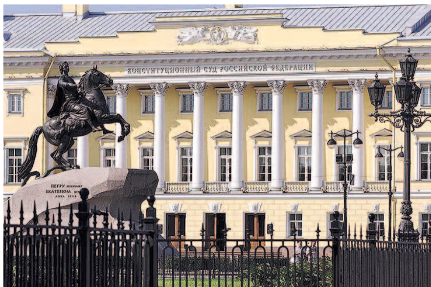
НА ФОТО: СУД ОСТАВИЛ ВОПРОС О РЕФОРМЕ «НА УСМОТРЕНИЕ ЗАКОНОДАТЕЛЯ»

КПРФ намерена и дальше оспаривать пенсионную «реформу», влияя на партию власти через акции протеста