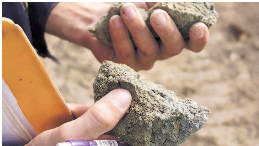
НА ФОТО: ГЕОЛОГИ ВЕДУТ РАЗВЕДКУ БОГАТСТВ РОССИИ

К 1991 году Советский Союз обладал первенством по всем видам полезных