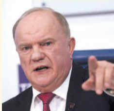
НА ФОТО: Г.А. ЗЮГАНОВ

«Здесь, в Госдуме, 23 апреля мы заслушаем отчет и практику Иркутской области и Новосибирского обкома по внедрению новых принципов управления и суперсовременных технологий», — рассказал Г.А. Зюганов.