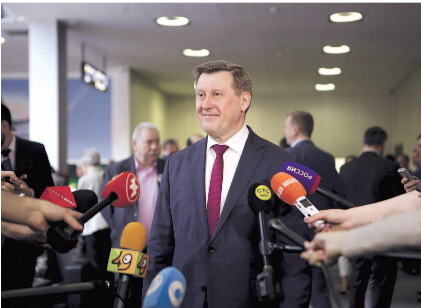
НА ФОТО: АНАТОЛИЙ ЛОКОТЬ ОТВЕЧАЕТ НА ВОПРОСЫ ЖУРНАЛИСТОВ В ПЕРЕРЫВЕ ФОРУМА «ГОРОДСКИЕ ТЕХНОЛОГИИ»