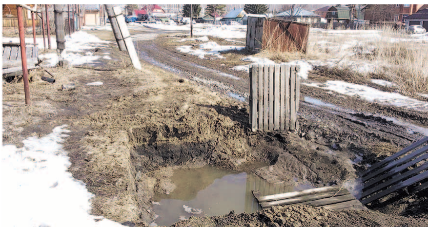
НА ФОТО: СМОЖЕТЕ НАЙТИ НА ФОТОГРАФИИ ДОРОГУ?