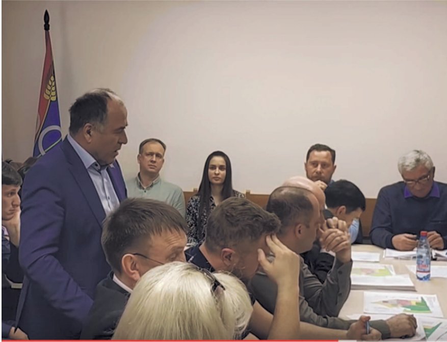
НА ФОТО: ДЕПУТАТЫ ОБЩЕСТВЕННИКОВ УСЛЫШАТЬ НЕ ЗАХОТЕЛИ

— То, что за принятие нового генплана на депутатской сессии проголосовали депутаты, не проживающие в Краснообске, это еще как-то можно понять.