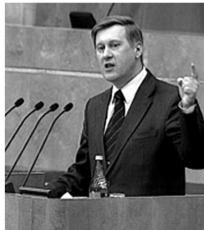
● НА ФОТО: АНАТОЛИЙ ЛОКОТЬ В ГОСДУМЕ

— На этот счет было специальное поручение комитету Госдумы по обороне, чтобы тот разъяснил Министерству обороны, что надо действовать обдуманно, а не гнаться за выполнением плана, — отметил Анатолий Локоть. — В противном случае