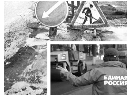
● НА ФОТО: ДЕНЕГ НА РЕМОНТ ДОРОГ НЕ ХВАТАЕТ, ЗАТО НА ПИАР — ДОСТАТОЧНО

Другими словами, денег хватит разве что на добрую порцию наклеек. Протяженность только одной Таскаевской трассы составляет 34 километра. И каждый километр стоит значительно больше миллиона рублей, элементарные расчеты показывают, что запланированных средств не хватит даже на эту дорогу. Для сравнения, ремонт только внутриквартальных проездов на одном из 40 округов в Новосибирске будет потрачено больше средств, чем на дорожный ремонт по всему Барабинскому району.