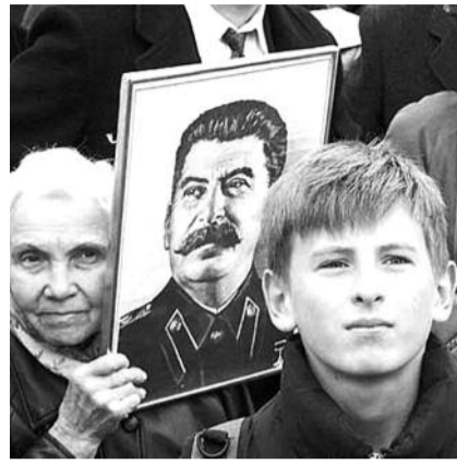
● НА ФОТО: «ДЕСТАЛИНИЗАЦИЯ» НЕ ПРОЙДЕТ!

Моему поколению еще довелось в детстве слышать рассказы живых участников тех событий. Поэтому, когда сейчас читаешь обширную публицистику, основанную на подлинных документах и свидетельствах