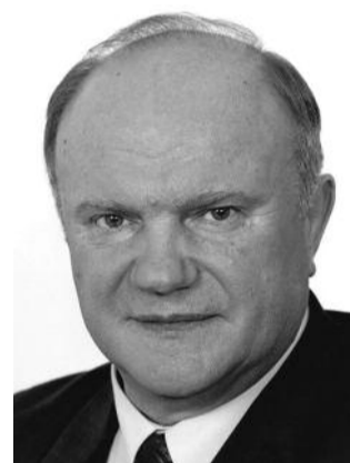
● НА ФОТО: ЛИДЕР КПРФ

Соотечественники! Семьдесят лет назад, 22 июня на нашу Родину вероломно напали оттоблицованные и до зубов вооруженные фашистские орды. Они пришли с заранее обдуманым и четко спланированным намерением — непременно стереть и уничтожить с лица земли первое в мире государство рабочих и крестьян — Союз Советских Социалистических Республик, истребить и закабалить наши народы, присвоить неисчислимые богатства страны, раскинувшейся на одну шестую часть земной суши.