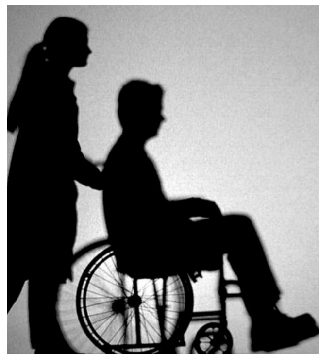
● НА ФОТО: БЕЗРАБОТИЦА СРЕДИ ИНВАЛИДОВ РАСТЕТ

По данным комитета по социальной политике Совета Федерации РФ безработица среди инвалидов трудоспособного возраста составляла на 1 января 2004 года в целом по России 70%. Занятость инвалидов трудоспособного возраста сократилась с 25-28% в дореформенный период до 11% в 1999 году. Согласно