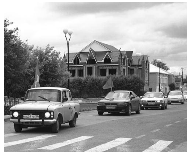
● НА ФОТО: КОЛОННА УЧАСТНИКОВ АВОПРОБЕГА ВЪЕЗЖАЕТ В ЧАНЫ

Но народ, несмотря на политику власти, в том числе и программу «десталинизации» знает и помнит о роли Верховного Главнокомандующего Сталина в Великой Победе советского народа. Коммунисты, ветераны и пионеры Чистоозерного района вместе с участниками пробега после митинга памяти у мемориала героев возложили цветы и к бюсту Сталина.