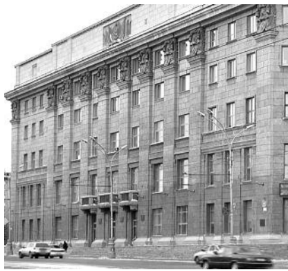
● НА ФОТО: ДЕПУТАТЫ ГОРСОВЕТА БУДУТ ИЗБИРАТЬСЯ ПО СМЕШАННОЙ СИСТЕМЕ?

Непростой темой для обсуждения на сессии стал вопрос о программе по формированию имиджа города Новосибирска. В течение нескольких месяцев депутаты, рекламисты, маркетологи и чиновники пытались разработать программу, по итогам реализации которой