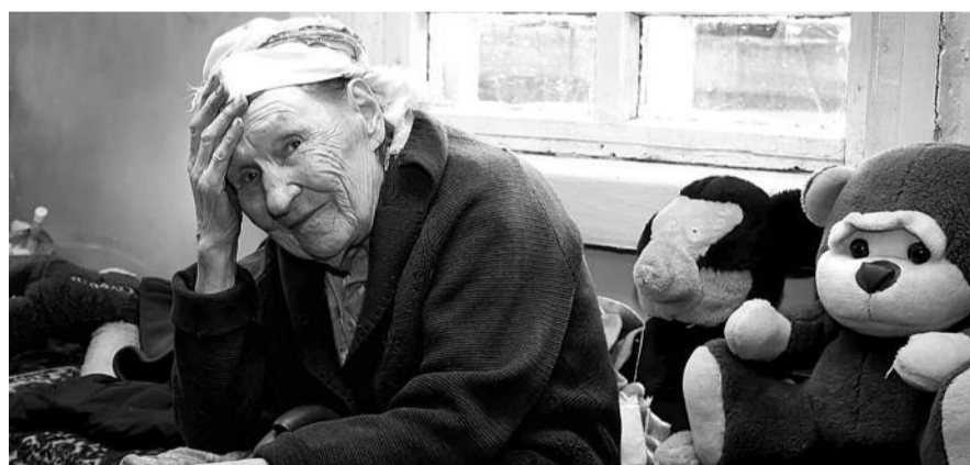
● НА ФОТО: ВЧЕРАШНИЕ ПОБЕДИТЕЛИ ФАШИЗМА ОСТАВЛЕНЫ НА ПРОИЗВОЛ СУДЬБЫ

В социальной поддержке нуждается почти половина из 400 тысяч оставшихся на сегодня в живых ветеранов. Однако стандарты жизни, принятые для ветеранов в России, не укладываются ни в какие рамки цивилизованного мира. По мнению генерала, во многом это происходит из-за того, что в российском государстве ветеранами централизованно, системно никто не занимается. Ветераны по-прежнему «отданы на откуп» своим родным, близким и сердобольным людям. Системы на государственном уровне просто не существует.