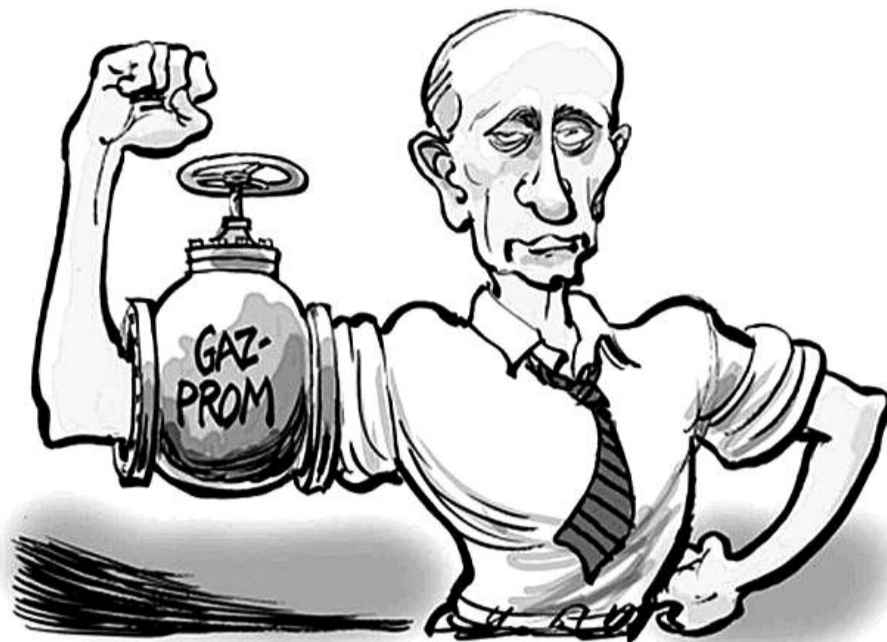
● НА РИС.: У ПУТИНА «РУКА НЕ ПОДНЯЛАСЬ» ОГРАНИЧИТЬ РОСТ ТАРИФОВ МОНОПОЛИЙ

Очевидно, взвесив все за и против, премьер объявил что у него «рука не поднялась, чтобы подписать это постановление — а именно: ограничить рост тарифов так называемых естественных монополий (ОАО «РЖД», по газу, по электричеству) только ростом инфляции в следующем