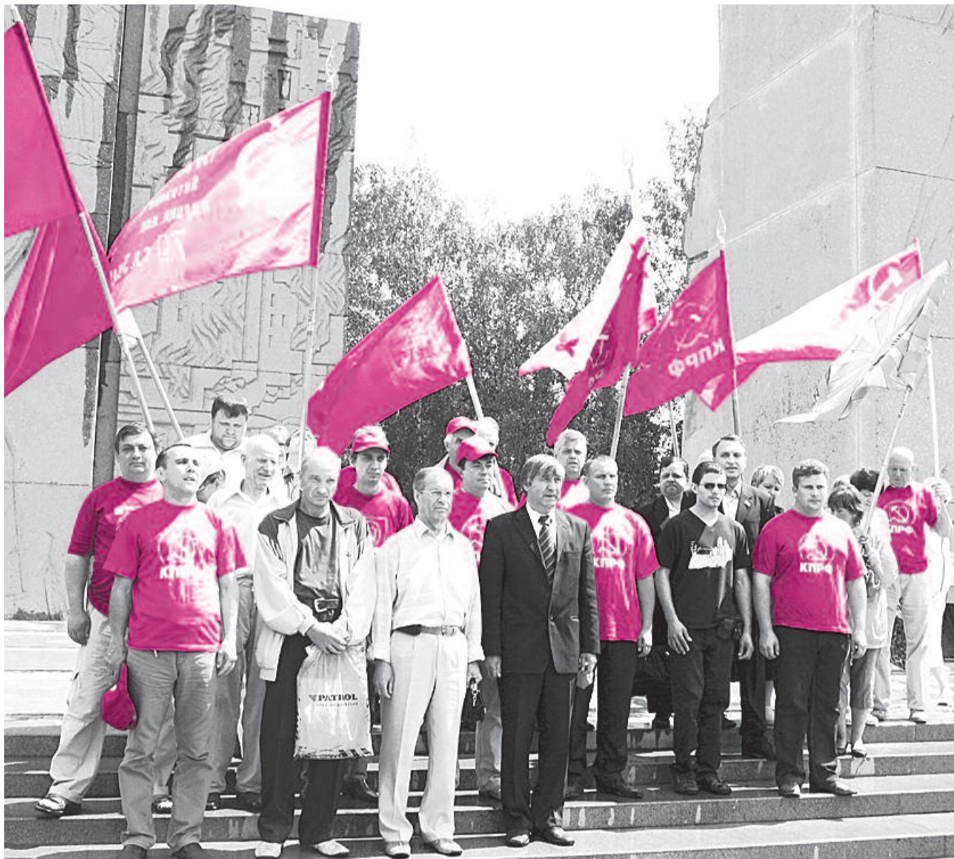
● НА ФОТО: АВТОПРОБЕГ ЗАВЕРШИЛСЯ 22 ИЮНЯ НА МОНУМЕНТЕ СЛАВЫ В НОВОСИБИРСКЕ