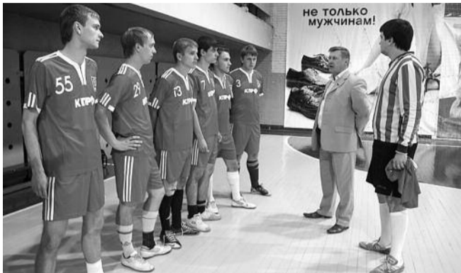
● НА ФОТО: АНАТОЛИЙ ЛОКОТЬ НАПУТСТВУЕТ ИГРОКОВ

Команда КПРФ стартовала в очередном 16-м по счету чемпионате 3-й лиги мини-футбола. В этом году команда КПРФ выступает в 3 лиге, так как в прошлом году в 4-й лиге она одержала победу. В первом матче команда КПРФ встречалась с ФК «Мотор». Матч закончился победой со счетом 10:4.