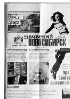
● НА ФОТО: ИСТОРИЯ «ВЕЧЕРКИ» ЗАКОНЧЕНА

Несмотря на решение суда, принятое по иску прокуратуры, не выплачивается задолженность по заработной плате журналистам старшей городской газеты «Вечерний Новосибирск». Судебное решение не выполняет ГУП НСО «ОТС», учрежденное Правительством Новосибирской области и финансируемое за счет средств областного бюджета.