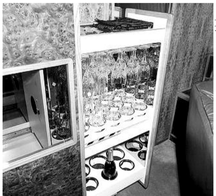
● НА ФОТО: В САМОЛЕТЕ ПРЕЗИДЕНТА ЕСТЬ ВСЕ НЕОБХОДИМОЕ

— Всем известно, что больше всего российские власти переживают за собственную безопасность и благосостояние,