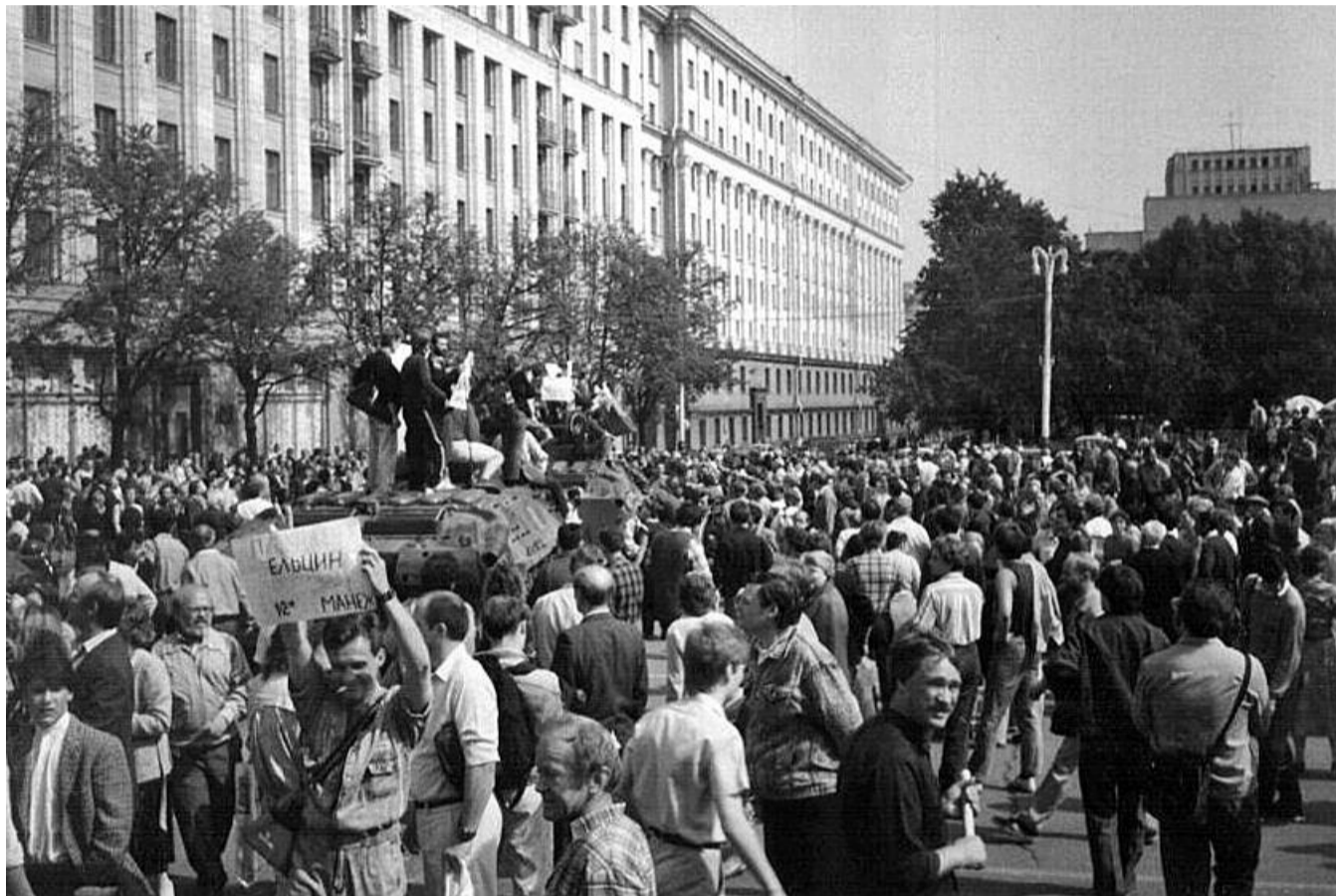
● НА ФОТО: ОНИ ДУМАЛИ, ЧТО СПАСАЮТ ДЕМОКРАТИЮ, А НА САМОМ ДЕЛЕ — УБИВАЛИ СТРАНУ