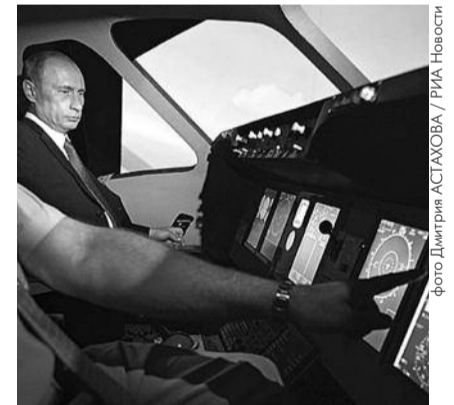
● НА ФОТО: В КАБИНЕ SUKHOI SUPERJET-100

себя ответственность и лично пересесть на Sukhoi SuperJet-100. В Новосибирской организации ЛКСМ состоит немало активистов, которые учатся на факультете летательных аппаратов НГТУ, и для них этот вопрос — не праздная политическая тема. Их не устраивает, что после очередного провала жители страны слышат новые упоминания истории про «подъем с колен» и «возрождение отечественного авиапрома».