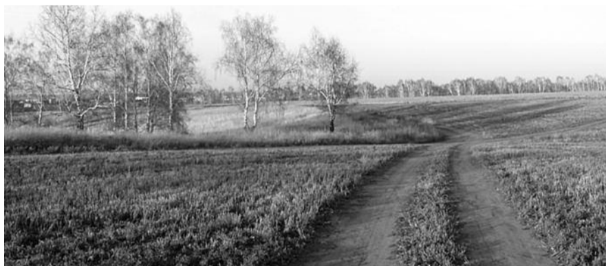
■ НА ФОТО: ПОСЛЕДСТВИЯ ЗАСУХИ 2012 ГОДА ОКАЖУТСЯ ГУБИТЕЛЬНЫМИ ДЛЯ ХОЗЯЙСТВ

Однако, как и с производством, проблема с кормами не стала экстренной по «естественным» причинам: