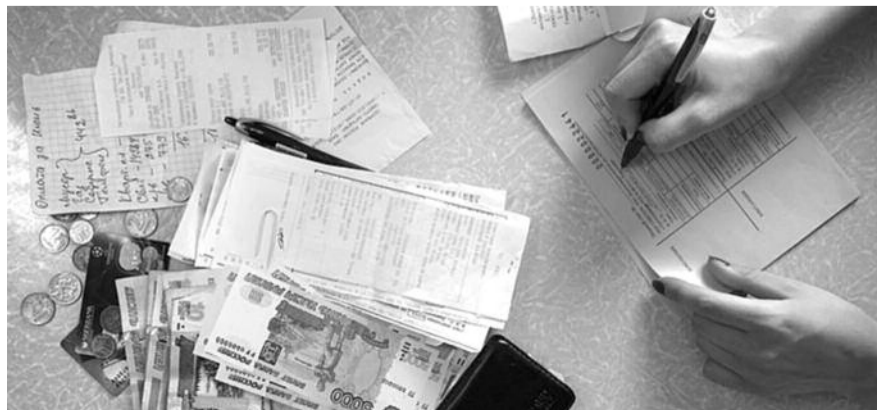
■ НА ФОТО: ЖКХ — ЖИВИ КАК ХОЧЕШЬ