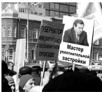
● НА ФОТО: НОВОСИБИРСК ПРОТЕСТУЕТ