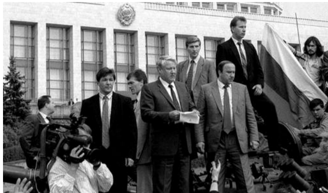
● НА ФОТО: ЕЛЬЦИН НА ТАНКЕ