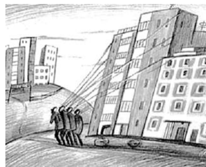
● НА РИС.: МОЖЕШЬ ПЛАТИТЬ — ЖИВИ, НЕ МОЖЕШЬ — ВАЛИ!

каждой квартире счетчики — чтобы сосед за стеной не помылся горячей водой за счет соседа) давно овладели рыночными умами в РФ.