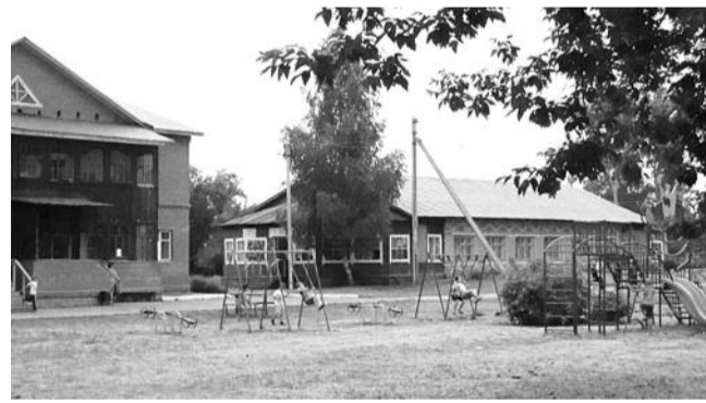
● НА ФОТО: «СИБСЕЛЬМАШ» НЕ ЗАМЕЧАЕТ, ЧТО «ПАРУС» — ДЕЙСТВУЮЩЕЕ ПРЕДПРИЯТИЕ С ОБОРОТОМ ОКОЛО 40 МЛН. РУБЛЕЙ В ГОД

Коллектив обратился письменно практически во все региональные и федеральные органы власти, высказав свои предложе-