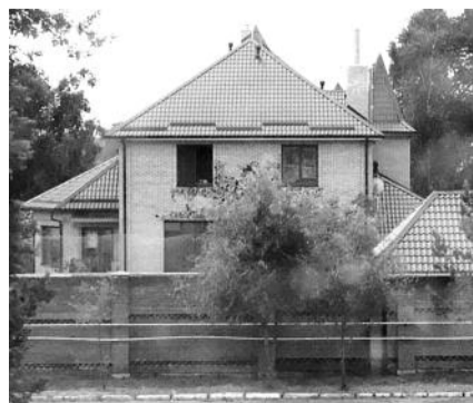
● НА ФОТО: КОТТЕДЖИ ВСЕ БЛИЖЕ И БЛИЖЕ ПОДСТУПАЮТ К «ПАРУСУ»