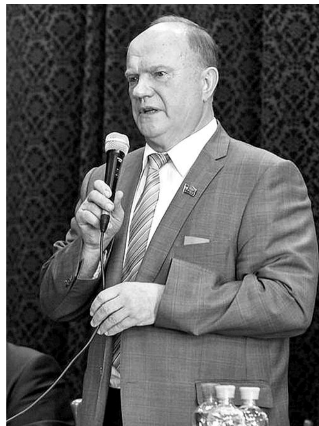
● НА ФОТО: ГЕННАДИЙ ЗЮГАНОВ ОТКРЫВАЕТ ЗАСЕДАНИЕ ПЛЕНУМА

ВОСЬМОЕ. Отчетно-выборная кампания в партии призвана активизировать работу по формированию резерва кадров. Для