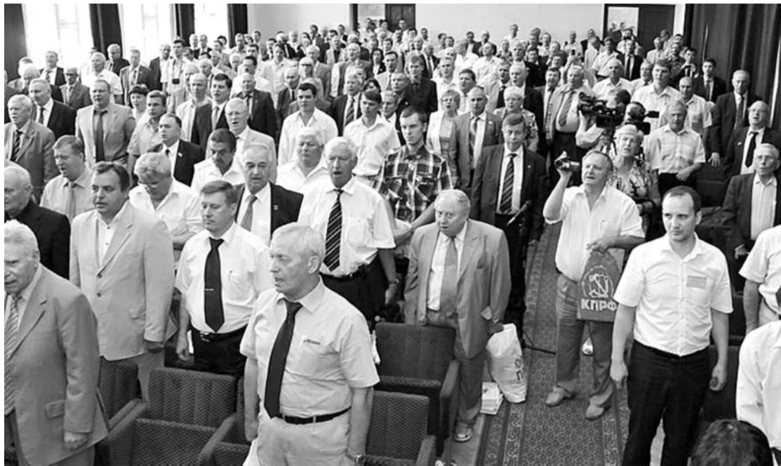
● НА ФОТО: ИСПОЛНЕНИЕ ИНТЕРНАЦИОНАЛА ПЕРЕД НАЧАЛОМ РАБОТЫ ПЛЕНУМА