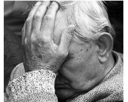
● НА ФОТО: СРЕДНЕСТАТИСТИЧЕСКОМУ МУЖЧИНЕ ПРИДЕТСЯ РАБОТАТЬ ВСЮ ЖИЗНЬ

Другой нюанс заключается в том, что продолжительность жизни в России, к сожалению, просто не позволит многим выйти на пенсию. Например, среднестатистическому мужчине, чтобы заработать 45 лет непрерывного трудового стажа, в случае получения какого-либо образования выше начального, придется выходить на