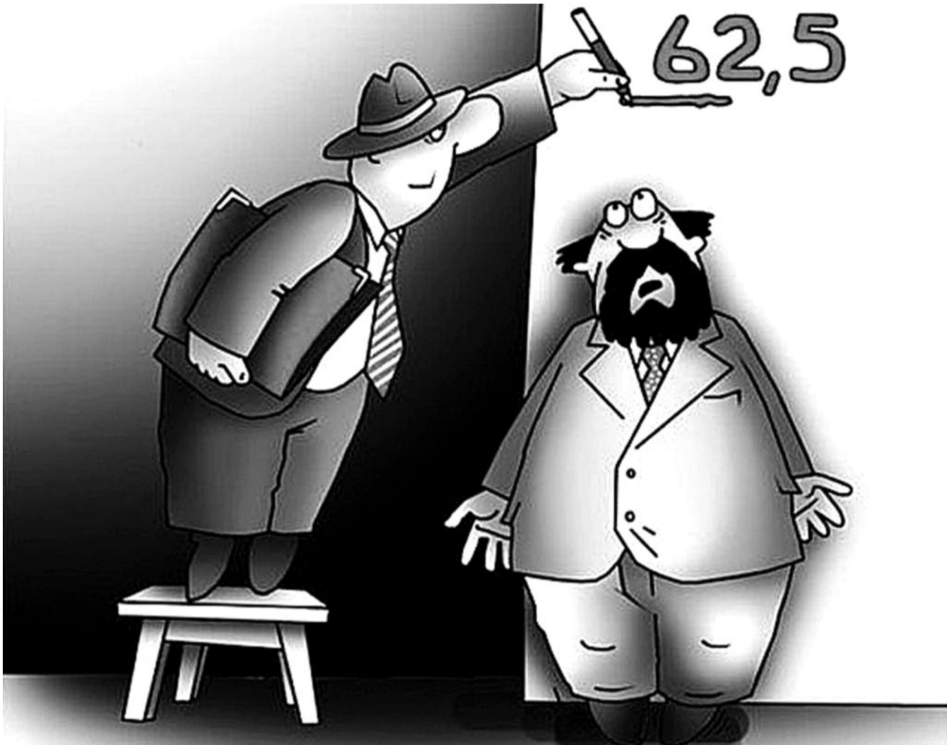
● НА ФОТО: ЧИНОВНИКИ ХОТЯТ УВЕЛИЧИТЬ ПЕНСИОННЫЙ ВОЗРАСТ ПУТЕМ ПОДНЯТИЯ ТРУДОВОГО СТАЖА ДО 40-45 ЛЕТ