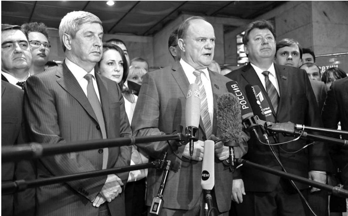
● НА ФОТО: ПРЕСС-КОНФЕРЕНЦИЯ ПОСЛЕ ЗАВЕРШЕНИЯ ПЛЕНУМА

Пожалуй, должно стать правилом, что секретари горкомов и райкомов ставятся во главе партсписков на выборах не автоматически, а в зависимости от результатов работы местных комитетов. При этом роль и ответственность региональных комитетов при проведении муниципальных выборов необходимо усилить.