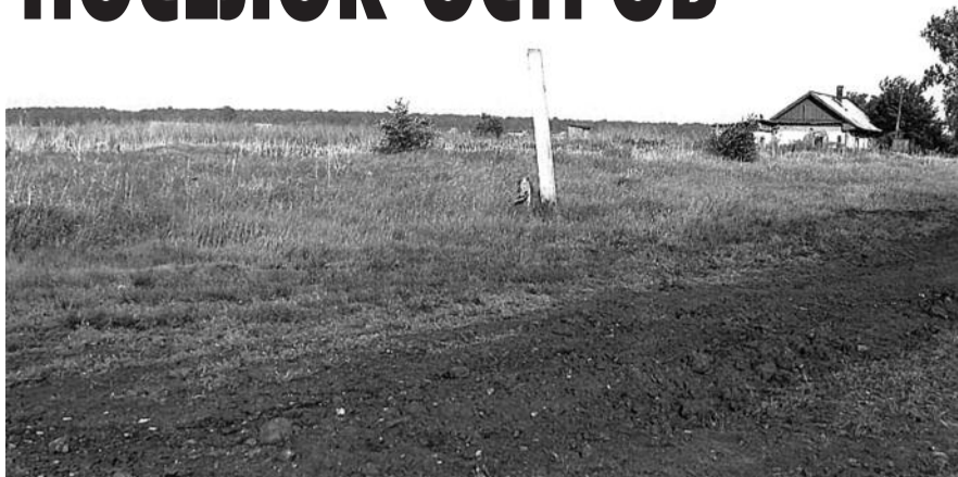
● НА ФОТО: В СОВЕТСКОЕ ВРЕМЯ ИЗЫЛИНКА БЫЛА МНОГОЛЮДНЫМ ПОСЕЛКОМ

— Но тут новая беда, — продолжает секретарь райкома КПРФ, — сразу с закрытием шахты были отменены почти все пригородные поезда, кроме одного, уходящего в шесть утра и возвращающегося только в час ночи.