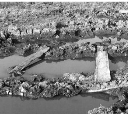
● НА ФОТО: УЛИЦА ВОКЗАЛЬНАЯ — ЕДИНСТВЕННАЯ «ДОРОГА» НА «БОЛЬШУЮ ЗЕМЛЮ»

Так было в советское время. С приходом новой власти шахта разделила судьбу многих промпредприятий в нашей стране — была закрыта. Штат станции был сокращен до самых минимальных пределов. При этом, как и в большинстве подобных случаев, новых рабочих мест для людей создано не было.