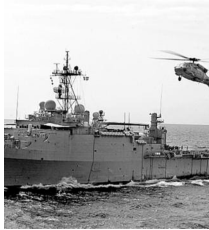
● НА ФОТО: ПЛАВУЧАЯ БАЗА США УЖЕ В ПЕРСИДСКОМ ЗАЛИВЕ

В этом же регионе находится экспедиционная ударная группа в составе трех больших десантных кораблей, в том числе авианесущего, и ударной атомной подводной лодки. Недавно в регион был также направлен эсминец противоракетной обороны, способный сбивать баллистические ракеты.