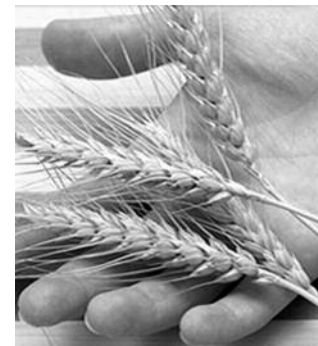
● НА ФОТО: ПОИСТИНЕ «ЗОЛОТАЯ» ПШЕНИЦА