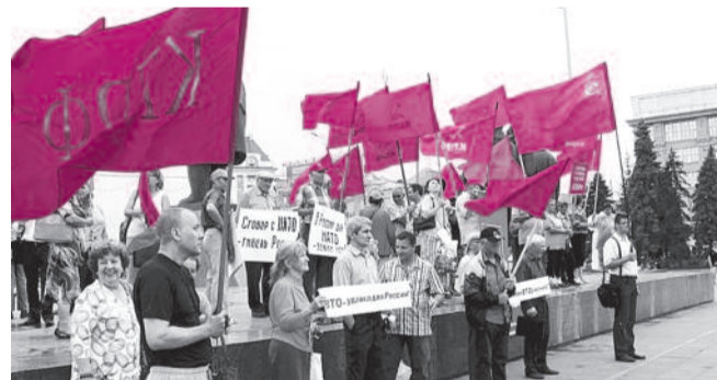
● НА ФОТО: ПИКЕТ ПРОТИВ ВТО ПРОШЕЛ НА ПЛ. ЛЕНИНА 3 ИЮЛЯ