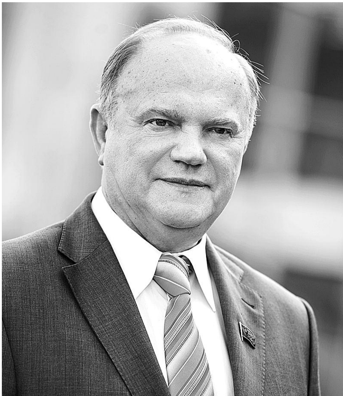
● НА ФОТО: ПРЕДСЕДАТЕЛЬ ЦК КПРФ ГЕННАДИЙ ЗЮГАНОВ

Уязвимость нашей экономики прямо связана с тем, что Еврозона — ключевой для России экспортный рынок. Замедление темпов роста в мире вызывает снижение