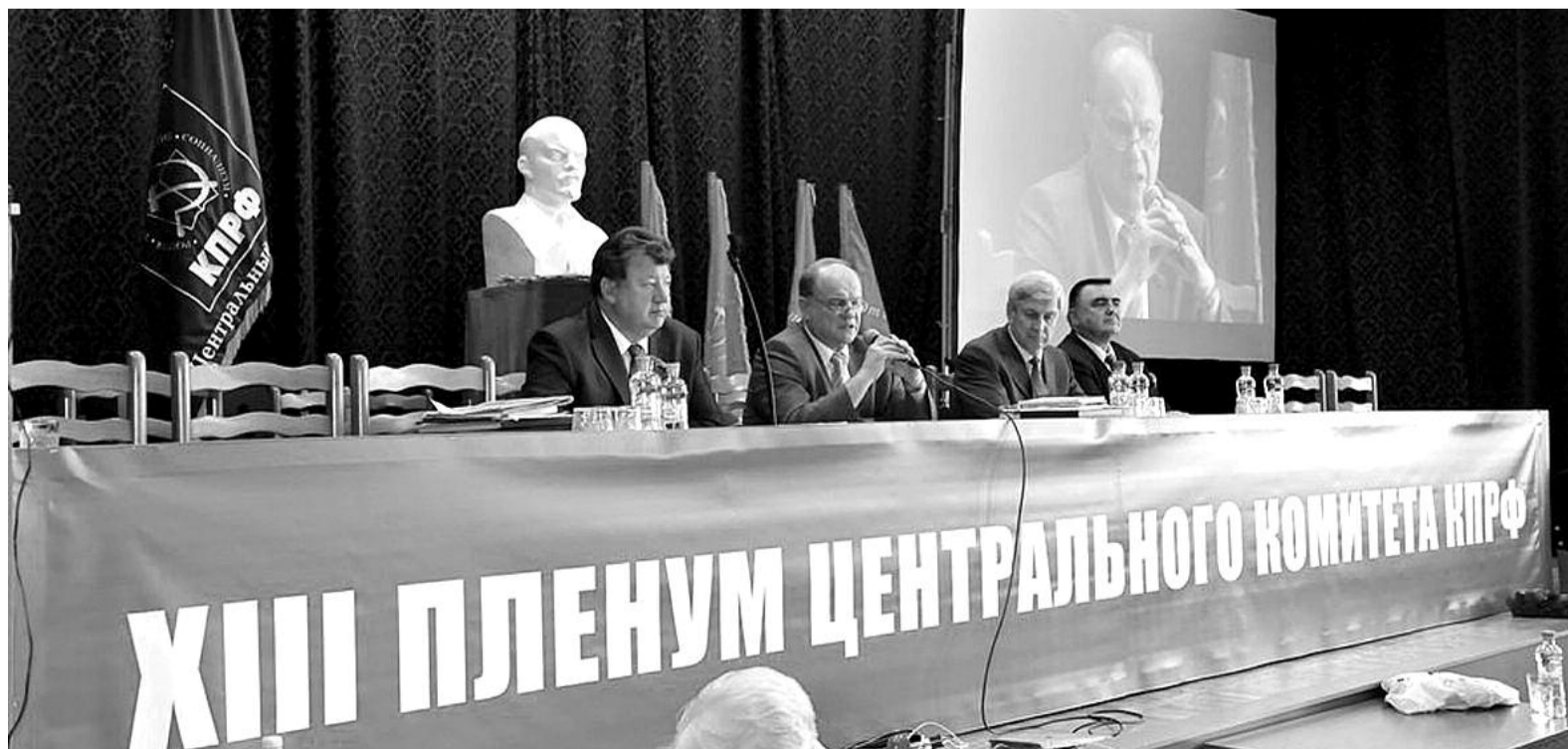
● НА ФОТО: В ПРЕЗИДИУМЕ ПЛЕНУМА

« Члену КПРФ необходимо занимать активную, принципиальную политическую позицию, знать классового противника, давать ему уверенный идейный отпор, говоря с людьми доходчиво и убедительно »