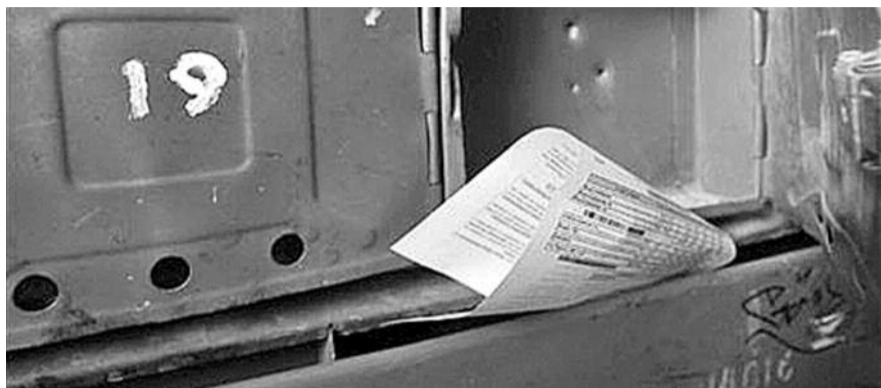
● НА ФОТО: В ИЮЛЬСКИХ КВИТАНЦИЯХ ЗА УСЛУГИ ЖКХ БУДУТ УЖЕ СОВСЕМ ДРУГИЕ ЦИФРЫ

Сколько это составит в конкретных цифрах, сообщает на своем сайте департамент по тарифам Новосибирской области. Так, цены на горячую воду для потребителей «СибЭко» (один из основных поставщиков для населения города Новосибирска) с 1 июля повышаются с 70,3 рубля до 74,43 рубля за кубометр, то есть, на 5,9% (цены действительны лишь в том случае, если в доме закрытая система ГВС). Следующее повышение тарифа ждет новосибирцев с 1 сентября: в начале осени горячая вода подорожает на 0,9% — до 75,1 рубля за кубометр. Тариф на холод-