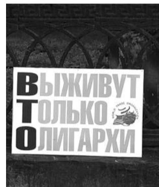
● НА ФОТО: ПЛАКАТОМ — ПРО ВТО!

3 июля состоялась Всероссийская акция протеста против вступления России во Всемирную торговую организацию. В рамках акции новосибирские коммунисты организовали в центре города пикет. Около 300 человек, несмотря на дождливую погоду, собрались под красными знаменами на площади Ленина, чтобы выразить протест предательства экономических интересов — подписания соглашения о вступлении страны в ВТО.