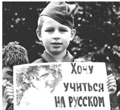
● НА ФОТО: НАКОНЕЦ-ТО УСЛЫШАЛИ?