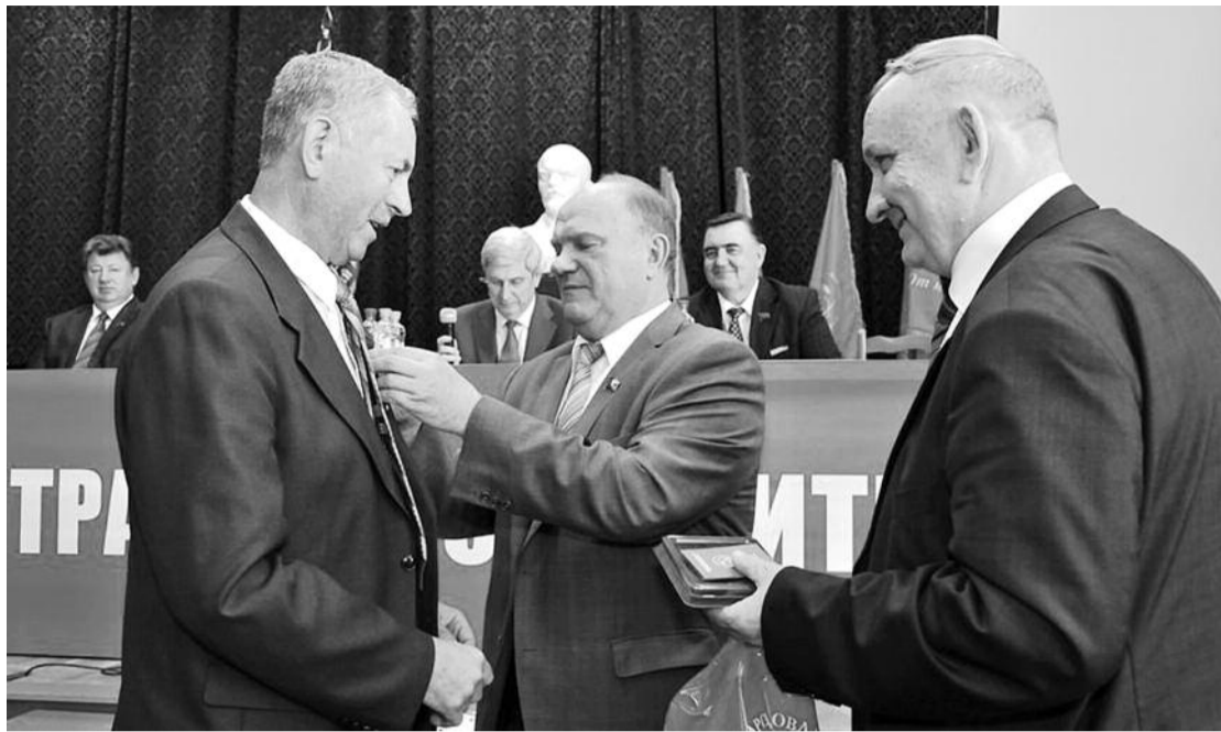
● НА ФОТО: НАГРАДЫ — ЗАСЛУЖЕННЫМ ПАРТИЙНЫМ РАБОТНИКАМ

ТРЕТЬЕ. Среди проблем субъективного свойства — инертность и примиренческое отношение к власти некоторой части первых секретарей местных комитетов. У ряда секретарей горкомов и райкомов за последние годы выстроились слишком «доверительные» отношения с главами их территорий. Сближение при этом идет обоюдно. Под разговоры о том, что большая политика делается в Москве, а на местах надо