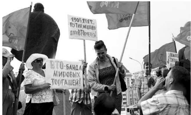
● НА ФОТО: НЕСМОТЯ НА ДОЖДЬ, ПИКЕТ СОБРАЛ ОКОЛО 300 ЧЕЛОВЕК