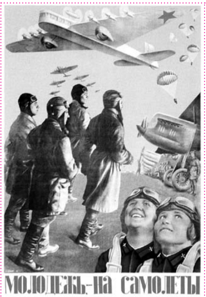
НА ФОТО: СОВЕТСКИЙ ПЛАКАТ 1934 ГОДА. СЕЙЧАС ЛОЗУНГИ УЖЕ ДРУГИЕ — «ИНОСТРАНЦЫ, — НА НАШИ САМОЛЕТЫ!»