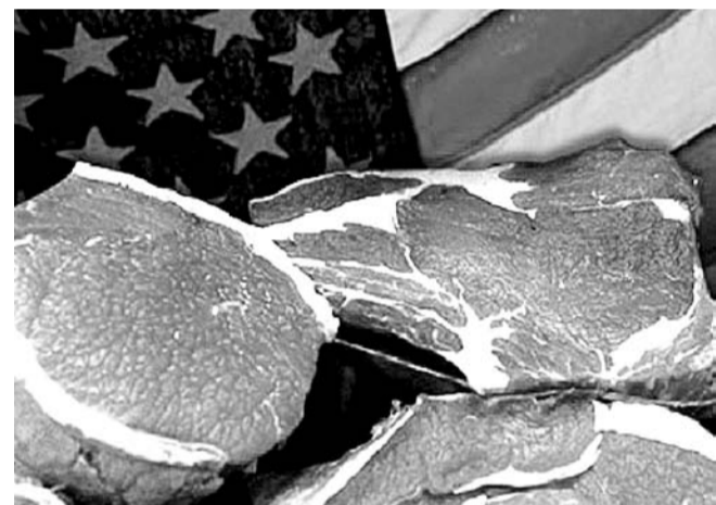
НА ФОТО: АМЕРИКАНСКОЕ МЯСО ЗАПРЕТИЛИ ВВОЗИТЬ В РОССИЮ

Обмен любезностями начался еще в декабре прошлого года, когда ОНИЩЕНКО потребовал прекратить ввозить в Россию мясо с вредным для человека гормоном. Согласно заявлению главного санврача, «применение рактопамина сопровождается снижением массы тела, нарушением репродуктивной функции, учащением заболевания маститом молочного стада, что приводит к резкому ухудшению качества и безопасности молока». В ответ американцы заявили о политической подоплеке этого шага, дескать, про рактопамин Россия «вспомнила» в ответ на список «Закон Магнитского», принятого Сенатом США. ОНИЩЕНКО напомнил американской стороне, что рактопамин значится в списке запрещенных веществ в 160 странах мира.