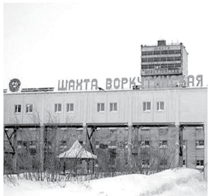
НА ФОТО: В РЕЗУЛЬТАТЕ ВЗРЫВА МЕТАНА НА ШАХТЕ В КОМИ ПОГИБЛО 18 ЧЕЛОВЕК

В отношении еще 19 инженерно-технических работников шахты уголовное