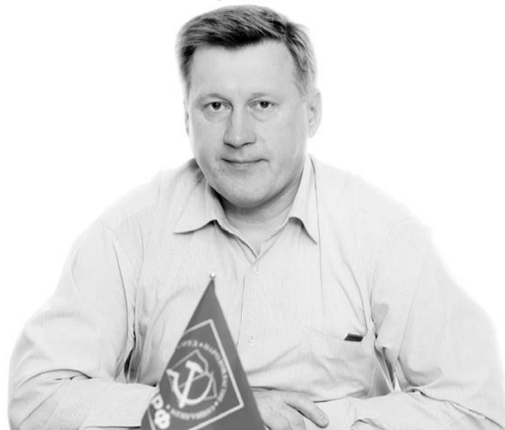
НА ФОТО: ЛИДЕР НОВОСИБИРСКИХ КОММУНИСТОВ АНАТОЛИЙ ЛОКОТЬ

зации — областной комитет. В дальнейшем жизнь и политические реалии отсеяли многих товарищей. Но надо сказать, что основное звено левого актива в нашей области всегда оставалось на позициях взаимодействия и поддержки КПРФ.