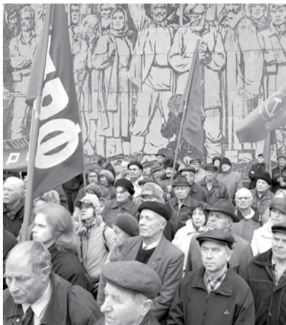
НА ФОТО: НЕОБХОДИМ ЛЕВЫЙ ПОВОРОТ!

Для нашей партии выстрадано теоретическое положение, подтвержденное всем ходом исторического развития, четко изложенное в Программе КПРФ: «Несмотря на временные отступления революционного движения, современная эпоха представляет собой переход от капитализма к социализму. <...> Подтверждается ленинское учение об империализме как высшей и последней стадии капитализма». Об этом свидетельствует нынешний мировой кризис капиталистической системы и, с другой стороны, достижения социализма с китайской спецификой, успехи социализации общественной жизни в Белоруссии и других странах. Все дело в сроках перехода и умения найти вектор движения применительно к конкретным историческим условиям.