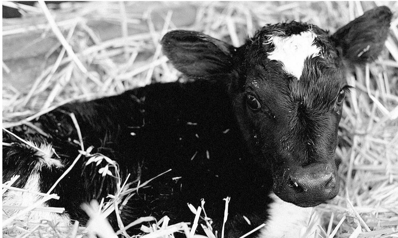
НА ФОТО.: СЕЛЬХОЗПРОИЗВОДИТЕЛИ НЕ МОГУТ САМИ ПЕРЕЖИТЬ ПОСЛЕДСТВИЯ ЗАСУХИ 2012 ГОДА. ГОСУДАРСТВО ПОМОГАТЬ НЕ ТОРОПИТСЯ