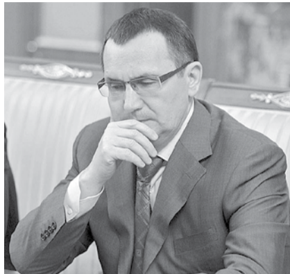
НА ФОТО: УСЛЫШИТ ЛИ МИНИСТР?

2 Исключить всякого рода ограничения на получение государственной поддержки сельхозпроизводителей в виде задолженности по налогам, выплате заработной платы и т.д. Режим господдержки должен быть оператив-