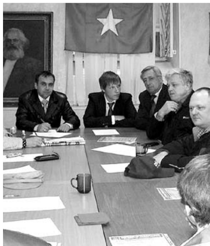
НА ФОТО: НА ПАРТИЙНОЙ КОНФЕРЕНЦИИ