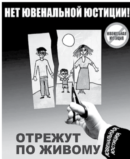
НА РИС.: ЗАЩИТИМ НАШИ СЕМЬИ!

Не только депутаты, но и общественность пытается противостоять этому чиновничьему беспределу. По примеру стран Запада созданы движения в защиту детства, общественные организации. Они очень резко выступают против такого позорного явления. Что касается Запада, то там фактов нарушений прав детей и семей очень много, но у нас в стране, учитывая повсеместное беззаконие и безнаказанность для представителей органов власти, это явление рискует принять самые уродливые формы. И даже уже принимает, учитывая ранее приведенные факты отъема детей у семей и необоснованное лишение людей родительских прав. Одно дело, когда родители в семьях действительно ведут асоциальный образ жизни, что представляет опасность для детей, как это было в Искитимском районе, где родители издевались над ребенком, или в Ново-