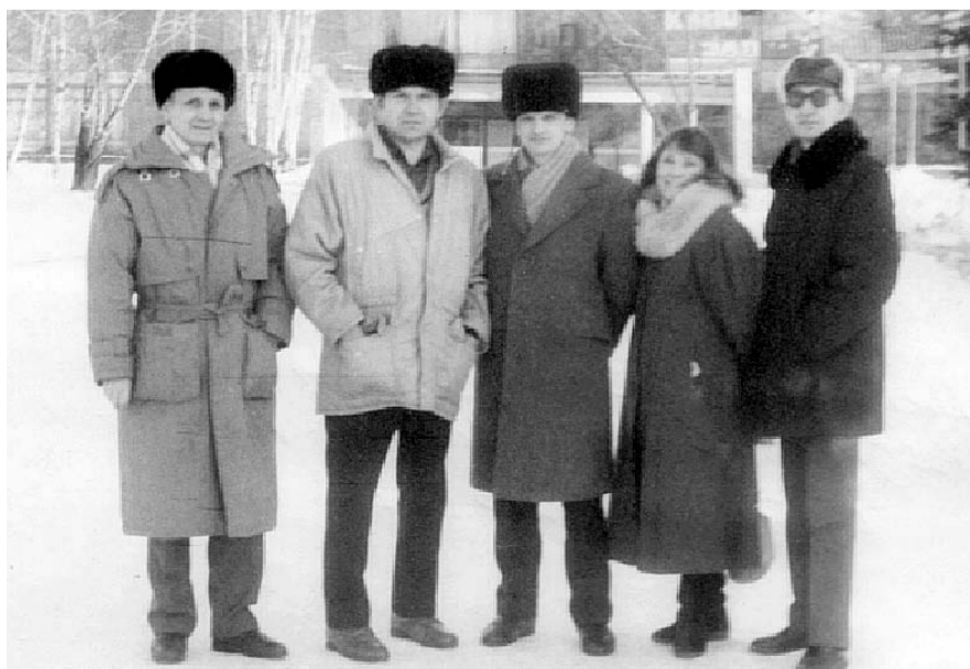
НА ФОТО: ДЕЛЕГАТЫ II ЧРЕЗВЫЧАЙНОГО СЪЕЗДА (13-14 ФЕВРАЛЯ 1993 ГОДА)

Если разделять эти два десятилетия на этапы, то на начальном этапе КПРФ сумела сыграть интегрирующую роль в объединении разрозненных политических сил коммунистической и социалистической ориентации. Политический спектр Новосибирской области после запрета КПСС на левом фланге был крайне разнообразен — «Трудовой Новосибирск», «Товарищ» в Бердске, РКРП, Социалистическая партия трудящихся, Ленинская социалистическая партия рабочего класса и другие. Именно КПРФ сумела выкристаллизовать свою организацию в этой очень противоречивой среде. На первом этапе все активисты вошли в руководящее звено партийной органи-