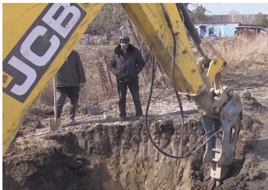
НА ФОТО: В ЗАМОРОЖЕННЫХ ТРУБАХ ДО СИХ ПОР НЕТ ВОДЫ

Почему решение обычной для коммунальщиков проблемы в данном случае растянулось вместо нескольких