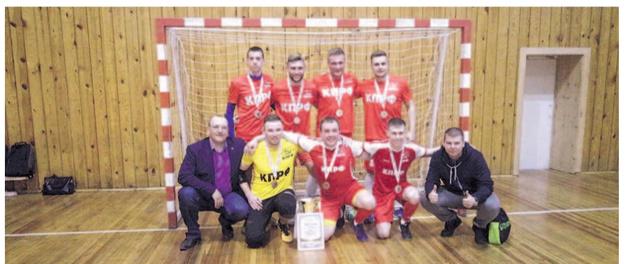
НА ФОТО: КОМАНДА КПРФ — БРОНЗОВЫЙ ПРИЗЕР «ЛИГИ БРЕНДОВ»

Уверенные выступления наших футболистов, не раз гонимых соперников, в том числе и «всухую», позволили им окончательно закрепиться на первом месте в «Лиге Брендов». 9 апреля 2018 года футболисты команды КПРФ завершили выступления группового этапа в рамках Лиги брендов по мини-футболу, выйдя в плей-офф соревнова-