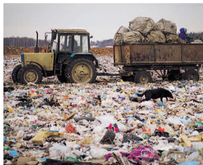
НА ФОТО: СВАЛКА ВМЕСТО СОВРЕМЕННОГО МУСОРОПЕРЕРАБАТЫВАЮЩЕГО ЗАВОДА

Новосибирский район, как и Московская область, окружает со всех сторон мегаполис. Поэтому неудивительно, что жители района весь прошлый год вели борьбу с размещением новых свалок и, как никто, понимают проблемы жителей Подмоскovie. По словам первого секретаря Новосибирского местного комитета КПРФ, организатора митингов против размещения свалки в бассейне