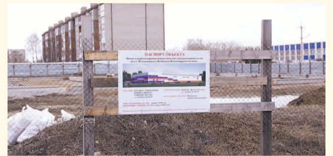
НА ФОТО: СТРОИТЕЛЬНАЯ ПЛОЩАДКА В КОНЦЕ ГОДА ДОЛЖНА СТАТЬ СПОРТКОМПЛЕКСОМ С ИСКУССТВЕННЫМ ЛЬДОМ