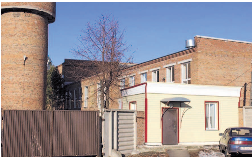
НА ФОТО: НФС, В КОТОРУЮ ВЛОЖИЛИ БОЛЕЕ 600 МЛН РУБЛЕЙ, НЕ ДАЕТ ПИТЬЕВУЮ ВОДУ