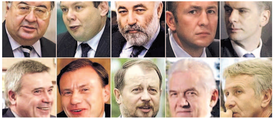
НА ФОТО: БОГАТЕЙШИЕ ЛЮДИ РОССИИ

На восьмом месте рейтинга Форбс — совладелец LetterOne Holdings и «Альфа-Групп» Михаил ФРИДМАН (15,1 млрд долларов).