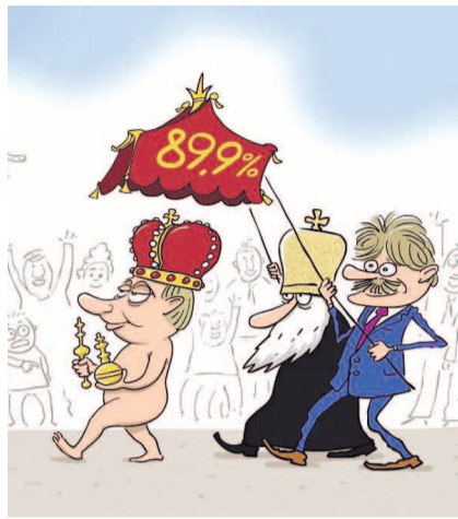
НА ФОТО: В БЫЛЫЕ ВРЕМЕНА РЕЙТИНГ ОЦЕНИВАЛИ ПОЧТИ В 90%

Если говорить о внутренней политике, то здесь высокий рейтинг доверия к Путину строился по известной формуле «царь хороший — бояре (то есть министры и губернаторы) плохие». В массовом сознании существовал руководитель, который может справиться со всеми и отправить в отставку любого, — Путин. В ситуации с губернатором Кемеровской области Аманом ТУЛЕВЫМ этот механизм, долгое время безукоризненно работавший, также дал осечку — «хозяин» Кузбасса, организовав свое избрание председателем областного Совета депутатов после того, как покинул пост губернатора, четко дал понять, кто здесь власть.