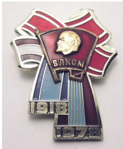
НА ФОТО: ЛЕНТЫ ШЕСТИ ОРДЕНОВ КОМСОМОЛА

На стройках пятилетки основным строителем была молодежь. Комсомольские организации Москвы, Ленинграда, Украины, Западной Сибири направили на Кузнецкстрой своих лучших