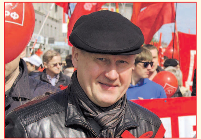
Мэр Новосибирска, первый секретарь Новосибирского обкома КПРФ Анатолий ЛОКОТЬ

Я поздравляю с Первомаем каждую новосибирскую семью, всех тружеников нашего города и желаю успехов, уверенности в завтрашнем дне, благополучия и хорошего весеннего настроения!