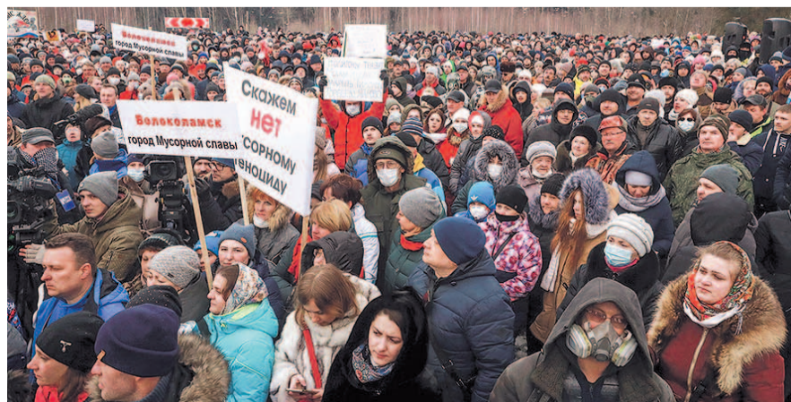
НА ФОТО: «МУСОРНЫЕ ПРОТЕСТЫ» ПРОКАТИЛИСЬ ПО РОССИИ