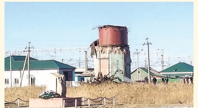
НА ФОТО: ОБРУШИВШИЙСЯ ПАМЯТНИК ИСТОРИИ