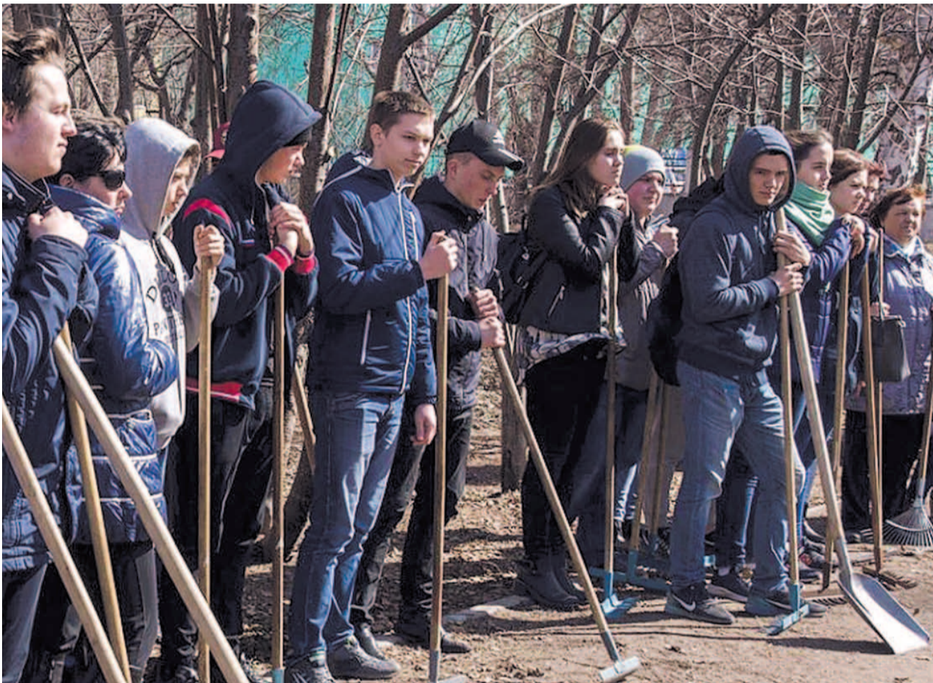
НА ФОТО: «ЧИСТО ТАМ, ГДЕ УБИРАЮТ»: ГОРОЖАНЕ ВЫШЛИ НА СУББОТНИКИ ВО ДВОРАХ, СКВЕРАХ И ПАРКАХ