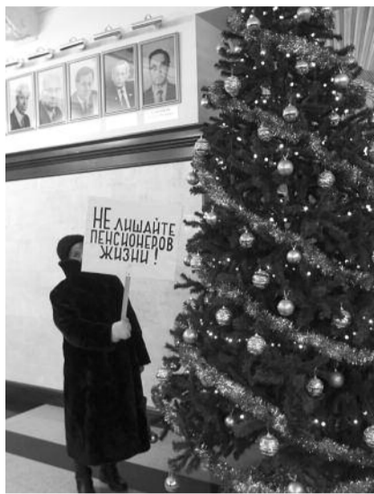
● НА ФОТО: «СПРАВОРОССЫ» НЕ УСЛЫШАЛИ ИЗБИРАТЕЛЕЙ (В ХОЛЛЕ МЭРИИ, 22 ДЕКАБРЯ)