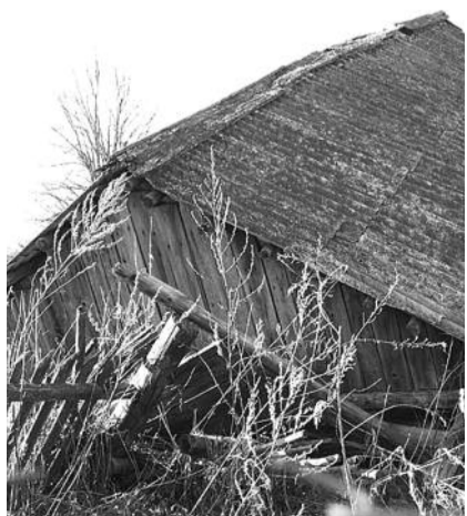
● НА ФОТО: РУССКАЯ ДЕРЕВНЯ ВЫМИРАЕТ...

состоянии. Население занимается, кто чем может. Кто стоит в центре занятости населения, кто занят личным хозяйством, кто уезжает на заработки в райцентр или куда-нибудь на сторону. Много селян снялось с насиженных мест, видя, что нет никакой перспективы. Осенью уехала медик с семьей, и мы остались без фельдшера. Правда, к нам ездит фельдшер из с. Сибирцево 2, а это — 35 км. Если кто-нибудь заболел, срочной медицинской помощи придется ждать долго, а можно и не дожидаться совсем — дороги-то у нас грунтовые, попробуй в распутицу и бездорожье добраться до нас!