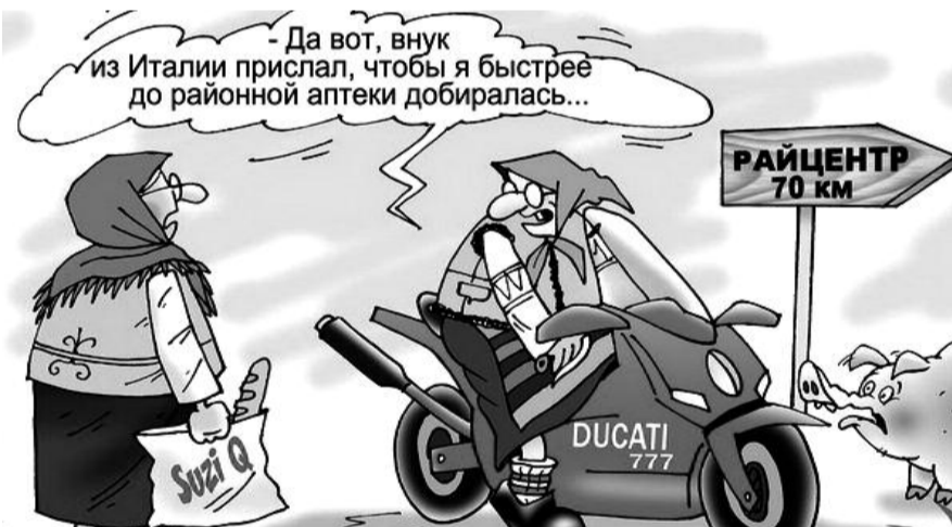
● НА РИС.: ФИЛОШЕНСКИЙ СЕЛЬСОВЕТ НАХОДИТСЯ В 86 КМ ОТ РАЙЦЕНТРА ВЕНГЕРОВО

В результате пагубных реформ, проводимых нынешней властью, деревня вымирает. Тому подтверждение — наше Филошенское муниципальное образование, т.е. Филошенский сельсовет. Мы находимся в 86 км от райцентра Венгерovo — это самое дальнее село в районе. В Советское время здесь, в Филошенке, был колхоз им. XVIII Партсъезда. Колхоз занимался земледелием и животноводством. Хозяйство было средних размеров. В моей памяти хозяйство не числилось среди отстающих хозяйств района, занимало средние места, а иногда и передовые позиции. В общем, был крепкий и стабильно развивающийся колхоз.