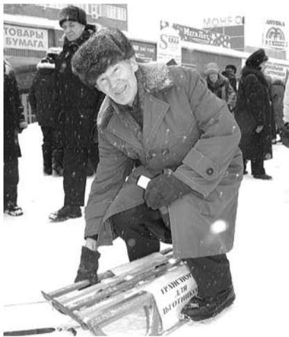
● НА ФОТО: «ТРАНСПОРТ ДЛЯ ЛЬГОТНИКОВ»