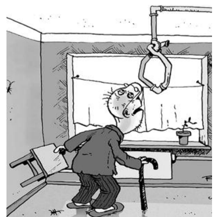
● НА РИС: ДО ТАРИФОВ НЕ ДОТЯНУТЬСЯ...