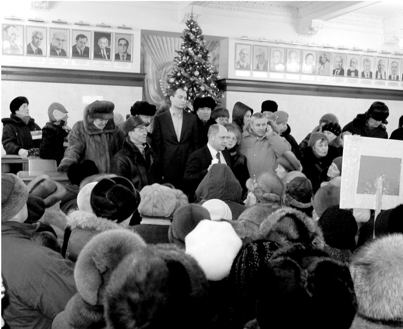
● НА ФОТО: НЕГОДУЮЩИЕ НОВОСИБИРЦЫ ОКРУЖИЛИ ВИЦЕ-МЭРА КСЕНЗОВА