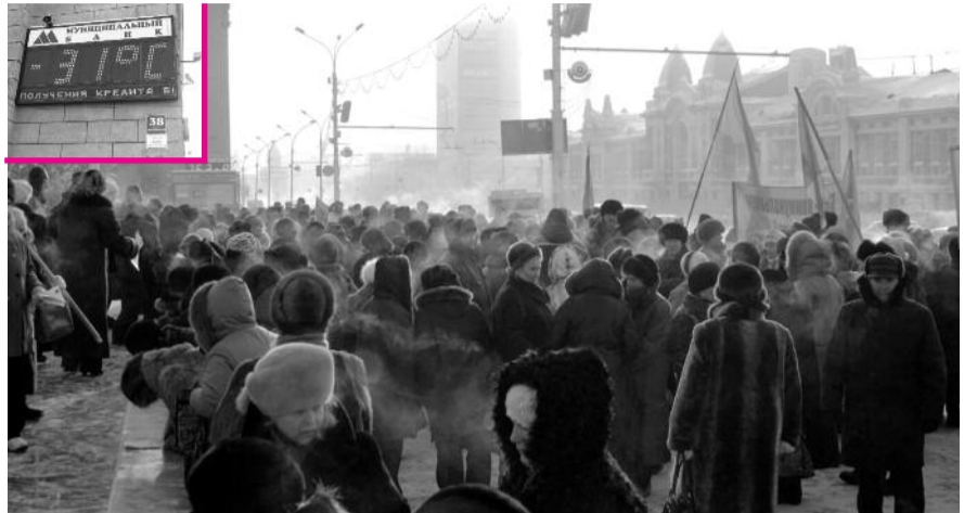
● НА ФОТО: ВО ВРЕМЯ ПРОВЕДЕНИЯ ПИКЕТА ТЕРМОМЕТР НА МЭРИИ ПОКАЗЫВАЛ -31°C

Массовыми были пикеты коммунистов в Железнодорожном, Калининском, Кировском, Октябрьском, Первомайском районах, городе Бердске. Кульминацией протестных действий стал пикет в среду, на центральную площадь Новосибирска пришло 400 человек.