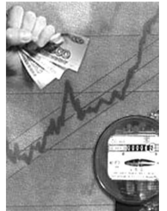
● НА РИС.: СТОИМОСТЬ КОММУНАЛЬНЫХ УСЛУГ ВЫРАСТЕТ НА 15%

За транспортным скандалом, связанным с лишением льготников безлимитного проезда в муниципальном транспорте, проблема тарифов на ЖКУ, вроде бы, незаметна. Однако, это не так. С 1 января стоимость коммунальных услуг увеличится до 15%, а услуги жилищные с нового года — вообще лишаются уровня предельного регулирования.