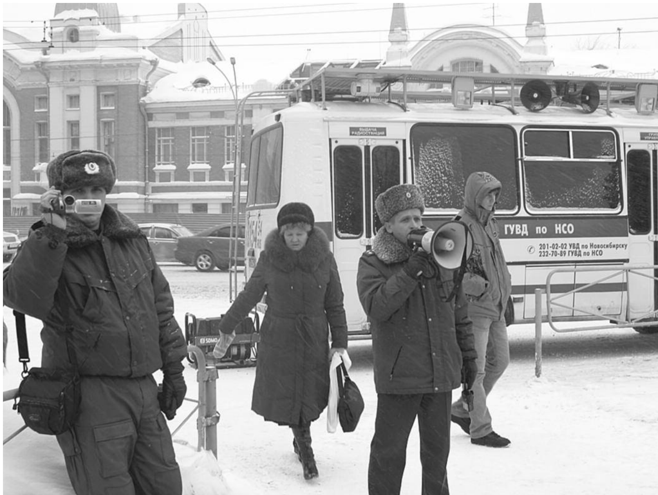
• НА ФОТО: ПРЕДСТАВИТЕЛИ ПРАВООХРАНИТЕЛЬНЫХ ОРГАНОВ УГОВАРИВАЮТ ПЕНСИОНЕРОВ РАЗОЙТИСЬ