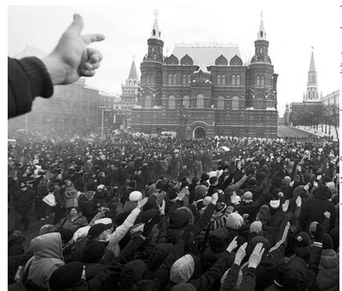
● НА ФОТО: 11 ДЕКАБРЯ НА МАНЕЖНОЙ ПЛОЩАДИ МОСКВЫ

Как могут выработать национальную идею те, кто торгует? У них одна идея — продать все: нефть, газ, лес... А дороже всего продать Родину. Возможно, наш президент искренне верит, что нашу молодежь надо учить так, как учат недорослей на Западе. Он ведь верит, что коррупцию можно победить с помощью партии «Единая Россия».