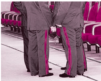
● НА ФОТО: ОЧЕРЕДЬ НА УВОЛЬНЕНИЕ?