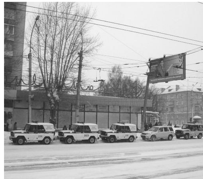
● НА ФОТО: 24 ДЕКАБРЯ НА САНКЦИОНИРОВАННЫЙ ПИКЕТ В ДЗЕРЖИНСКОМ РАЙОНЕ СОБРАЛОСЬ ОКОЛО 50 ЧЕЛОВЕК, А ДЛЯ ПОДДЕРЖАНИЯ ПОРЯДКА ВЛАСТЬ ВЫДЕЛИЛА 6 ЭКИПАЖЕЙ ППС

«Справедливая Россия» сразу отказалась от созыва сессии по ключевому вопросу повестки дня, фракция ЛДПР согласилась частично. Неожиданным для всех стало решение шести депутатов-единоборцев поддержать инициативу коммунистов. Однако спустя очень короткое время большинство из них отозвали свои подписи под воздействием «партийного руководства». Таким образом, коммунистам не удалось набрать 26 голосов депутатов для созыва сессии областного парламента. Очередная сессия состоится только в январе.