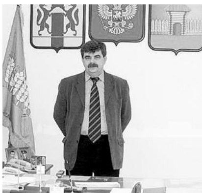
● НА ФОТО: ГЛАВА МОШКОВСКОГО РАЙОНА

3 Вдохнуть новую жизнь в образование, культуру, спорт.