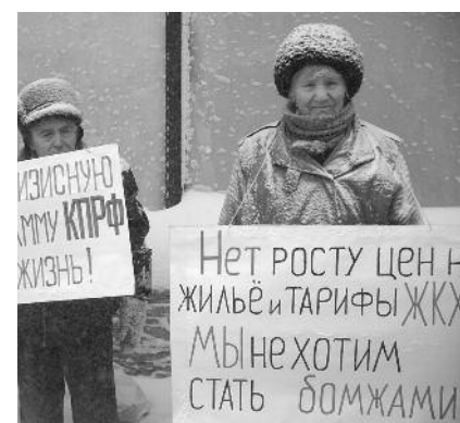
● НА ФОТО: МЫ БУДЕМ ПРОТЕСТОВАТЬ

Фракция КПрФ в Совете депутатов Новосибирска обратилась к прокурору