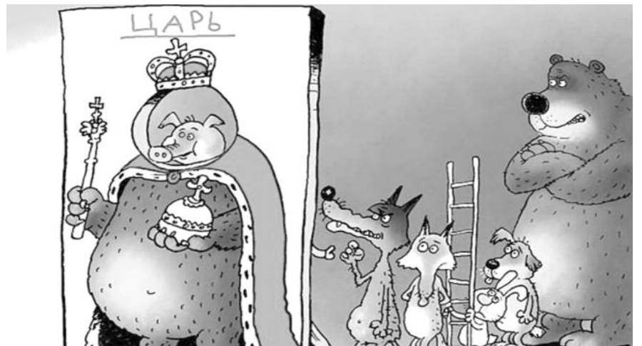
● НА РИС.: ПРИДЕТ ВРЕМЯ — ПРИДЕТСЯ СОРВАТЬ МАСКИ И ПОКАЗАТЬ СВОЕ ИСТИННОЕ ЛИЦО