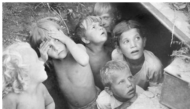
● НА ФОТО: «ДЕШЕВО ВЫ ОЦЕНИЛИ ГИБЕЛЬ НАШИХ РОДИТЕЛЕЙ!»

Недавно закончилась декада инвалидов, много об этом писали в газетах, кого-то поощрили подарками, к кому-то пришли на дом работники социальной службы, но многих и забыли. А нас, «детей войны» — инвалидов Вы и избранный председатель Законодательного собрания «обрадовали» тем, что решили отобрать у нас денежную поддержку в сумме 300 рублей и социальные услуги. Слишком ДЕШЕВО Вы оценили гибель наших родителей. Опять нас разделили, как раньше. На больных с местными льготами и больных с федеральными льготами, а теперь — на граждан, потерявших родителей в годы войны, и граждан, тоже потерявших родителей, но инвалидов. А ведь мы все, сироты войны, отработавшие по 40 лет и более, ветераны труда. Все лихолетье войны легло на наши детские плечи, а также на плечи наших матерей-вдов и стариков. Мы, дети войны, рано познали труд. В возрасте 9-11 лет работали, помогая стране возрождать ее хозяйство, разрушенное фашистами. Нам пришлось пережить голод, холод, разруху... Тяжелым было наше становление, но мы не обижались, ничего у государства не просили, работали, учились, создавали семьи, растили детей. Уверены, если бы не мы, не жировали бы сейчас капиталисты — миллиардеры, скупившие почти даром все, что мы с таким трудом строили. А инвалидность наша теперь не от легкой и сытой жизни — сказалось наше тяжелое детство.