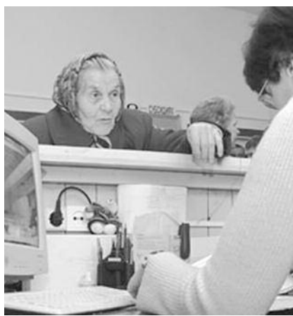
● НА ФОТО: ЧТОБЫ ПОЛУЧИТЬ ПРЕСЛОВУТЫЕ 300 РУБЛЕЙ НАДО ОТКАЗАТЬСЯ ОТ ЛЬГОТ

Но и это еще не все. Те из пенсионеров, кому удалось преодолеть все расставленные на их пути чиновниками препятствия, были «приятно» удивлены неожиданным фактом. А именно: чтобы получить обещанную прибавку, они должны отказаться от льгот. А те, кто не получают никаких льгот, — от получаемых на проезд 145 руб-