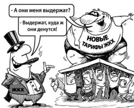
● НА РИС.: ВЫДЕРЖИМ?..

Те же, кто путаться в таблицах не желает, могут составить представление о стоимости услуг ЖКХ на основе цифр, принятых в плане социально-экономического развития. К примеру, для Новосибирска, расходы жилищных организаций на обслуживание квадратного метра жилья в 2011 году составит 17,58 рублей. Это только жилищный тариф. И, как говорится, «средний по палате», но представление дает