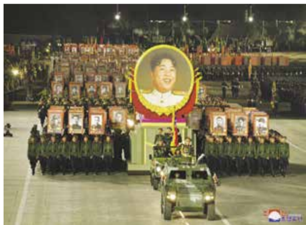
НА ФОТО: ВЕЧЕРОМ 27 ИЮЛЯ В ПХЕНЬЯНЕ СОСТОЯЛСЯ ВОЕННЫЙ ПАРАД В ОЗНАМЕНОВАНИЕ 70-ЛЕТИЯ ПОБЕДЫ КНДР В ОТЕЧЕСТВЕННОЙ ОСВОБОДИТЕЛЬНОЙ ВОЙНЕ 1950—1953 ГГ.