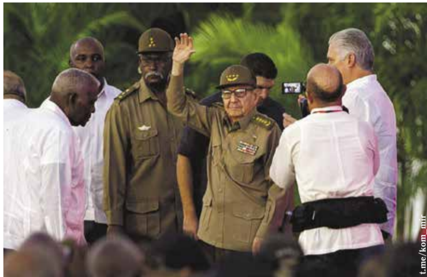
НА ФОТО: УЧАСТНИК СОБЫТИЙ 26 ИЮЛЯ 1953 ГОДА РАУЛЬ КАСТРО РУС НА МИТИНГЕ-КОНЦЕРТЕ В ЧЕСТИ 70-ЛЕТНЕЙ ГОДОВЩИНЫ ШТУРМА КАЗАРМ МОНКАДА

Как оказалось, небольшое революционное ядро быстро объединило вокруг себя широкие слои населения. Правительственные войска,