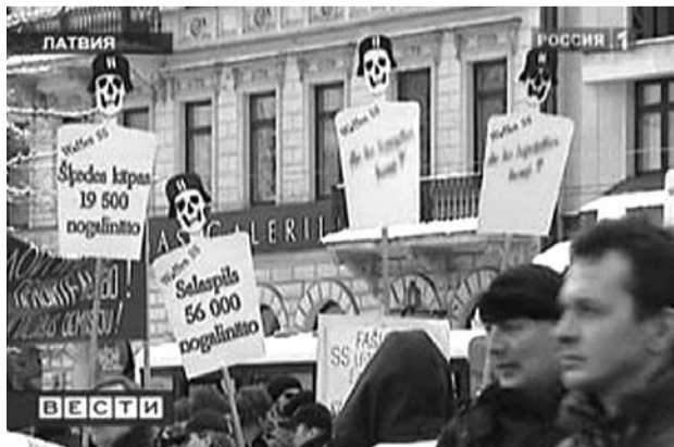
● НА ФОТО: ПРЕДСТАВИТЕЛИ АНТИФАШИСТСКИХ ОРГАНИЗАЦИЙ, ПРОТЕСТОВАВШИХ ПРОТИВ ШЕСТВИЯ, РАСПОЛОЖИЛИСЬ У ЧАСОВ «ЛАЙМА», НЕПОДАЛЕКУ ОТ ПАМЯТНИКА СВОБОДЫ. ОНИ ДЕРЖАЛИ ПЛАКАТЫ С НАДПИСЯМИ «ФАШИСТ, ВСПОМНИ, КОГО УБИВАЛ! ТЫ ЭТИМ ГОРДИШЬСЯ?», «РУМБУЛА — 36 ТЫСЯЧ УБИТЫХ WAFFEN»