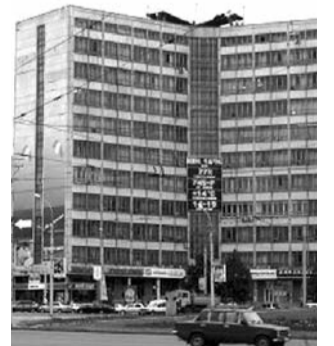
● НА ФОТО: ПРОХОДНАЯ ЗАВОДА

Еще в ноябре 2009 года появились сообщения, что Новосибирский завод полупроводниковых приборов имеет 15-миллионный долг по заработной плате. И с тех пор дела не улучшились, а только наоборот.