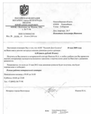
● НА ФОТО: ПИСЬМО «СЧАСТЬЯ»

В июле 2009 года звонит мне сын и говорит: «Мама для тебя хорошая новость, тебе письмо из Волгограда». На этом связь прервалась — была отключена электроэнергия до утра. Это было вечером. Лежала я в постели и все гадала: ну кто может прислать письмо из города, где нет ни родных, ни знакомых. И вдруг мысль: а может, поисковая группа нашла