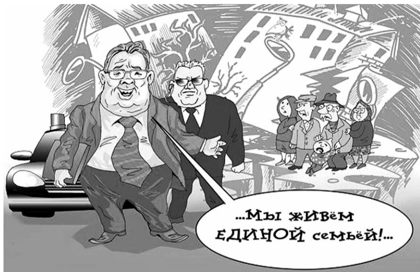
● НА РИС.: У «ТОЛСТОСУМОВ» СВОИ ПРЕДСТАВЛЕНИЯ О МАНДАТЕ ДЕПУТАТА

Есть у нас боевой профсоюз на «Электропечи». Он полностью отвечает своему назначению — защите интересов трудящихся. Руководит этим профсоюзом