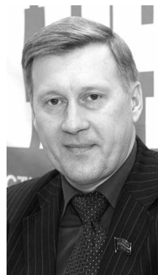
● НА ФОТО: АНАТОЛИЙ ЛОКОТЬ

Новосибирск — самый крупный муниципалитет в Российской Федерации, и поэтому на фоне выборов в субъектах страны итоги голосования в городской Совет Новосибирска имеют большое значение. Борьба за политическое влияние в Новосибирске носит принципиальное значение. Новосибирск — центр федерального округа, и здесь невозможно играть «в поддавки».