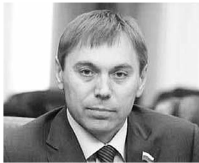
● НА ФОТО: МЭР ИРКУТСКА В. КОНДРАШОВ

чили почти 25%, в Свердловской области — почти 22%, в Калужской области — 21,15%, в Рязанской области — 19%, в Хабаровском крае — почти 19%, в Воронежской области — 18,6%.