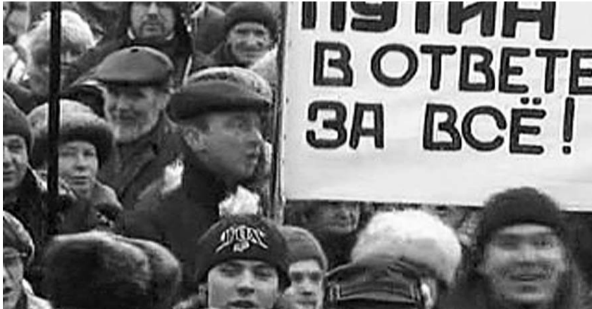
● НА ФОТО: КОАЛИЦИЯ ПРИНЯЛА РЕШЕНИЕ НЕ ПРОВОДИТЬ 20 МАРТА МИТИНГ ПРОТЕСТА

В городе активно распространяются листовки следующего содержания. «Дом Советов 20 марта, 13:00. Граждане идут на ярмарку потому, что митинг запретили! А ты?». Аналогичными призывами «сходить в этот день и час на ярмарку за картошкой и морковкой, а также поддержать местного производителя» заполнено интернет-пространство Калининграда. Пользователи не скрывают своих намерений «устроить власти протестный и молчаливый флэш-моб, который по массовости должен превзойти все предыдущие митинги».