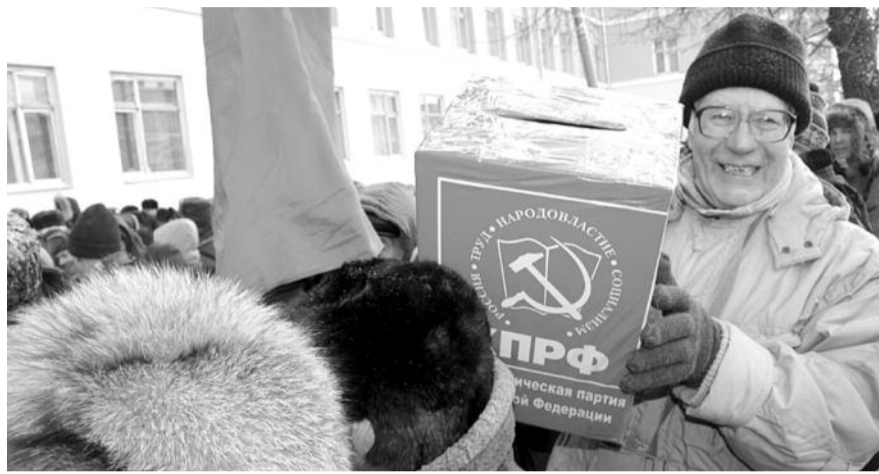
● НА ФОТО: НА ПИКЕТЕ БЫЛО РАЗВЕРНУТО ГОЛОСОВАНИЕ ПО НАРОДНОМУ РЕФЕРЕНДУМУ

Тут же на пикете представителями КПРФ было развернуто голосование по Народному референдуму, пенсионеры охотно заполняли бюллетени, особую поддержку вызвал вопрос №9, посвященный льготным поездкам.