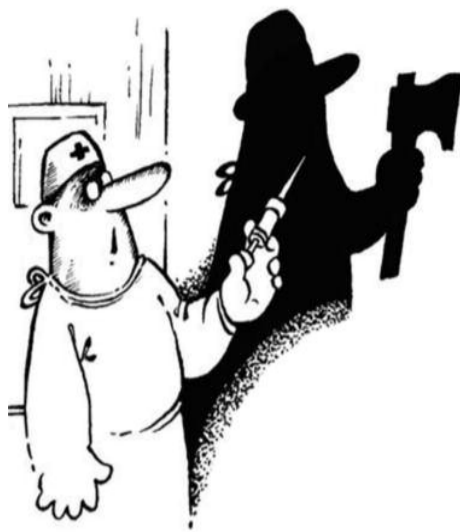
● НА РИС.: И ТЕБЯ ВЫЛЕЧИМ...

таможенного контроля. В ходе оперативно-розыскных мероприятий было задокументировано около 50 фактов незаконной выдачи заключений на различные товары на сумму свыше 12 млн. долларов! В мае 2010 г. в отношении Своровского было возбуждено новое уголовное дело, уже по подозрению в получении взятки. Материалы уголовных дел были готовы к