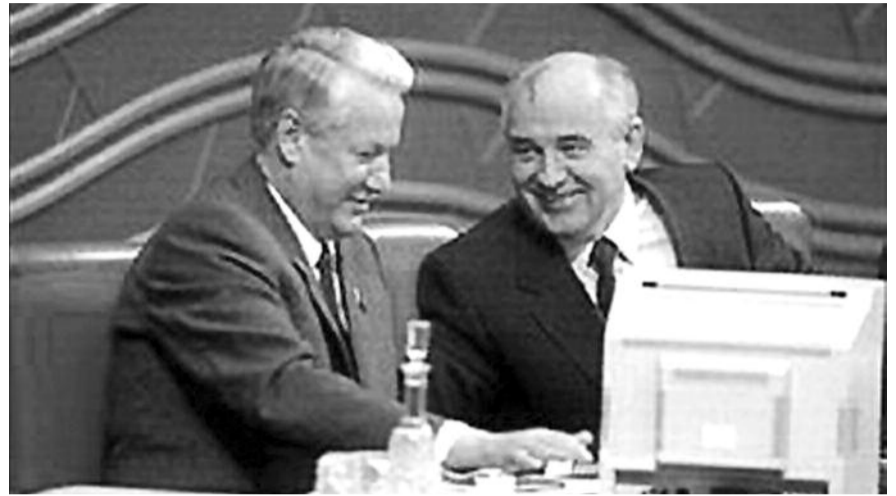
● НА ФОТО: В 2011 ГОДУ ЗАМЕТНЫ ДВЕ ТЕМНЫЕ ДАТЫ ИЗ БИОГРАФИЙ ГОРБАЧЕВА И ЕЛЬЦИНА

войн и кончая разворовыванием общенародной собственности, коррупции, привели к деиндустриализации страны, обнищанию и вымиранию населения и прочим бедам! Потрясающим было выступление МЕДВЕДЕВА у беломраморного истукана, заявившего о создании нового государства (не было такого согласия народов России), которое, надо подразумевать,