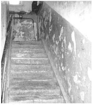
● НА ФОТО: ХОТЬ ЛЕСТНИЦУ ВПЕРВЫЕ ЗА 3 МЕСЯЦА ПОДМЕЛИ

Работники ЖЭУ пытаются навести порядок в доме №48 по улице Сибиряков-Гвардейцев, однако остаются при своем мнении относительно вины жильцов.