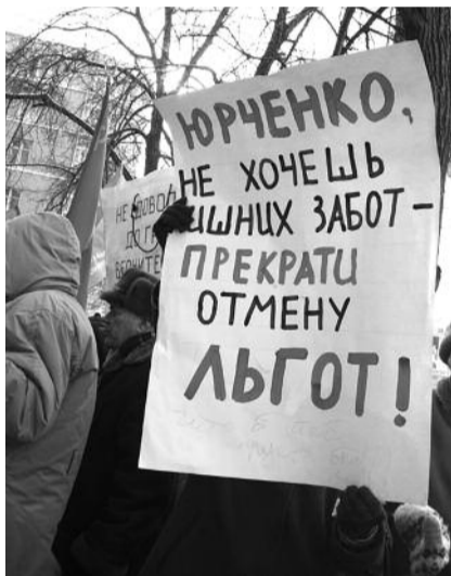
● НА ФОТО: ГЛАС НАРОДА

Пенсионеры требовали от руководства области спуститься и ответить на их вопросы, но никто до общения с ними так и не снизошел.