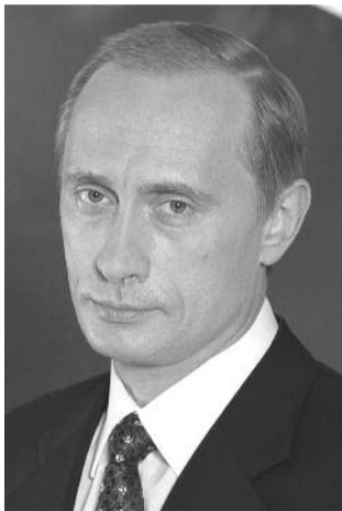
● НА ФОТО: ОБВИНЯЕМЫЙ

8 По решению В. ПУТИНА была 22 марта 2001 года затоплена орбитальная станция «Мир». Решение о свороте орбитального центра с орбиты принято Путиным по настоянию президента США. На строительство и эксплуатацию станции было истрачено 4,3 миллиарда долларов.