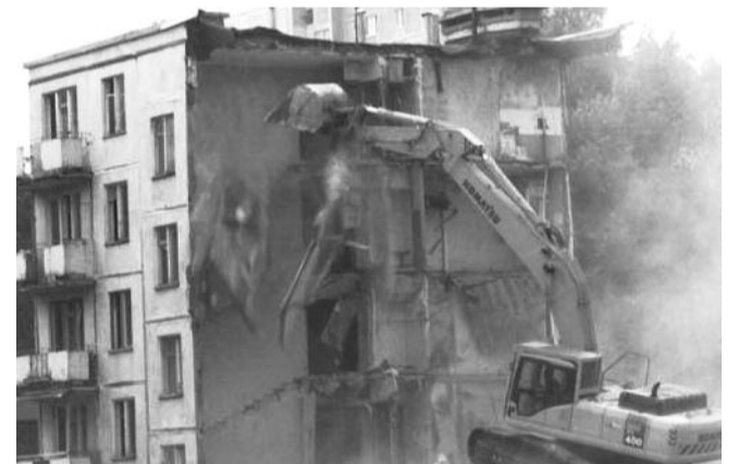
● НА ФОТО: ВЕТХИЕ ДОМА МАЛО КОГО ИНТЕРЕСУЮТ, А ВОТ ЗЕМЛЯ...