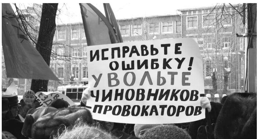
● НА ФОТО: НАРОД ТРЕБУЕТ! (НА ПИКЕТЕ У ОБЛАДМИНИСТРАЦИИ 21 ФЕВРАЛЯ)