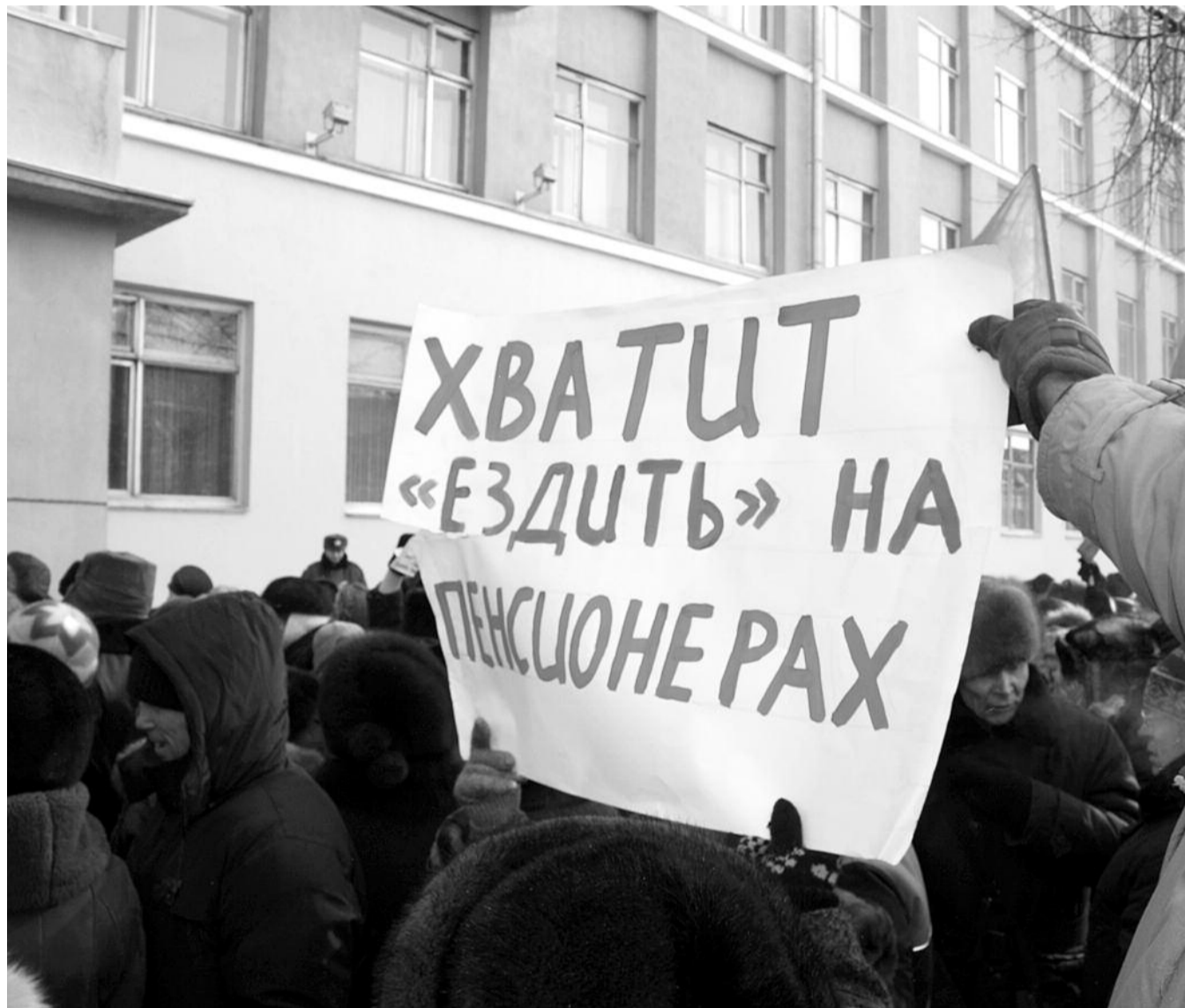
● НА ФОТО: НАРОД ПРОТЕСТУЕТ — ЧИНОВНИКИ НЕ ОТСТУПАЮТ