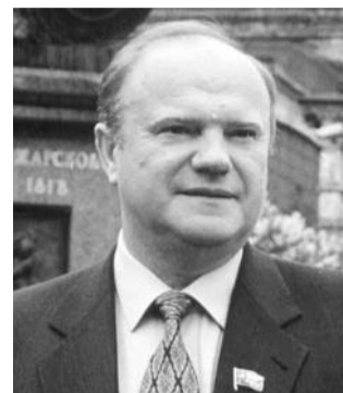
● НА ФОТО: ЛИДЕР КПРФ

Уважаемые товарищи! Дорогие друзья! Поздравляю вас со славным Днем защитников Отечества, Днем Советской Армии и Военно-Морского флота!