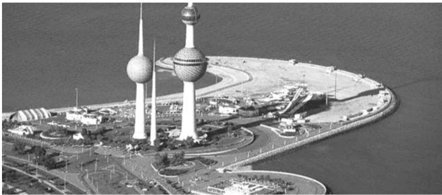
● НА ФОТО: ЭМИР ПРЕВРАЩАЕТ КУВЕЙТ В РАЙ НА ЗЕМЛЕ

Одновременно с народными гуляниями на кувейтцев обрушился вал повышений зарплат, пенсий и прочих социальных пособий.