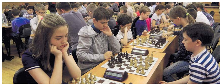
НА ФОТО: ТУРНИР — СТУПЕНЬКА К ШАХМАТНОМУ ОЛИМПУ