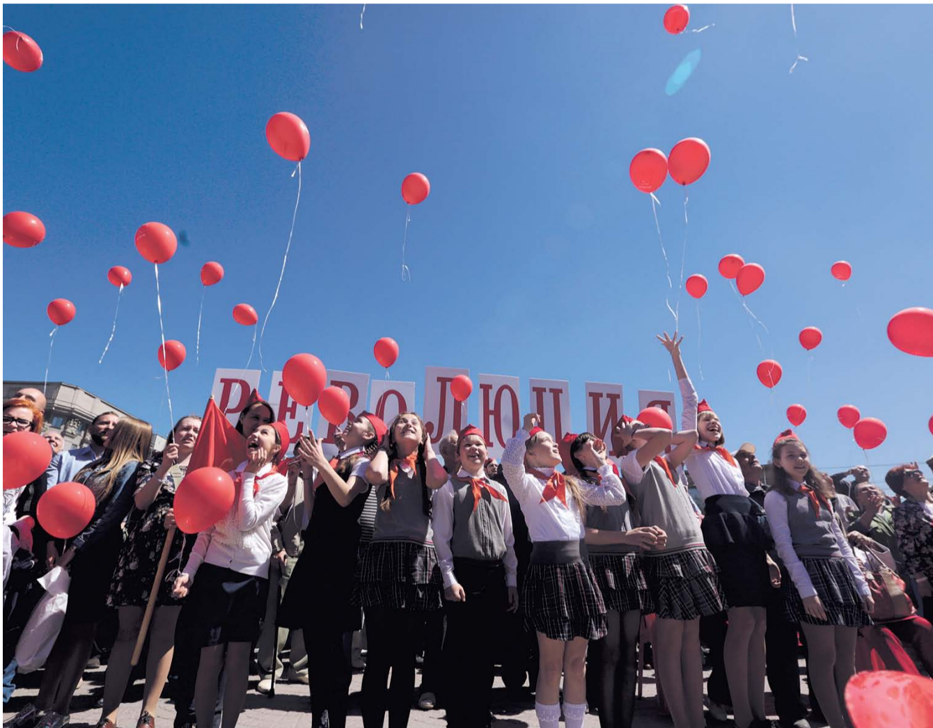
НА ФОТО: ФЛЕШ-МОБ «РЕВОЛЮЦИЯ» ОТКРЫЛ ЮБИЛЕЙНЫЙ «ДЕНЬ ПРАВДЫ»