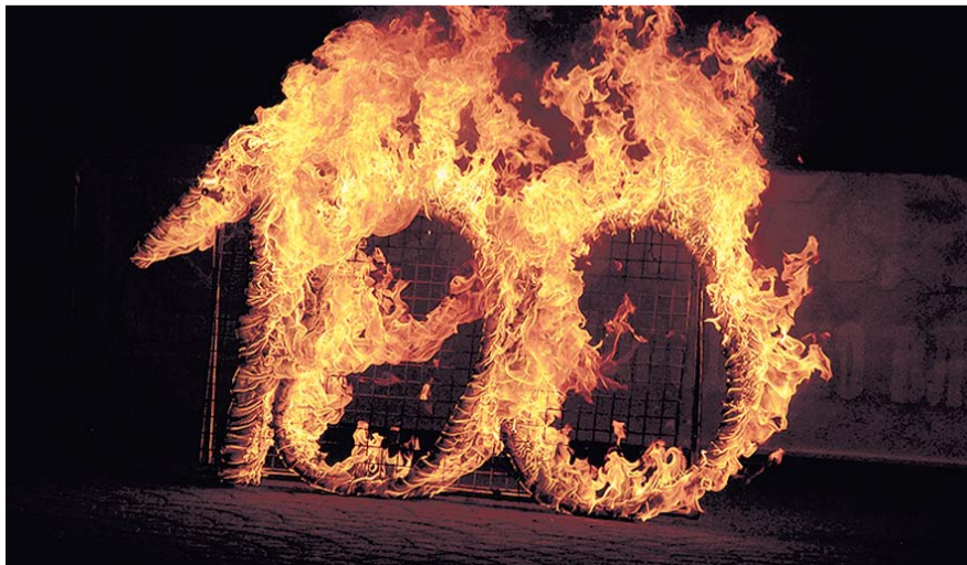
НА ФОТО: ТАК ЗАКОНЧИЛСЯ ЮБИЛЕЙНЫЙ «ДЕНЬ ПРАВДЫ»

Первое, что можно было заметить на площадке «Реввоенсовет» от Заельцовского райкома КПРФ, — это большой куб, рассказывающий о том, что это такое вообще — Реввоенсовет, какие были первые декреты Советской власти. Давними друзьями партийной организации являются военные реконструкторы, сформировавшие самую зрелищную составляющую площадки — ретро-технику. Броневики и автомобили военных лет, «Волга» советского времени — создавались небольшие очереди желающих сфотографироваться на фоне механических свидетельств истории.