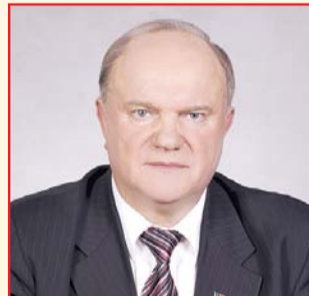
НА ФОТО: ГЕННАДИЙ ЗЮГАНОВ

«На Санкт-Петербургском форуме заявляли о том, что растет экономика, — отметил лидер коммунистов. — Я внимательно исследовал, как она растет. Экономика растет только за счет роста цены на нефть. Вся обрабатывающая промышленность продолжает и дальше проседать. Это происходит на фоне того, что почти 50% достиг износ оборудования. И он тоже нарастает».