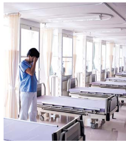
НА ФОТО: ИТОГИ РЕФОРМ: ЛЕЧИТЬСЯ ДОРОГО, ДОВОЛЬНЫХ НЕТ

Второе место. Нарушения в области выбора медицинской организации для наблюдения или лечения: пациенты рассказывали о частых необоснованных отказах в направлении из поликлиники по месту прикрепления в федеральные лечебные учреждения. Жаловались на то, что им отказывали в прикреплении к медицинской организации в связи с отсутствием документа, подтверждающего смену места жи-