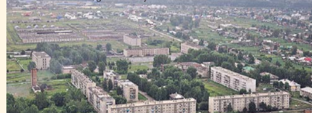
НА ФОТО: В КОЧЕНЕВО ЖДУТ ЧИСТУЮ ВОДУ