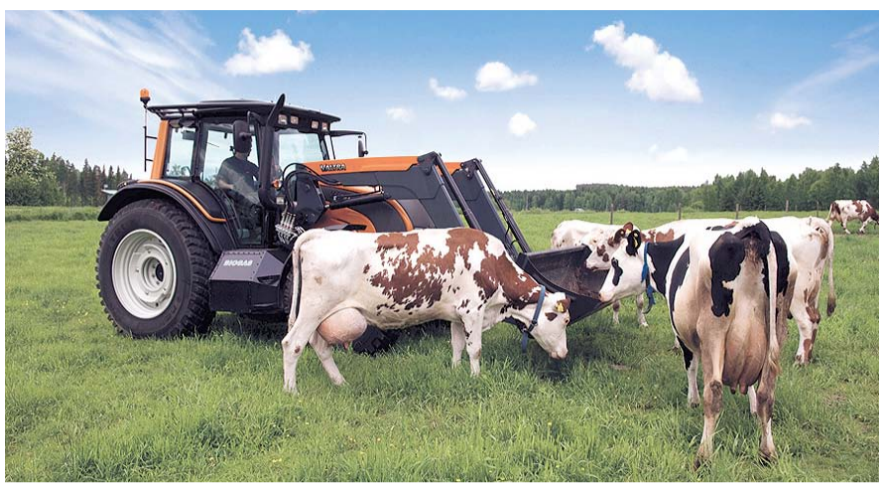
НА ФОТО: ПРОГРАММА ВЫГЛЯДИТ ХОРОШО, НО КОКАЯ БУДЕТ РЕАЛИЗАЦИЯ НА ПРАКТИКЕ?

Фермер приводит свои подсчеты, на сколько новичкам может хватить обещанных средств.