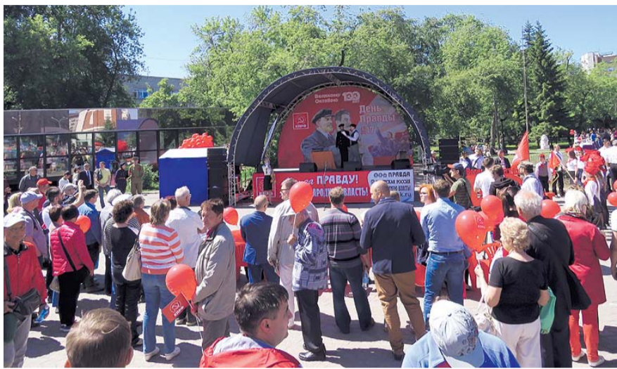
НА ФОТО: У ГЛАВНОЙ СЦЕНЫ ВЕСЬ ДЕНЬ МНОГОЛЮДНО

Площадка, организованная коммунистами Кировского района, была посвящена подвигам советских чекистов, их роли в отечественной истории, а также памяти об их боевых подвигах. В палатке проходил мастер-класс по сборке автоматов для будущих призывников.