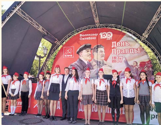
НА ФОТО: МЭР ПОЗНАКОМИЛСЯ С НОВОСИБИРСКИМИ ПИОНЕРАМИ

Мы, пионеры, рады, что нам доверили организовать на «Дне Правды» свою собственную пионерскую площадку, позволили нам провести свой собственный видеорепортаж с фестиваля, и приятно, что на этом празднике нашему пионерскому отряду уделено особое внимание!