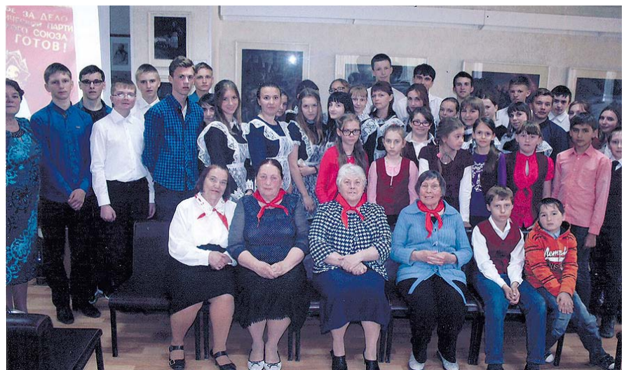
НА ФОТО: УЧАСТНИКИ ВСТРЕЧИ В КРАСНОЗЕРСКОМ МУЗЕЕ