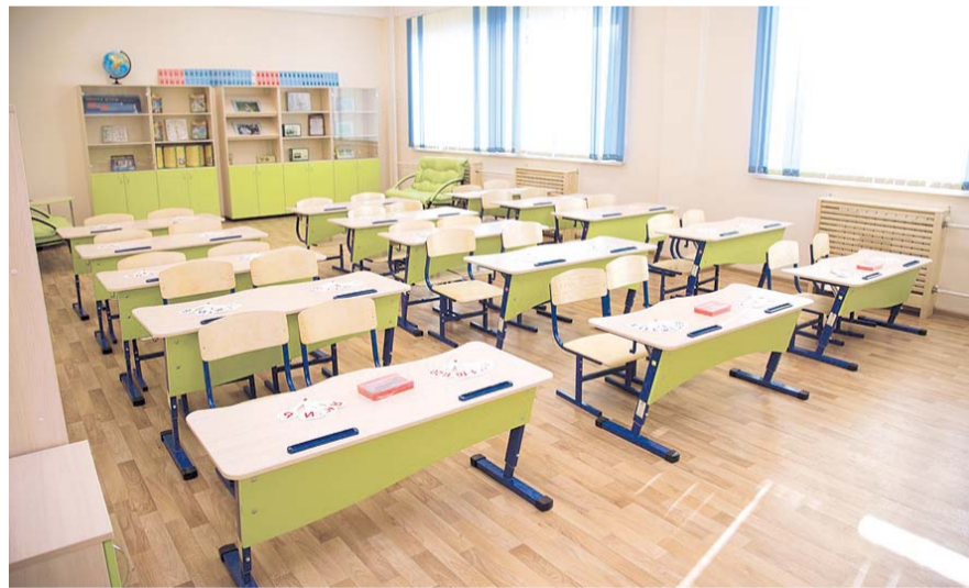
НА ФОТО: РЕБЯТИШКИ БУДУТ УЧИТЬСЯ В НОВЫХ ШКОЛАХ

Кроме того, в заделе находится строительная школа на «Чистой Слободе» в Ленинском районе, работы ведутся за счет застройщика. А также по программе «Жилище» ведется строитель-