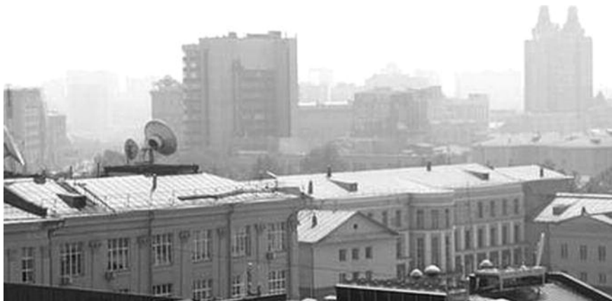
● НА ФОТО: ГОРОД НОВОСИБИРСК И ОБЛАСТЬ ОКУТАЛ СМОГ ОТ ЛЕСНЫХ ПОЖАРОВ

Красноярский край тоже снял с себя чрезвычайную ситуацию, которая была объявлена. Там тоже положение улучшилось. Поэтому тех дымов, какие были, мы не ожидаем. Хотя в дальнейшем предвидится повышение температуры, и возможны какие-то локальные пожары, в том числе в Новосибирской области. Но лесная служба стоит на страже. Сто два маршрута, которые у нас намечены, будут патрулироваться машинами. Кроме того, мы отслеживаем ситуацию из космоса. Осуществляется четкое взаимодействие между регионами. И если что-то случается, мы выезжаем, как это было на границе с Алтайским Краем, когда в начале июня совместными действиями мы предотвратили повторение ситуации 2006 года. Фронт огня был ликвидирован на тер-