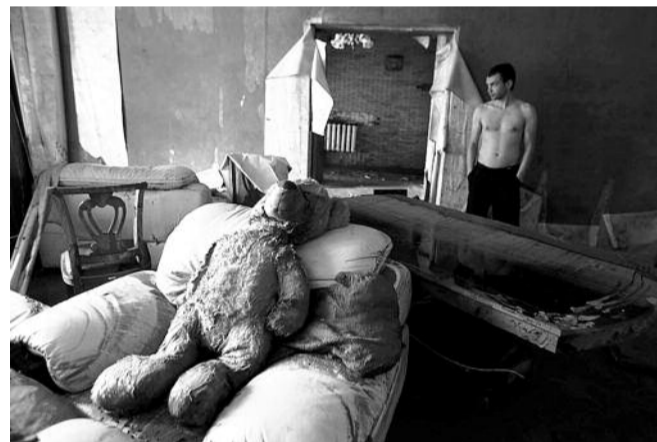
● НА ФОТО: НА КУБАНИ ОТ СТИХИИ ПОСТРАДАЛО 22 000 ЧЕЛОВЕК