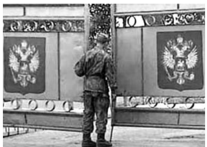
● НА ФОТО: РОССИЙСКИЕ БАЗЫ В КИРГИЗИИ — ОСТОРОЖНО, ПЛАТА ПОДНИМАЕТСЯ

Нынешнюю же стоимость аренды остальных трех баз — базы подводных испыта-