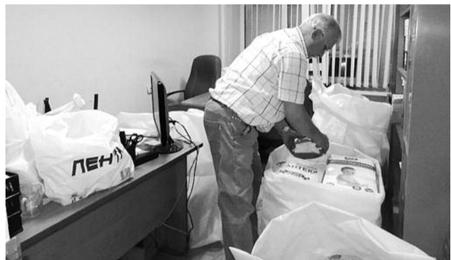
● НА ФОТО: КОММУНИСТЫ СОБРАЛИ УЖЕ БОЛЕЕ 5 КУБОМЕТРОВ ВЕЩЕЙ

Некоторые предприниматели машинами доставляли свою продукцию. Так, например, в помещение Железнодорожного райкома КПРФ уже прибыла машина с одеждой со швейной фабрики.