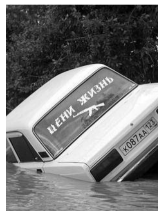
● НА ФОТО: 7 ИЮЛЯ НА КУБАНЬ ОБРУШИЛОСЬ НАВОДНЕНИЕ

Новосибирские коммунисты объявили сбор помощи для пострадавших от наводнения в Краснодарском крае. Члены и сторонники КПРФ, а также все неравнодушные люди могут принести вещи и финансовую помощь в любое районное отделение КПРФ, откуда они попадут в обком, где будет сформирован контейнер для отправки в Краснодарский край.