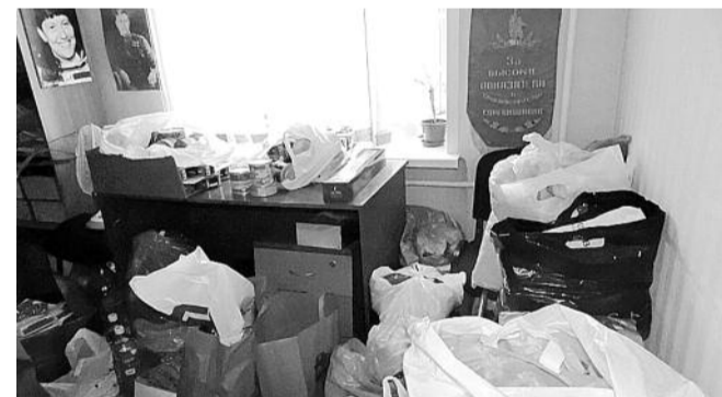
● НА ФОТО: В ПОМЕЩЕНИИ ЖЕЛЕЗНОДОРОЖНОГО РАЙКОМА КПРФ УЖЕ ПРАКТИЧЕСКИ НЕТ СВОБОДНОГО МЕСТА ОТ СОБРАННЫХ ВЕЩЕЙ

6 В первом полугодии 2012 года в Новосибирске произошло 614 ДТП, при этом в них погибло 58 человек, еще 701 человек был травмирован. Самым аварийным в городе оказался Ленинский район — в нем произошло 105 ДТП.