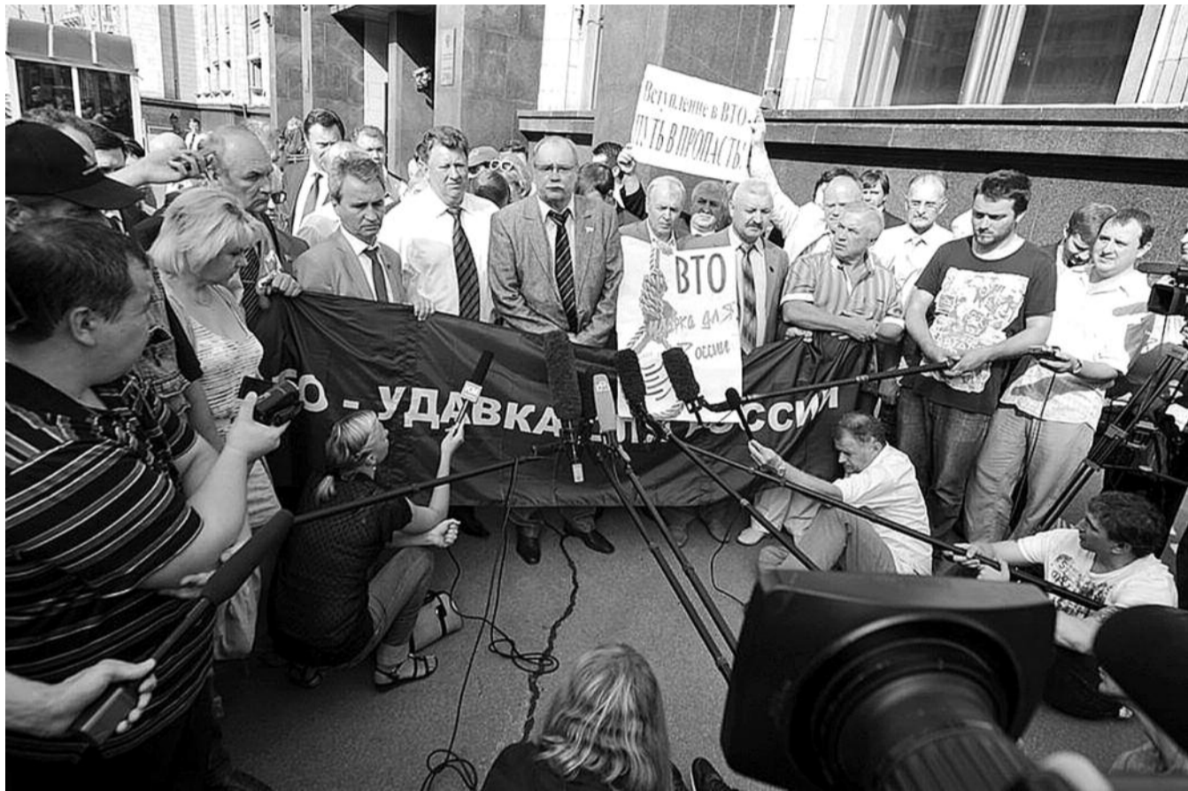
● НА ФОТО: «ВСТУПЛЕНИЕ В ВТО — ПУТЬ В ПРОПАСТЬ» ПЕРЕД НАЧАЛОМ ЗАСЕДАНИЯ ГД ДЕПУТАТЫ-КОММУНИСТЫ ПРОВЕЛИ ВСТРЕЧУ С ИЗБИРАТЕЛЯМИ