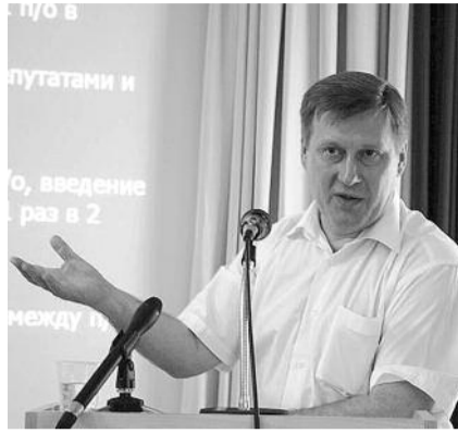
● НА ФОТО: АНАТОЛИЙ ЛОКОТЬ НА ПЛЕНУМЕ

Поводов для протестных настроений достаточно: рост тарифов ЖКХ и цен на бензин, приватизация, размещение в Ульяновске базы НАТО, вступление России в ВТО. Анатолий Локоть отметил, что партии необходимо «активно работать в любом массовом движении, направляя его на защиту коренных интересов народа».