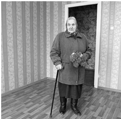
● НА ФОТО: ЧИНОВНИКИ РЕШИЛИ ОФОРМЛЯТЬ КВАРТИРЫ ВЕТЕРАНОВ В СОЦНАЙМ

В Маслянинском районе было зафиксировано 20 случаев передачи жилья в соцнайм, а не в собственность. И только когда ветераны начали писать жалобы в областную администрацию, обращения депута-