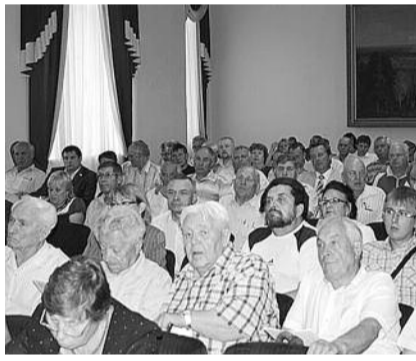
● НА ФОТО: ВО ВРЕМЯ ДОКЛАДА

— Весь этот период, начиная с декабря, волна протеста не стихает. Периодически проходящие акции протеста говорят о том, что напряжение отнюдь не спало, как это пытаются представить руководители области и страны. Характерная особенность протестных действий в Новосибирской области — отделение КПРФ всегда было в гуще этих событий. Мы всегда участвовали во всех протестных мероприятиях.