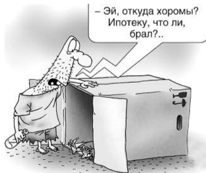
● НА РИС.: СОЦИАЛЬНОЕ ЖИЛЬЕ ПО-РУССКИ

Теперь же 300 тысяч рублей будет предоставляться, только если оба супруга на момент приобретения жилья не достигли 35 лет. Дом должен быть сдан в течение