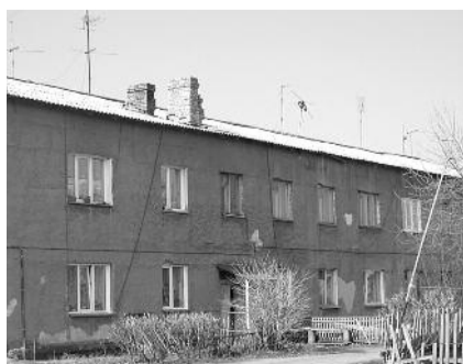
● НА ФОТО: ВО СКОЛЬКО ОБОЙДЕТСЯ УСТАНОВКА СЧЕТЧИКОВ В МАЛОЭТАЖНЫХ ДОМАХ?

Прием пройдет по адресу: ул. Гурьевская, 38, офис 305. Телефон: 8-913-008-78-91.