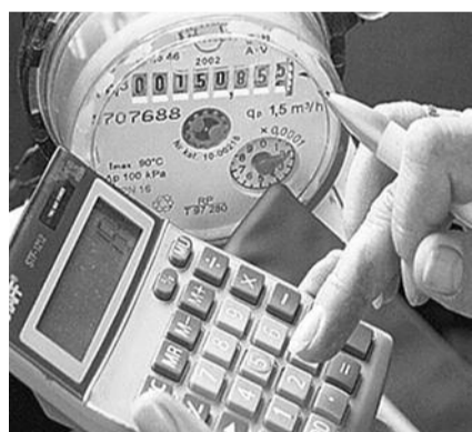
● НА ФОТО: НАС СТАВЯТ НА СЧЕТЧИК

С 1 июля в домах новосибирцев начались массовые установки общедомовых приборов учета. До этого времени жильцы могли установить их добровольно, теперь же приборы учета будут монтировать без согласия жильцов дома, не обговаривая с ними даже цену.