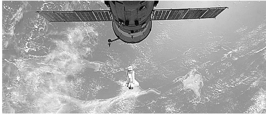
НА ФОТО: РАКЕТНО-КОСМИЧЕСКАЯ ОТРАСЛЬ ИСПЫТЫВАЕТ МНОЖЕСТВО ПРОБЛЕМ