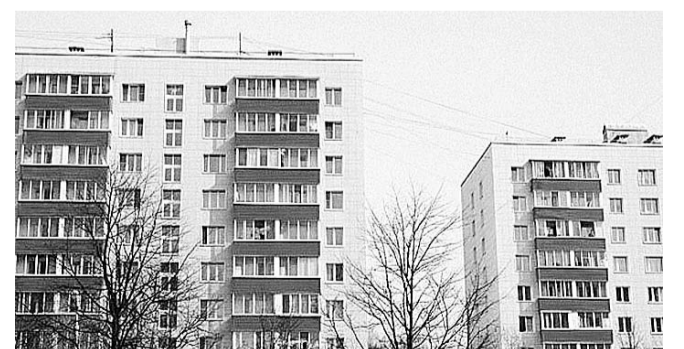
НА ФОТО: СОБСТВЕННИКАМ НУЖНО ПРИНЯТЬ ВДУМЧИВОЕ РЕШЕНИЕ

Государственная дума продлила срок, в течение которого жители должны определиться со способом хранения средств на капитальный ремонт — на индивидуальном счете дома или же в региональном фонде капремонта. С соответствующей инициативой выступил член фракции КПРФ Александр АБАЛАКОВ . Законопроект был принят сразу в двух чтениях.