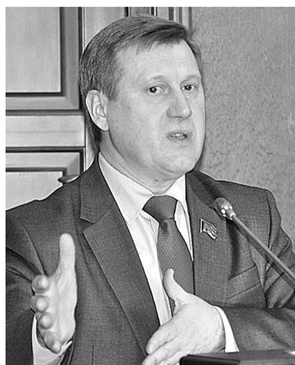
НА ФОТО: АНАТОЛИЙ ЛОКОТЬ НА СЪЕЗДЕ