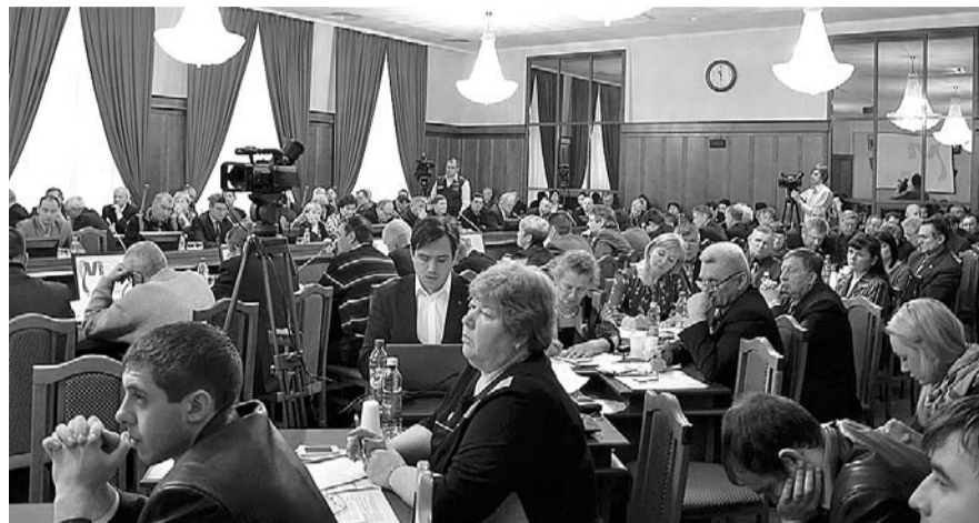
НА ФОТО: ОСНОВНЫМИ ВОПРОСАМИ ПОВЕСТКИ СЪЕЗДА СТАЛИ ПРОБЛЕМЫ ЖКХ

Во-первых, многие граждане заблуждаются по поводу того, что новые нормы законодательства вводятся только с 1 января, хотя за капремонт граждане платили всегда, что подтверждается старыми нормативно-правовыми актами в этой сфере. Во многих домах решения о необходимости капремонтов были приняты общим собранием собственников жилья. Проблемы, по словам депутата, возникли, когда заработал ФЗ №185.