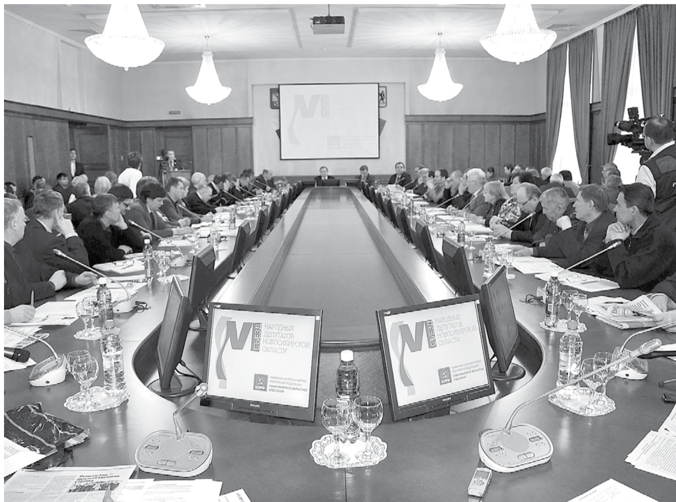
НА ФОТО: В РАБОТЕ VI СЪЕЗДА НАРОДНЫХ ДЕПУТАТОВ ПРИНЯЛО УЧАСТИЕ 120 ДЕЛЕГАТОВ