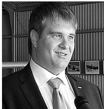
НА ФОТО: ПЛЕМЯННИК ПРЕЗИДЕНТА

Экспансия московских «варягов» превратила Новосибирскую область в полигон для сомнительных проектов.