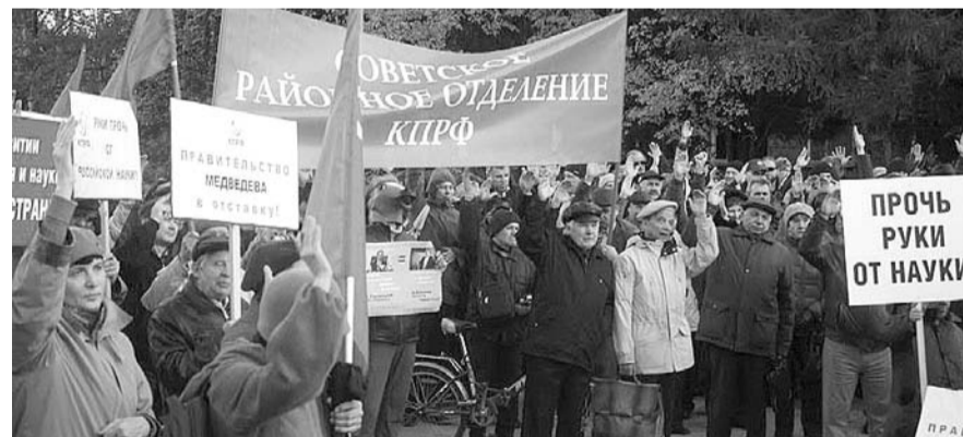
НА ФОТО: УЧАСТНИКИ МИТИНГА В АКАДЕМГОРОДКЕ ПРИНЯЛИ РЕЗОЛЮЦИЮ ЕДИНОГЛАСНО

ученых и заслуженных ветеранов науки. Но этого не произошло. И теперь такая же ставка будет делаться на раскол коллективов институтов. Этого нельзя допустить. Нужно проявить сплоченность, выдержку и найти новые методы работы, которые бы только усиливали наши коллективы. Вторая задача — защитить наш имущественный комплекс. Мы не только сохранили то, что было здесь организовано «отцами»-основателями, но это все получило блестящее развитие. Надо давать жестко по рукам охотникам за нашей собственностью, данной нам, чтобы заниматься наукой в хороших условиях, соответствующих мировым.