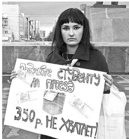
НА ФОТО: ПРОТИВ ПОВЫШЕНИЯ СТОИМОСТИ СТУДЕНЧЕСКОГО ПРОЕЗДНОГО!

— Мы сомневаемся, что за столь короткое время, за которое было принято решение вначале об отмене безлимитного проезда, затем о его возвращении и подорожании, можно было тщательно с экономической точки зрения провести необходимые подсчеты — сколько в городе иногородних студентов, какое количество поездок они совершают и так далее. С какого «потолка» взялась цифра в 850 рублей, для нас по-прежнему остается загадкой, — об этом говорили выступающие участники митинга.