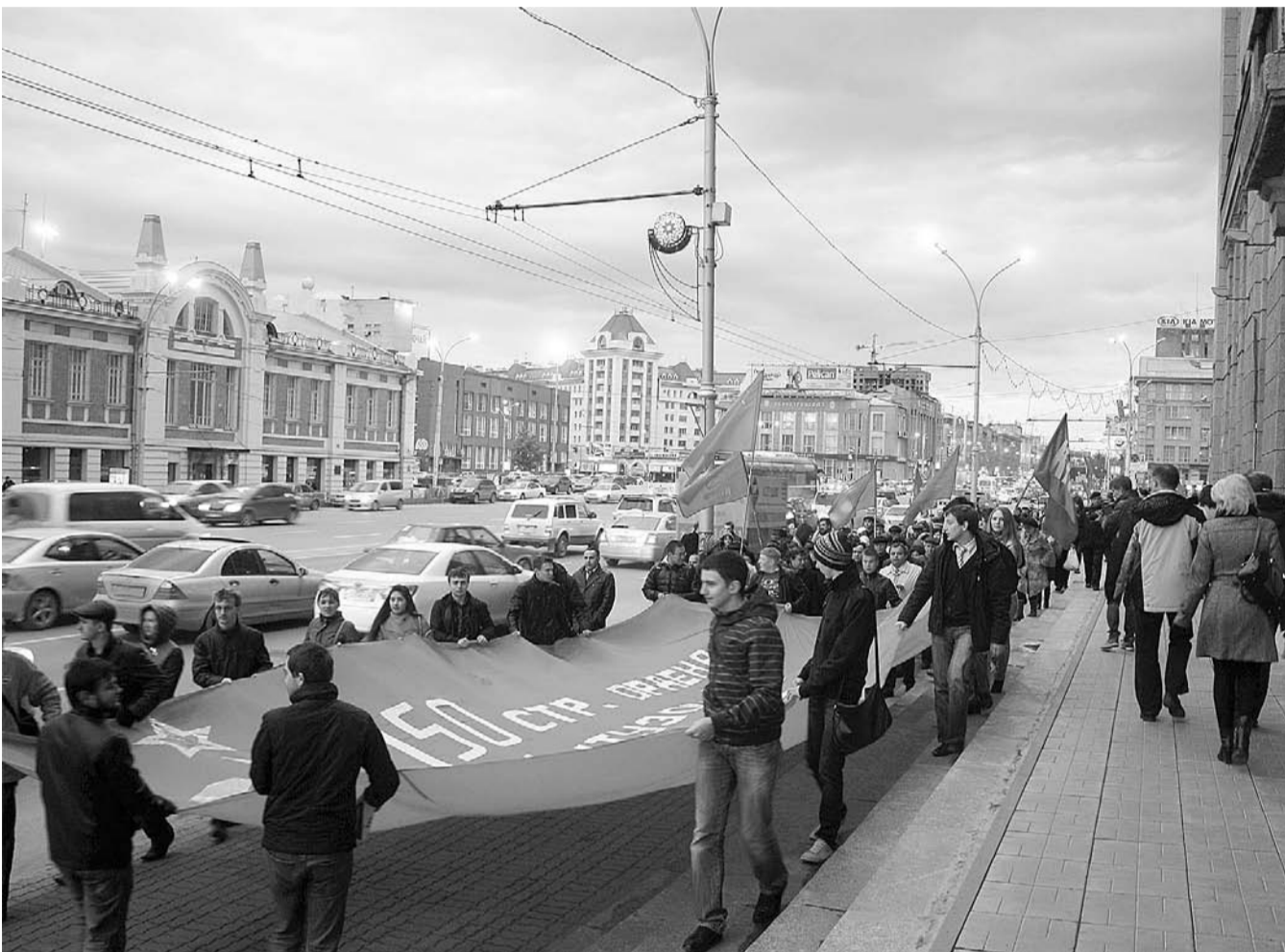
НА ФОТО: В ПАМЯТЬ О ЗАЩИТНИКАХ СОВЕТСКОЙ ВЛАСТИ МОЛОДЫЕ КОММУНИСТЫ ПРОНЕСЛИ ЗНАМЯ ПОБЕДЫ ПО ЦЕНТРУ НОВОСИБИРСКА