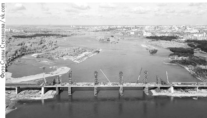
НА ФОТО: ТРЕТИЙ МОСТ — КОМСОМОЛЬСКИЙ!