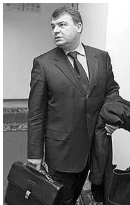
НА ФОТО: НЕПОДСУДНЫЙ СЕРДЮКОВ