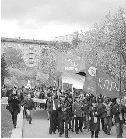
НА ФОТО: КОЛОННА ПРОШЛА ОТ ПЛОЩАДИ ЛЕНИНА ДО СКВЕРА ГЕРОЕВ РЕВОЛЮЦИИ

По словам зампреда бюджетного комитета, члена фракции КПРФ