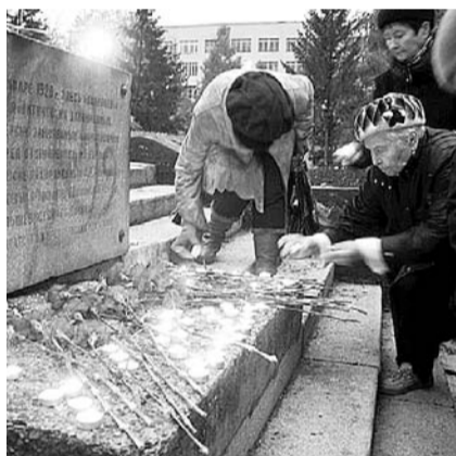
НА ФОТО: СВЕЧИ В ПАМЯТЬ О ЗАЩИТНИКАХ СОВЕТСКОЙ ВЛАСТИ