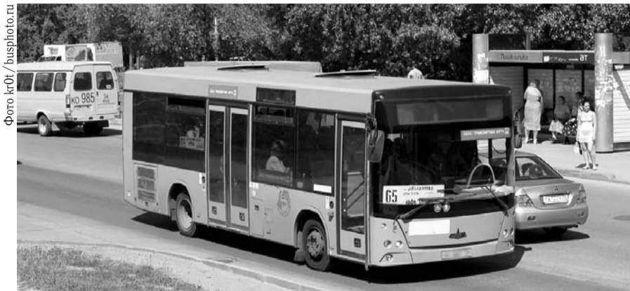
НА ФОТО: АВТОБУС №65 ПРИХОДИТСЯ ЖДАТЬ НА ОСТАНОВКЕ ОКОЛО ОДНОГО ЧАСА

Надо было хоть немного разобраться с проблемой. Например, маршрут №65 — одна единица ПС означает, что человек должен ожидать данный автобус один час. А если это человек пожилого возраста с социальным проездным билетом, для него проблем нет? А то, что из микрорайонов Нижней зоны, Нижней Ельцовки, п. Плановый (40% жителей района) нет прямого автобусного сообщения с городом, — это нормальное транспортное сообщение? Или, мо-