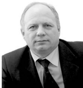
НА ФОТО: ДЕПУТАТ СЕРГЕЙ КАНУННИКОВ

В среду в Законодательном собрании состоялись общественные слушания по проекту бюджета Новосибирской области. Депутаты и главы муниципальных образований критически отнеслись к предложенному областным правительством проекту бюджета.