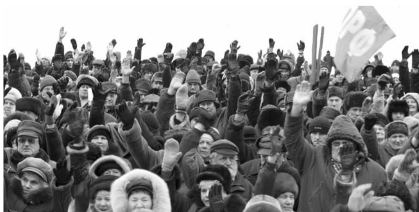
● НА ФОТО: ВОЛНА ПРОТЕСТА ДОКАТИЛАСЬ ДО АКАДЕМИИ НАУК

Российские академики с волнением ждут начала октября: через месяц в стране начнутся масштабные акции профсоюзов РАН, требующих предоставить ученым «условия для работы в интересах страны».