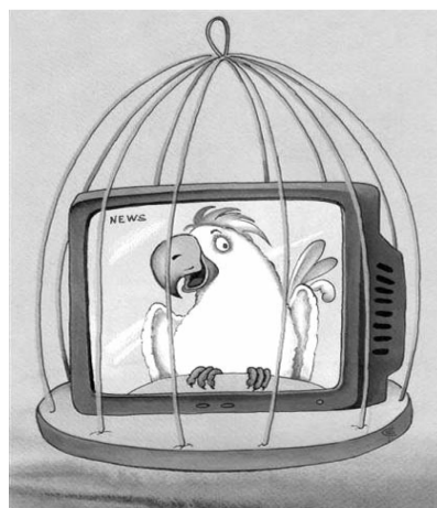
● НА РИС.: ГРУЗИНСКИЕ СМИ ПОД «КОЛПАКОМ»