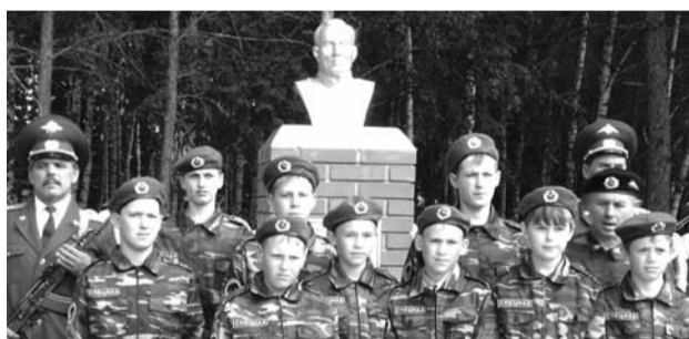
● НА ФОТО: КОЛЫВАНСКАЯ МОЛОДЕЖЬ ЧТИТ СВОИХ ГЕРОЕВ

Среди жителей р.п. Колывань есть их земляки — Герои Советского Союза. Это А.Н. КУЗНЕЦОВ, Д.Н. ПИЧУГИН, М.В. СОЛОВЬЕВ, Н.Е. СЕРГИЕНКО . В их честь установлены памятные пилоны, их именами названы улицы поселка.