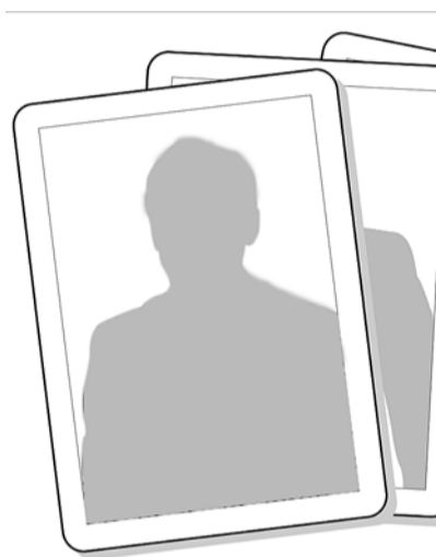
● НА РИС.: У КОГО ТУЗ В РУКАВЕ?

В ближайшее время в нашу область предполагается приезд наших товарищей по партии — заместителя Председателя ЦК КПРФ Ивана Ивановича МЕЛЬНИКОВА и лауреата Нобелевской премии, депутата фракции КПРФ в Госдуме академика Жореса