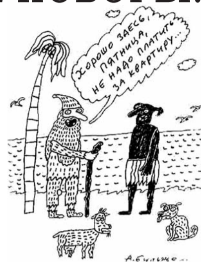
● НА РИС.: ОНИ НЕ ЗНАЛИ ПРО РЕФОРМУ ЖК

При этом налог будет рассчитываться с суммарной стоимости имущества. То есть, если вы владеете долей объекта недвижимости, процент налога будет рассчитываться не с доли, а со всего объекта. Кроме имущественного налога, согласно новому Жилищному кодексу, собственники квартир (домов и т. д.) обязаны теперь платить налог на землю, на которой стоит дом. Владельцы квартир еще не так сильно прочувствуют усиление налогового гнета, поскольку стоимость земли под домом будет разделена