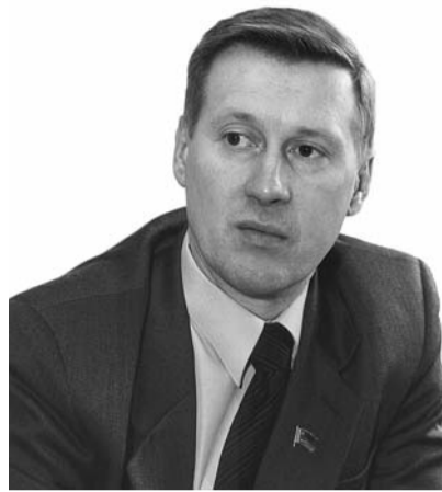
● НА ФОТО: АНАТОЛИЙ ЛОКОТЬ

Мы попросили первого секретаря Новосибирского обкома КПРФ, депутата Госдумы Анатолия ЛОКОТЬ прокомментировать последние изменения во властных кабинетах региона и федерального округа. Напомним, что в минувший четверг стало известно о назначении Виктора ТОЛОКОНСКОГО полномочным представителем Президента в Сибирском федеральном округе. В ближайшее время должен решиться вопрос о назначении губернатора Новосибирской области.