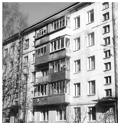
● НА ФОТО: КАКОЙ НАЛОГ НАСЧИТАЮТ?

Налог на недвижимость должен заменить два существующих — на землю и на имущество. Законопроект «О налоге на недвижимость» предполагает взимание налога с физических лиц за владение зданиями, сооружениями (как жилыми, так и нежилыми) и земельными участками. При этом рассчитывать его будут по рыночной стоимости недвижимости, а не