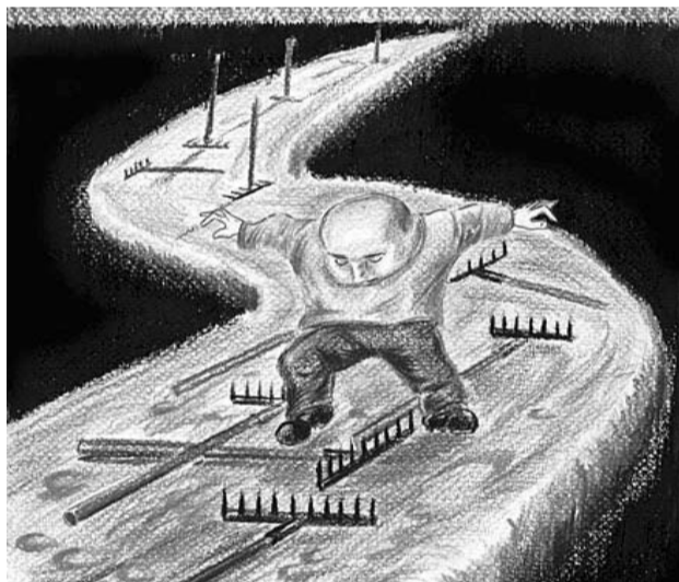
● НА РИС.: ХВАТИТ НАСТУПАТЬ НА ГРАБЛИ

ОТ РЕДАКЦИИ: Первый шаг в век России, очевидно, — это кризис и упадок экономики страны. А также снижение доходов населения, понижение уровня заработной платы. «Через 15 лет, к 2017 году Россия будет ведущей мировой державой. Мы займем достойное России место в мировой эконо-