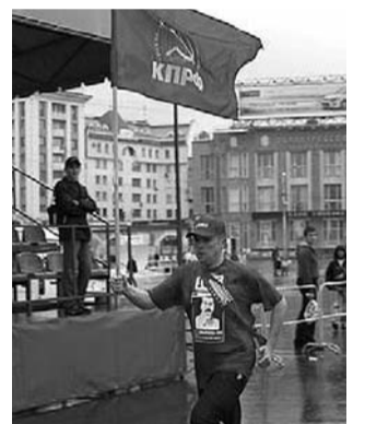
● НА ФОТО: ЯРКИЙ ФИНИШ

В Новосибирске состоялась 10-й Сибирский фестиваль бега. Несмотря на дождливую погоду, было зарегистрировано 5 657 участников соревнований. Традиционным стало участие в соревнованиях команды КПРФ. С этих соревнований коммунисты вернулись с медалью.