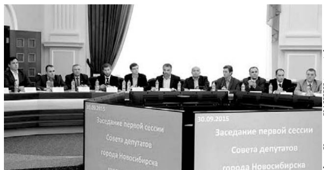
НА ФОТО: ФРАКЦИЯ КПРФ В ГОРСОВЕТЕ