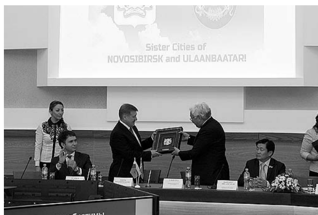
НА ФОТО: ПОДПИСАНО СОГЛАШЕНИЕ О ПОБРАТИМСТВЕ