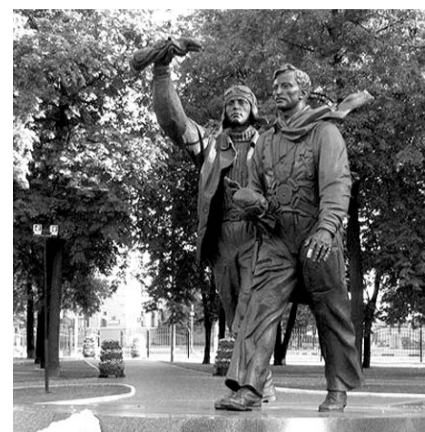
НА ФОТО: ПАМЯТНИК В ЛЕФОРТОВО

Судьба не баловала французских летчиков. Из первой группы — 15 человек — в живых осталось только трое: Марсель АЛЬБЕР , Роллан де ля ПУАП и Жозеф РИССО . Всего же, за время боевых действий, полк потерял 42 пилота: 35 в воздушных боях, 7 — при исполнении служебных обязанностей. Имена всех погибших золотом выбиты на мемориальной доске, установленной на доме №29 по Кропоткинской набережной в Москве, где когда-то находилась французская военная миссия.