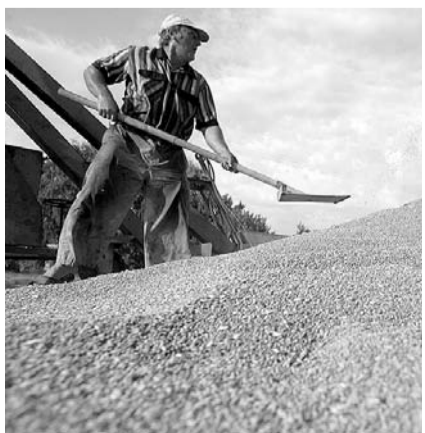
НА ФОТО: УРОЖАЙ СОБРАН

ли, 11 числа буквально всем отрядом туда съездили. В этом году показатели нормальные. Урожайность получилась 6,1 центнера. Если сравнить с прошлогодним урожаем, то мы превысили показатели. Очень важно, что мы успели закончить уборку до начала дождей. Сейчас комбайны стоят дома. По реализации могу сказать лишь то, что закупочная цена сейчас реальная, не жалуюсь.