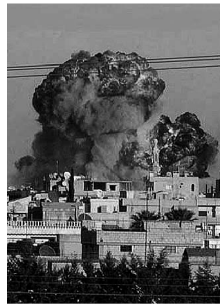
НА ФОТО: УДАР ПО БОЕВИКАМ

руководство и хорошо организованная армия, которая четвертый год подряд ведет довольно успешную борьбу с превосходящими силами. Совет Федерации принял правильное, но крайне запоздалое решение. Мы должны помнить, что если сдаем Сирию, то огромные просторы от Ирана до Средиземного моря будут контролировать террористы — тогда побегут не сотни тысяч, а миллионы беженцев, в том числе в южное «подбрюшье» России. Нам надо оказывать помощь, наращивать поставки оружия, обратиться к соседям — Турции, Саудовской Аравии, Катару. Им не нравится Асад, но без него невозможна нормальная работа в Сирии. Надо отложить все личные споры в сторону и вместе не допустить господства террористов.