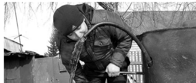
НА ФОТО: ВОДА В ДОМЕ — РОСКОШЬ?