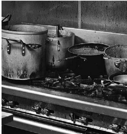
НА ФОТО: ПИЩЕБЛОК НУЖДАЕТСЯ В РЕМОНТЕ

В ходе террористических операций бандиты захватили нефтяные и газовые месторождения, стремясь лишить Сирию одного из ее важнейших экономических ресурсов. Они были намерены разрушить инфраструктуру,