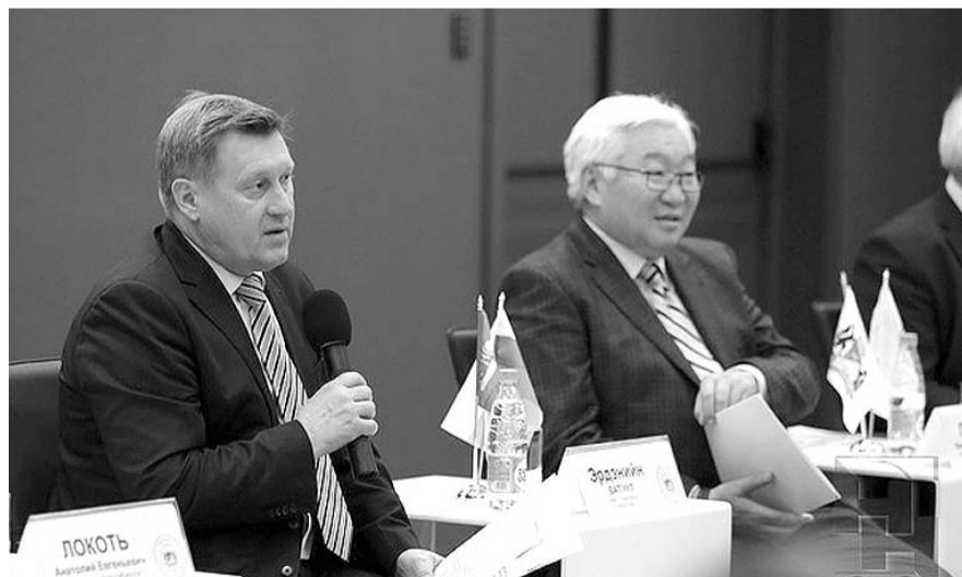
НА ФОТО: МЭР НОВОСИБИРСКА АНАТОЛИЙ ЛОКОТЬ И МЭР УЛАН-БАТОРА ЭРДЭНЭ БАТ-УУЛ

— На выставке представлены возможности российского производителя в целом и новосибирского — в частности. Широкий спектр отечественной продукции, которую мы увидели здесь, безусловно, может использоваться в развитии муниципалитетов: это интересно и Новосибирску, и Улан-Батору.