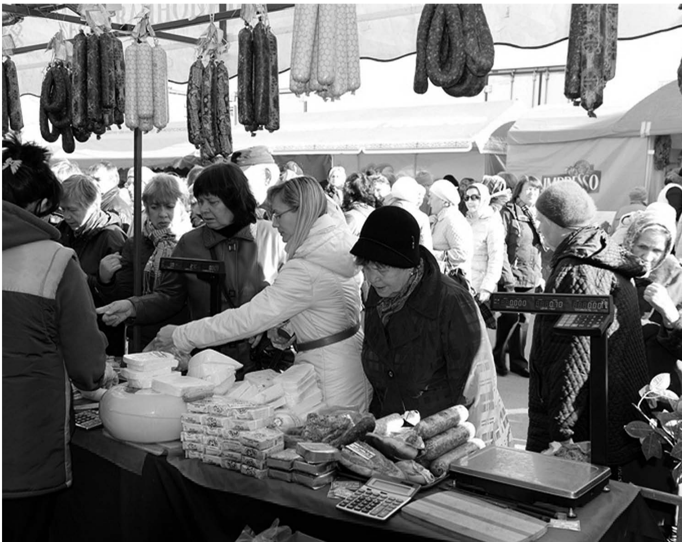
НА ФОТО: ГОРОЖАНЕ ВЫСТРОИЛИСЬ В ОЧЕРЕДЬ ЗА БЕЛОРУССКИМИ ПРОДУКТАМИ