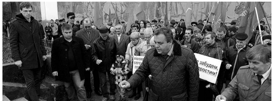
НА ФОТО: УЧАСТНИКИ МИТИНГА ЗАЖГЛИ СВЕЧИ В СКВЕРЕ ГЕРОЕВ РЕВОЛЮЦИИ