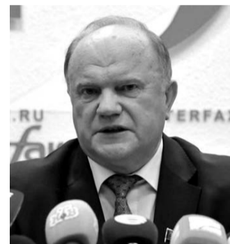
НА ФОТО: ГЕННАДИЙ ЗЮГАНОВ

Лидер КПРФ и ее фракции в Госдуме Геннадий ЗЮГАНОВ выразил возмущение по поводу утверждений ряда западных СМИ относительно того, что российские ВВС бомбят сирийскую оппозицию.