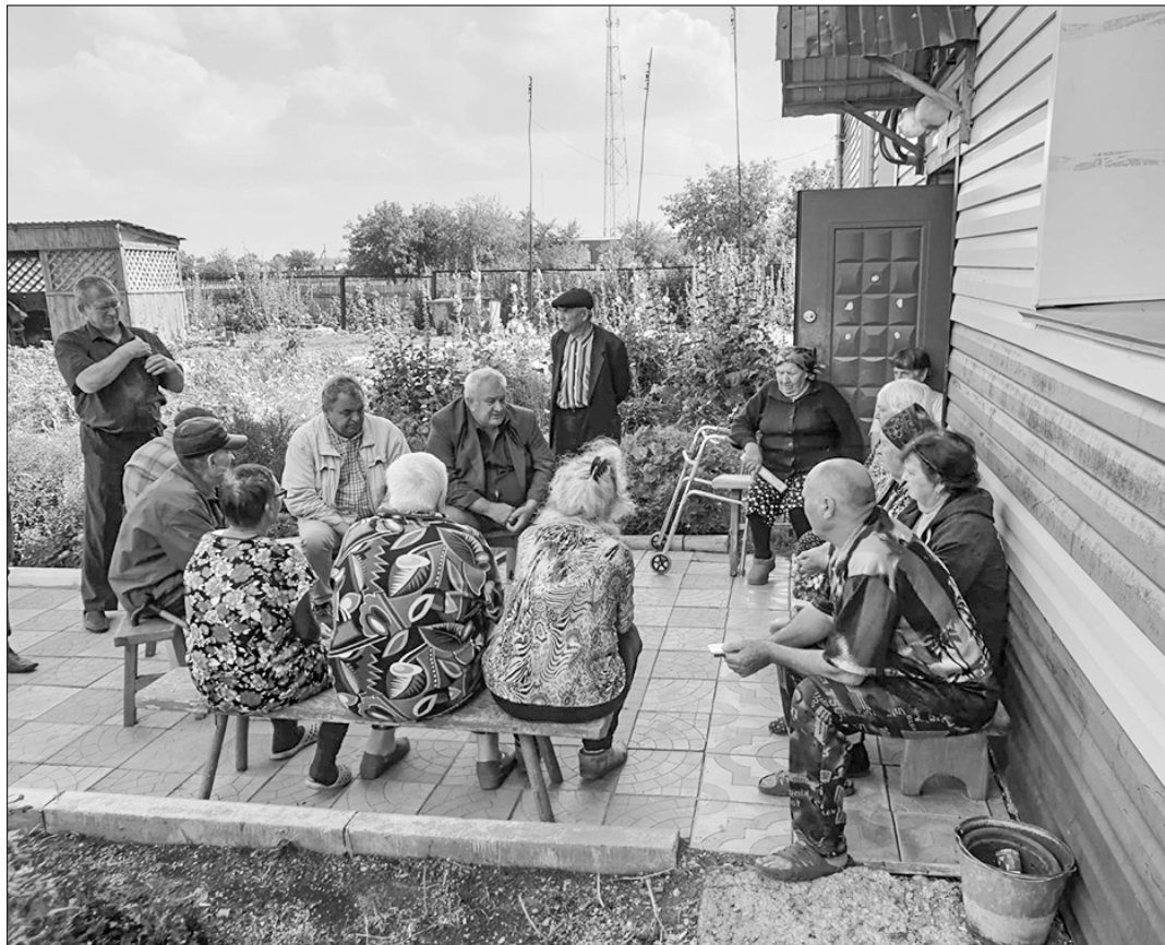
Материалы выпуска подготовил соб. корр. «Правды» Антон СЕНОПАЛЬНИКОВ.