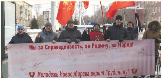
НА ФОТО: КОМСОМОЛЬЦЫ НА ПИКЕТЕ