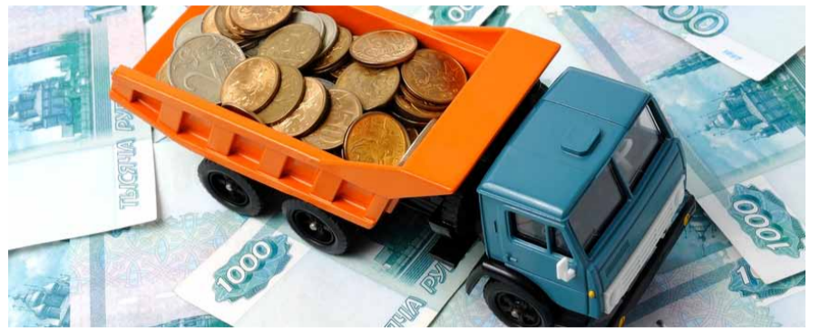
НА ФОТО: ТРАНСПОРТНЫЙ НАЛОГ ВЕЗЕТ С СОБОЙ РОСТ ЦЕН

— Мы считаем, что транспортный налог должен быть отменен. Высшее руководство страны заявляло, что с включением в стоимость топлива акцизов по истечению 3-4 лет транспортный налог должен быть отменен. Но на практике акциз растет, налог остается. Наши законодатели установили максимальную планку транспортного налога