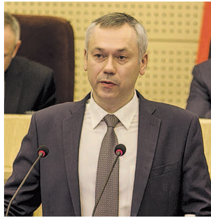
НА ФОТО: АНДРЕЙ ТРАВНИКОВ

Андрей Травников признал, что в действующих условиях проект реализовать нельзя. Он заверил депутата в том, что ведутся переговоры по выходу из соглашения без санкций для областного бюджета, что никаких действий по практической реализации соглашения не предпринимается. Врио губернатора пообещал поставить вопрос о расторжении «мусорной концессии» на заседании правительства региона. Что касается метро, то данный вопрос, по словам Андрея Травникова, сложный