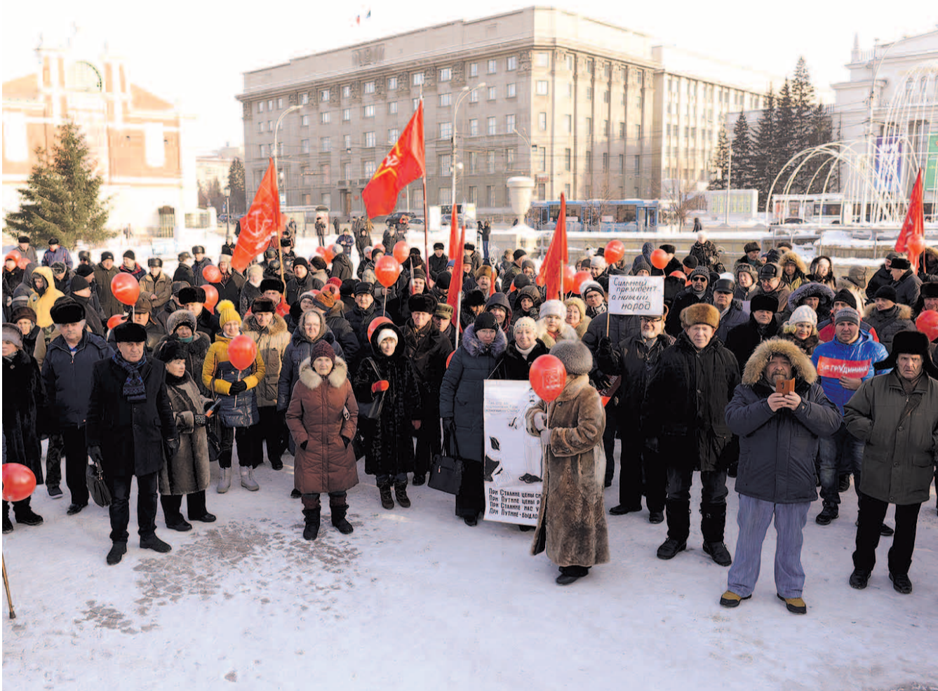
НА ФОТО: В БОРЬБЕ ЗА ЧЕСТНЫЕ ВЫБОРЫ НОВОСИБИРЦЕВ МОРОЗОМ НЕ ИСПУГАТЫ!