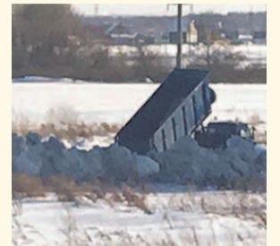
НА ФОТО: СНЕГООТВАЛ