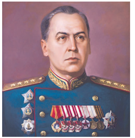
НА ФОТО: ГЕНЕРАЛ АРМИИ А.И. АНТОНОВ

В конце 1943 года был учрежден высший полководческий орден «Победа». Им награждались военачальники из верховного командного состава Красной Армии за успешное проведение таких масштабных операций фронтов, в результате которых в корне менялась обстановка в нашу пользу. Советских кавалеров этого ордена было одиннадцать — десять маршалов и один генерал армии — руководитель Генерального штаба Алексей Иннокентьевич АНТОНОВ .