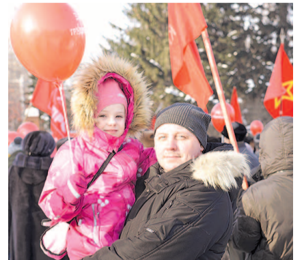
НА ФОТО: С ДЕТСТВА ЗА ЧЕСТНЫЕ ВЫБОРЫ!