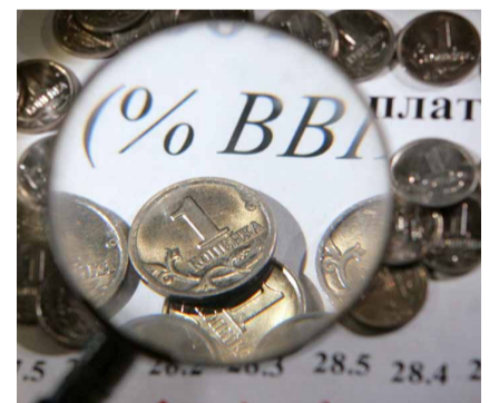
НА ФОТО: ВВП РОССИИ РАСТЕТ НА 1,5-2%, А МОГ БЫ НА 6-7%, КАК В КИТАЕ

Промышленность России падает темпами, которых не наблюдалось последние лет восемь, а банковская сфера при этом процветает, получая