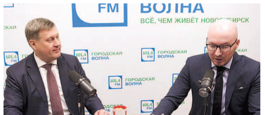
НА ФОТО: АНАТОЛИЙ ЛОКОТЬ (СЛЕВА) В СТУДИИ «ГОРОДСКОЙ ВОЛНЫ»

Мэр напомнил, что новейшие производства, все то, что называется «цифровая экономика» — находится в городах. То, что бюджеты крупных городов часто являются дефицитными, сказывается и на привлекательности последних для ведения бизнеса. Анатолий Локоть подчеркнул, что этот вопрос должен решаться аккуратно, что город может взять на себя часть полномочий при получении источников финансирования.