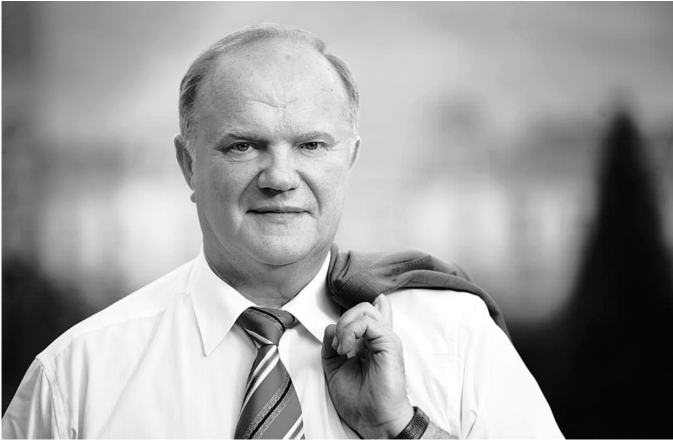
● НА ФОТО: ПРЕДСЕДАТЕЛЬ ЦК КПРФ, КАНДИДАТ В ПРЕЗИДЕНТЫ РФ ГЕННАДИЙ АНДРЕЕВИЧ ЗЮГАНОВ

Зона евро переживает кризис. Трещит конструкция Евросоюза. Греция и Португалия на грани дефолта. Безработица в Испании превысила 22%. Даже состоятельную Италию лихорадит все сильнее. Ее долг достиг двух триллионов евро. Казалось бы, на саммите Евросоюза приняты важные соглашения. Сближаются основные принципы бюджетной и налоговой политики 17 стран Еврозоны. Однако в число этих стран не собирается входить Великобритания. Свое несогласие с новыми правилами она объясняет необходимостью сохранить суверенитет. Вне бюджетно-налогового союза остаются еще 10 стран Европы.