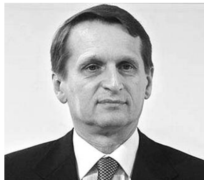
● НА ФОТО: СЕРГЕЙ НАРЫШКИН

Представители оппозиционных партий уже высказались, что как к профессионалу претензий к Нарышкину нет. Возмущение вызвал сам факт, что спикер навязан партией власти. Игорь ЛЕБЕДЕВ , сын Владимира ЖИРИНОВСКОГО и один из лидеров ЛДПР, озвучил общую мысль. Четвертое лицо в государстве — спикер Госдумы — «представляет перед всеми иными органами власти и за рубежом всю палату, мнение всех ее депутатов», напомнил депутат. Однако поскольку Нарышкин избран только одной фракцией, «в любой момент, где бы и чего бы он ни сказал, мы