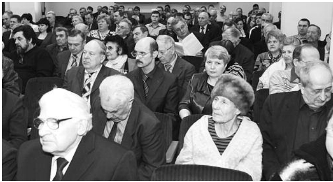
● НА ФОТО: КОММУНИСТЫ ОБСУДИЛИ ПРЕДСТОЯЩУЮ КАМПАНИЮ