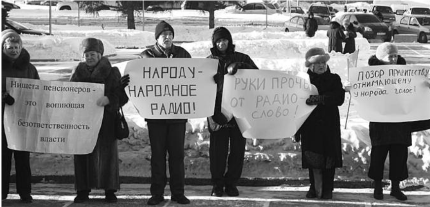
● НА ФОТО: ПИКЕТ 24 ФЕВРАЛЯ 2011 ГОДА — ТОГДА ВЛАСТЬ НАРОД НЕ УСЛЫШАЛА. СЕЙЧАС УСЛЫШИТ?

Однако во власти укоренилось мнение, что такое радио в основном поддерживало коммунистов, работало для них. Но это далеко не так. Редакция радио «Слово» скорее занимала позицию своих слушателей, давая возможность представителям как партии власти, так и оппозиции высказывать свои оценки происходящего, разные точки зрения. Но, видимо, власть предрасположена к