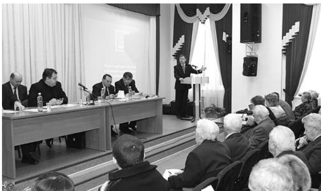
● НА ФОТО: ИДЕТ СОВМЕСТНЫЙ ПЛЕНУМ ОБКОМА И КРК КПРФ

24 декабря состоялся совместный пленум обкома и контрольно-ревизионной комиссии Новосибирского областного отделения КПРФ. Коммунисты обсудили итоги выборов депутатов Государственной думы и планы на выборы Президента РФ 4 марта.