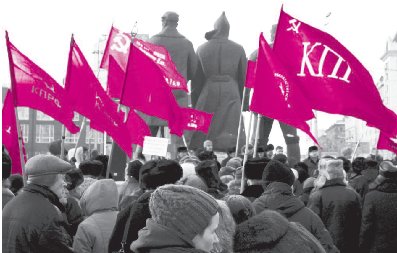
● НА ФОТО: МИТИНГ КПРФ «ЗА ЧЕСТНЫЕ ВЫБОРЫ» ПРОШЕЛ НА ПЛОЩАДИ ЛЕНИНА 23 ДЕКАБРЯ