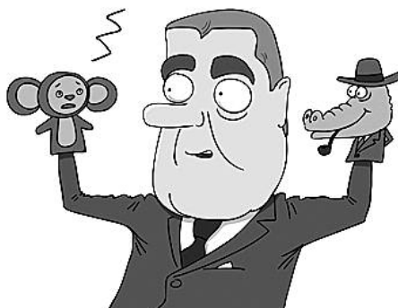
● НА РИС.: ПОЛИТИЧЕСКИЕ ИГРЫ

вительно, главой Администрации вместо НАРЫШКИНА стал друг Путина по КГБ Сергей ИВАНОВ. А источник «Коммерсанта» заявил тогда о судьбе Суркова: Путин с ним «работать не будет».