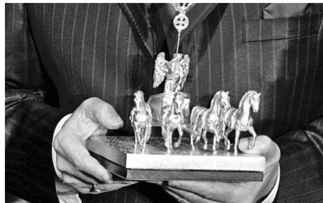
● НА ФОТО: НЕМЕЦКАЯ «КВАДРИГА» «ПРОСКАЛА» МИМО ПРЕМЬЕРА

Владимир ПУТИН стал жертвой принципиальности организаторов ежегодной немецкой премии «Квадрига», среди лауреатов которой были Михаил ГОРБАЧЕВ , Вацлав ГАВЕЛ и Виктор ЮЩЕНКО . Сначала жюри принципиально присудило премию премьеру России «за стремление к инновациям, общественному благу и обновлению», но затем, после протестов общественности, столь же принципиально отозвало свое решение и вообще отказалось от идеи вручать ее в 2011 году. Путин на эту новость не отреагировал, зато его пресс-секретарь Дмитрий ПЕСКОВ заявил, что «странной свистопляской эта организация только навредила себе и своей репутации».