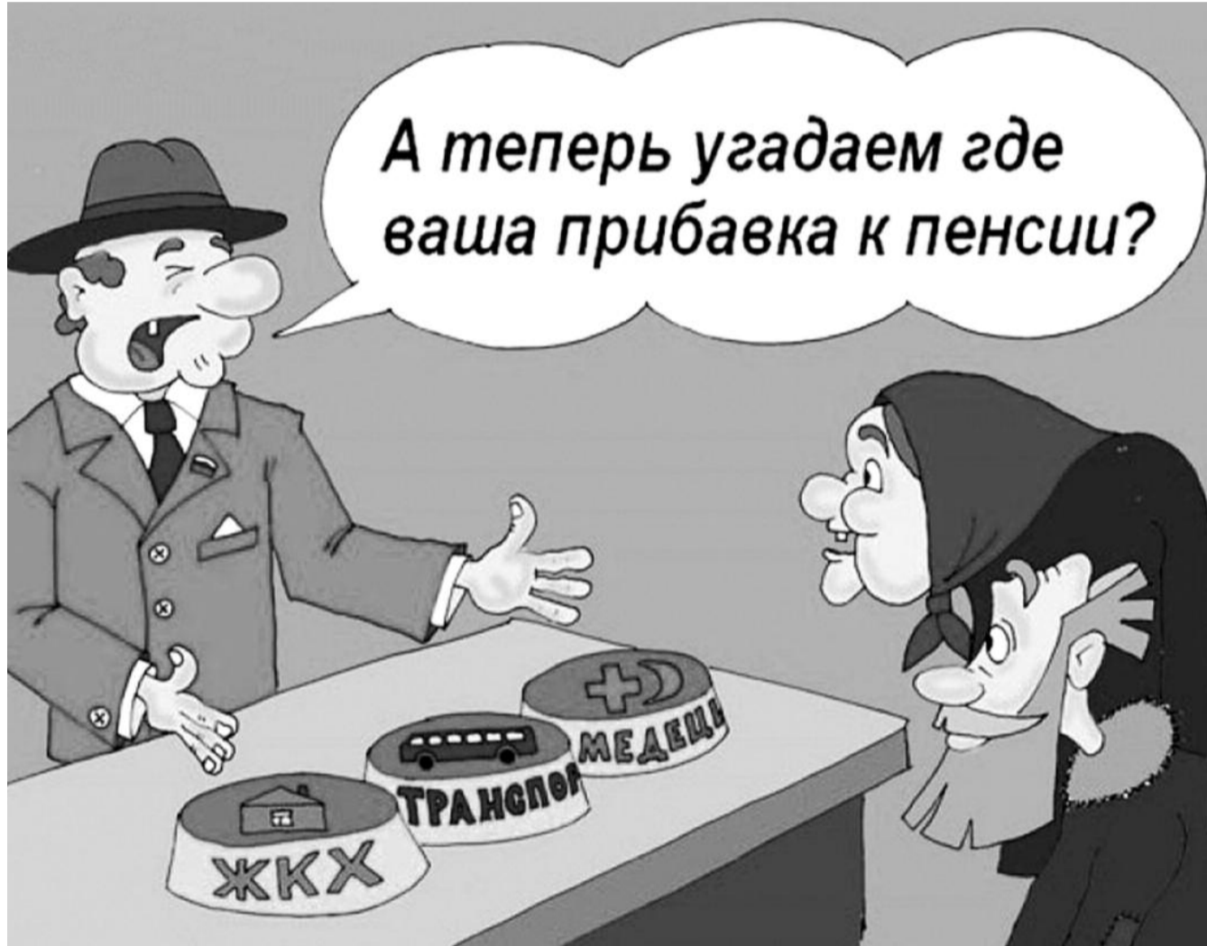
● НА РИС.: ГОСУДАРСТВО-НАПЕРСТОЧНИК ИГРАЕТ С ПЕНСИОНЕРАМИ В ИГРУ «НАЙДИ, ГДЕ СПРЯТАНО ОЧЕРЕДНОЕ ПОВЫШЕНИЕ ЦЕН»