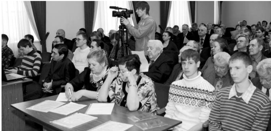
● НА ФОТО: КОММУНИСТЫ СОБЕРУТСЯ НА КОНФЕРЕНЦИЮ В КОНЦЕ СЕНТЯБРЯ

Завершилось проведение отчетно-выборных конференций практически во всех районах Новосибирской области. Осталось провести отчетно-выборные конференции еще в пяти местных отделениях КПРФ. На отчетно-выборных конференциях избраны делегаты на 23 отчетно-выборную областную партийную конференцию. На местных отчетно-выборных конференциях также были рассмотрены отчеты о работе районных, городских комитетов партии и районных контрольно-ревизионных комиссий, сформированы и избраны партийный орган районного комитета, районные контрольно-ревизионные комиссии и делегаты на областную партий-