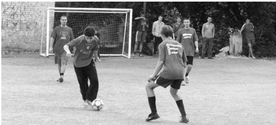
● НА ФОТО: РАЙКОМЫ ТЩАТЕЛЬНО ОТБИРАЮТ КАНДИДАТОВ В КОМАНДЫ

24-26 августа в поселке Репьево пройдет 1-я спартакиада Новосибирского обкома КПРФ. Районные комитеты уже начали активно готовиться к соревнованиям и формировать команды из молодого актива. Самым популярным видом спорта стал футбол, команды по которому сформированы практически у всех райкомов.