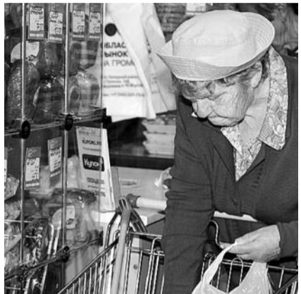
● НА ФОТО: ХЛЕБ УЖЕ НАЧАЛ ДОРОЖАТЬ

Оказывает влияние на положение дел в отрасли и психологический фактор. Зарплаты в пекарном деле далеко не всегда дотягивают до средних по региону. В Московской области текучка кадров на