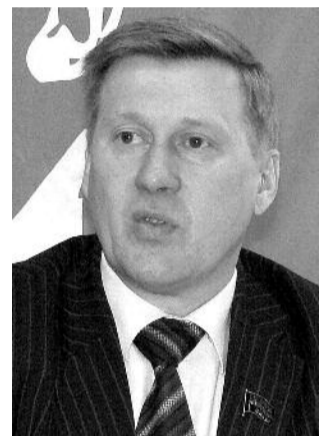
● НА ФОТО: АНАТОЛИЙ ЛОКОТЬ

Ракета «Протон-М» не смогла вывести на переходную орбиту космические спутники связи «Экспресс-МД2» и «Телком-3». В Роскосмосе объясняют очередную неудачу нештатной ситуацией, которая произошла из-за неполадок в разгонном блоке.