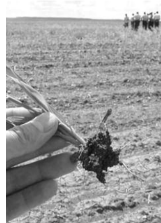
● НА ФОТО: НИ КАПЛИ ВЛАГИ

Региональные власти в связи с засухой и гибелью урожая все-таки ввели режим чрезвычайной ситуации в ряде районов Новосибирской области. Сам по себе этот режим не предполагает экстраординарных «спасительных» мер, однако даст возможность сельским производителям претендовать на компенсацию в связи с потерей вложенных средств.