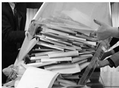
НА ФОТО: ТОЛЬКО КОНТРОЛЬ ОБЕСПЕЧИТ ЧЕСТНЫЕ ВЫБОРЫ

— Мы в день выборов не ожидаем таких масштабных нарушений, какие имели место в других регионах. Новосибирск в этом плане всегда был довольно приличным городом. Наши члены избирательных комиссий хорошо обучены, дорожат своей репутацией и вряд ли станут ставить ее под угрозу ради каких-то сомнительных целей. Например, у нас, в принципе, в целом аккуратно и спокойно прошли предыдущие выборы в Госдуму. В масштабных фальсификациях наш город не был замечен по сравнению с соседними регионами, где протоколы переписывались на уровне территориальной избирательной комиссии. У нас такого себе не позволяли. Но у нас есть нарушения другого плана — нарушения в ходе ведения агитации со стороны отдельных кандидатов. Газеты издаются без выходных данных, в них публикуются недостоверные