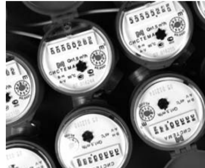
НА ФОТО: ПОСЧИТАЛИ ДВАЖДЫ

Только сейчас, когда решения приняты и на областном, и на федеральном уровнях, мэрия, что называется, спохватилась