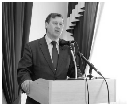
НА ФОТО: ОЦЕНКИ ЭТОЙ ИЗБИРАТЕЛЬНОЙ КАМПАНИИ БЫЛИ ЖЕСТКИМИ

— Весь ход избирательной кампании создает уникальные условия для победы кандидата от оппозиции на этих выборах. И большинство оппозиционно настроенных сил в Новосибирске и области связывают эти надежды с нами. Но не надо расслабляться. Административный ресурс свой нажим не ослабил, и этот нажим мы чувствуем каждый день. С приближением 6 апреля — даты выборов — этот нажим все больше и больше возрастает.