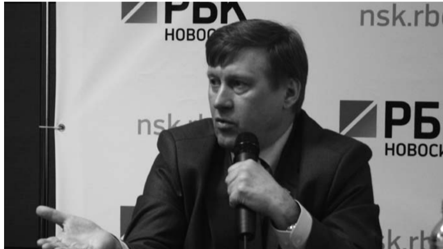
НА ФОТО: МЭРУ НЕОБХОДИМО РЕШАТЬ МНОГО ПРОБЛЕМ...

— В этой сфере необходимо кардинально менять систему, — уверен Анатолий Локоть. — Как получают эти муниципальные заказы? Почему именно эти организации сидят на поставках продуктов или питания детям? Было несколько прецедентов, когда инициаторами проверок выступали общественные организации. Это говорит о том, что здесь не все в порядке, и нужно менять ситуацию. Законодательство