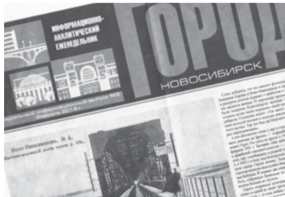
НА ФОТО: У

Предателя Власова оправдывают только предатели типа КАЛУГИНА , ГОРДИЕВСКОГО , «прораба перестройки», первого мэра Москвы Гавриила ПОПОВА . На самом деле, если бы немцы в 41-м вошли в Москву, там нашлась бы орда подонков, которая бы рукоплескала им. Под либеральным