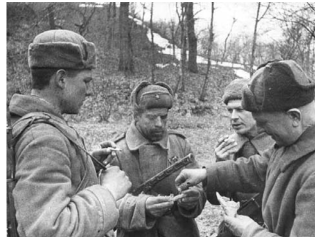
● НА ФОТО: ПЕРЕКУР В ПЕРЕРЫВЕ МЕЖДУ БОЯМИ. ОКТЯБРЬ 1942-ГО.

А закончу оптимистически. Россия, несмотря ни на что, непобедима! В этом убедятся даже отчаянные антисталинисты, сталинофобы и сталинофаги. Приведу такой факт.