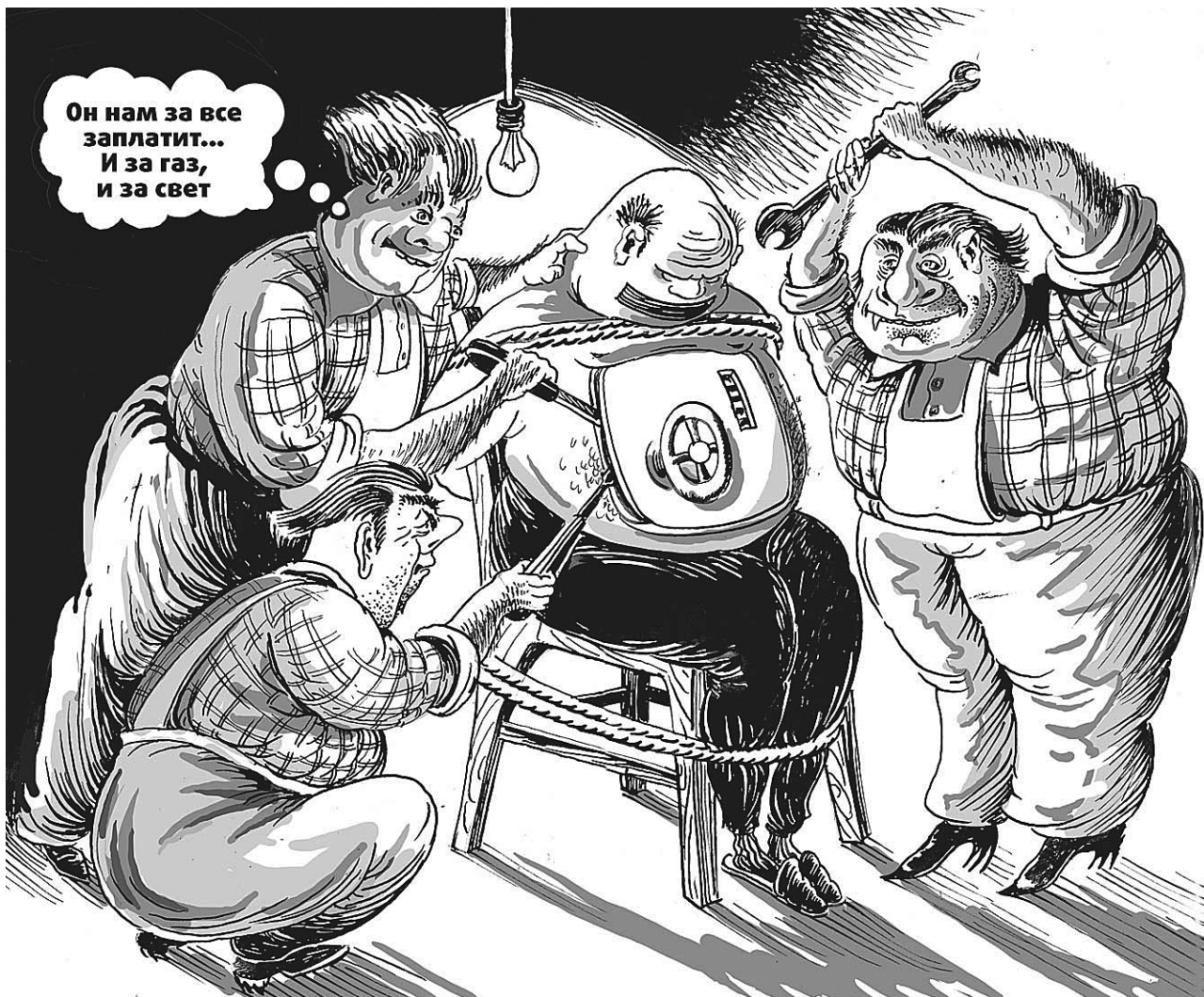
● НА РИС.: НЕ МОЖЕТЕ РАСПЛАТИТЬСЯ ЗА КОММУНАЛКУ? ТОГДА ОНИ ИДУТ К ВАМ!