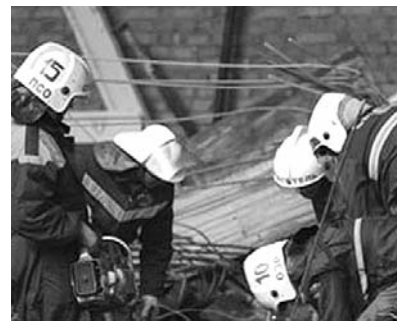
● НА ФОТО: СПАСАТЕЛИ РАЗБИРАЮТ ЗАВАЛЫ

Строительство ведется на уровне первого этажа, в воскресенье шла заливка перекрытий бетоном, отмечают в МЧС. Площадь обрушения составила 288 кв. м. В результате обрушения пострадали четверо мужчин, их доставили в отделение травматологии ЦКБ СО РАН. В тяжелом состоянии находится мужчина 1975 года рождения — у него перелом позвонка и ушиб грудной клетки, еще двое — на амбулаторном лечении (у одного ушиб грудной клетки, у другого — перелом кости стопы). Строительство технопарка с самого начала сопровождалось множеством скандалов: от протестов экологов до информации о нерациональном использовании материальных средств, выделенных на строительство.