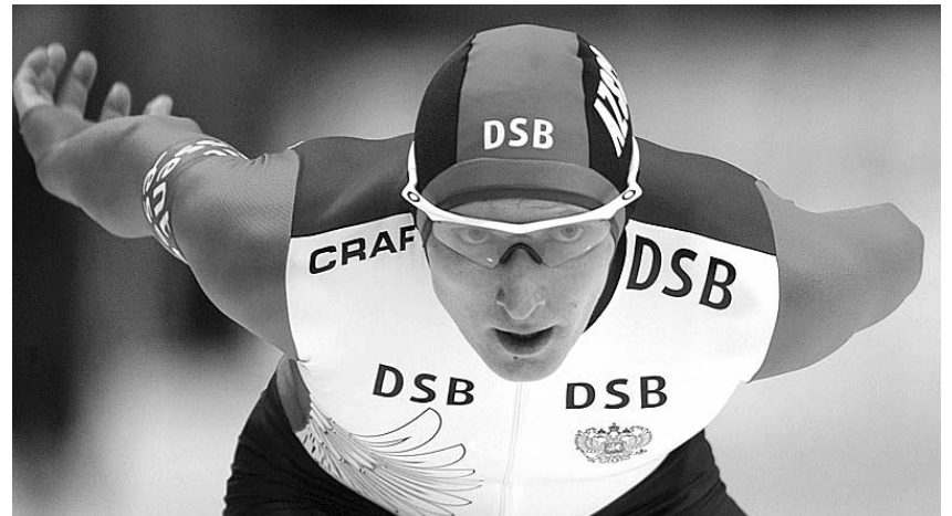
● НА ФОТО: КОНЬКОБЕЖЕЦ ИВАН СКОБРЕВ ЗАВОЕВАЛ ПОКА ЕДИНСТВЕННУЮ МЕДАЛЬ В ОБЩЕЙ КОПИЛКЕ НАШЕЙ СБОРНОЙ НА ОЛИМПИАДЕ В ВАНКУВЕРЕ

шаге от пьедестала почета. Это особенно печально, так как россияне остались без наград в дисциплине, которая приносила олимпийское золото нашей стране, начиная с 1964 года.