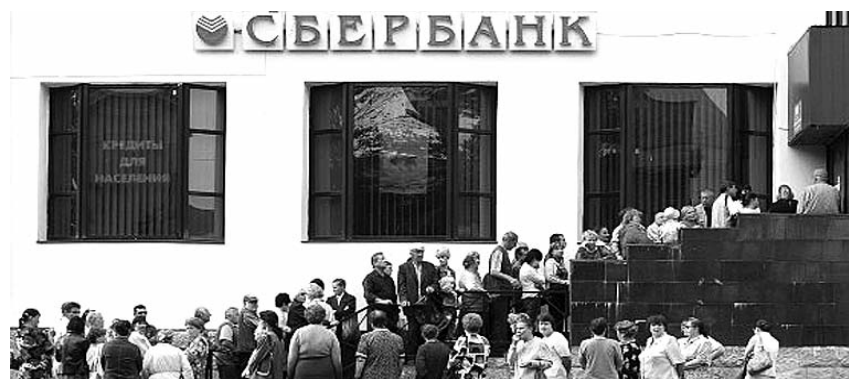
● НА ФОТО: НЕСИТЕ ВАШИ ДЕНЕЖКИ...