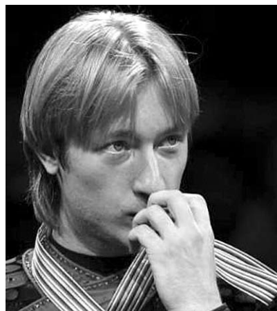
● НА ФОТО: ПЛЮЩЕНКО — ОДИН ЗА ВСЕХ?