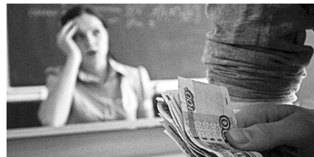
● НА ФОТО: ЗА ЗНАНИЯ НАДО ПЛАТИТЬ

Новосибирское отделение «Всероссийского женского союза» — Надежда России» проявляет обеспокоенность оче-