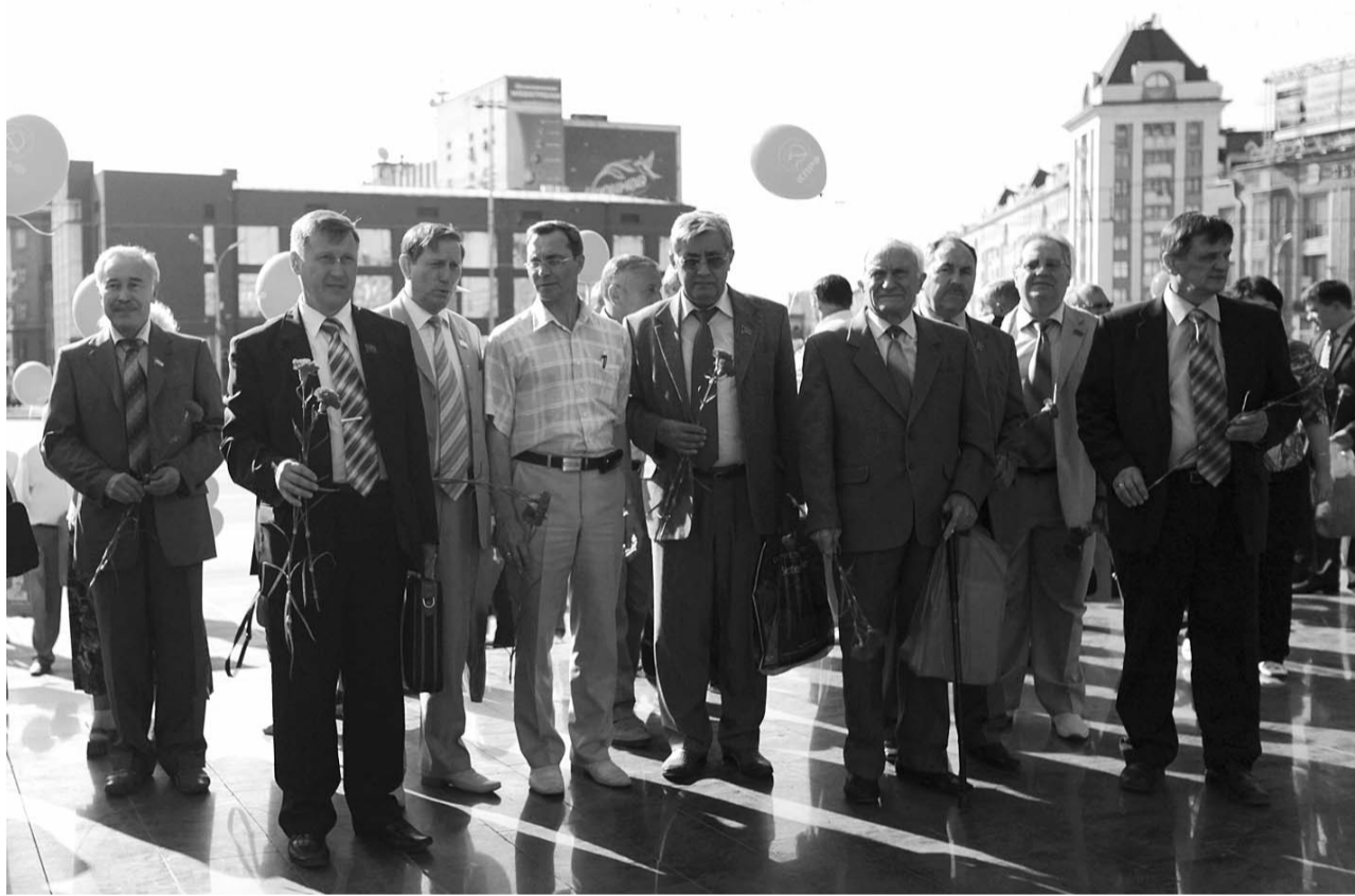
● НА ФОТО: КОММУНИСТЫ СИБИРИ В ЦЕНТРЕ НОВОСИБИРСКА. ВОЗЛОЖЕНИЕ ЦВЕТОВ К ПАМЯТНИКУ В.И. ЛЕНИНУ