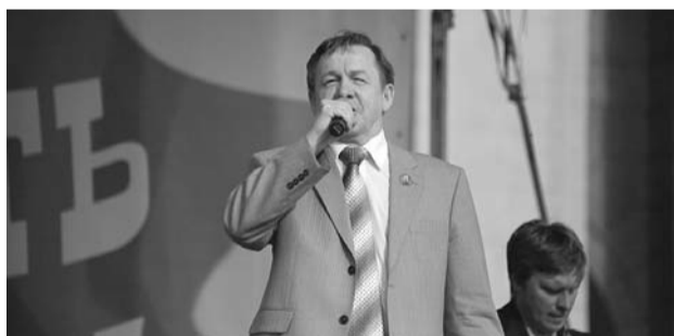
● НА ФОТО: ПОЕТ ВЛАДИМИР КАРПОВ

ЗАВЕРШИЛ СЪЕЗД НАРОДНЫХ ДЕПУТАТОВ СИБИРИ