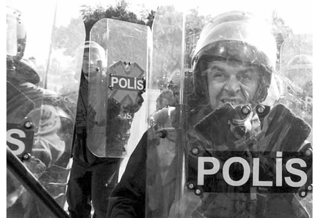
● НА ФОТО: КОГО ОНИ БУДУТ ЗАЩИЩАТЬ?

Президент МЕДВЕДЕВ недавно выступил с предложением о переименовании милиции в полицию и направил проект закона для обсуждения общественностью. В период тотального наступления антинародной власти на демократические права трудящихся, и сползании страны к полицейщине, такие законы неизбежны.