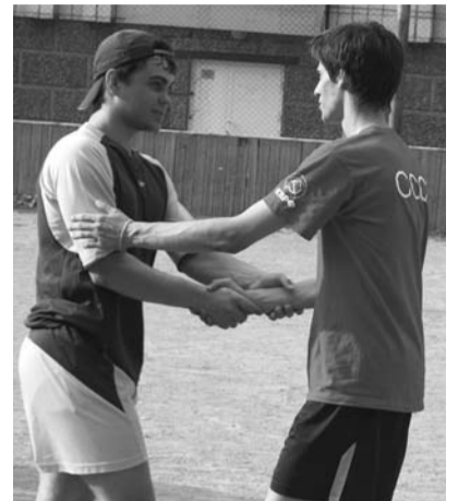
● НА ФОТО: РУКОПОЖАТИЕ ПОСЛЕ ИГРЫ

Чувствуя себя весьма комфортно при таком счете, во втором тайме СКМовцы, не желая тратить лишние силы, сконцентрировались на контроле мяча. Но, даже не смотря на это, на 3 минуте второго тайма, нападающий команды СКМ хорошо открылся в чужой вратарской,