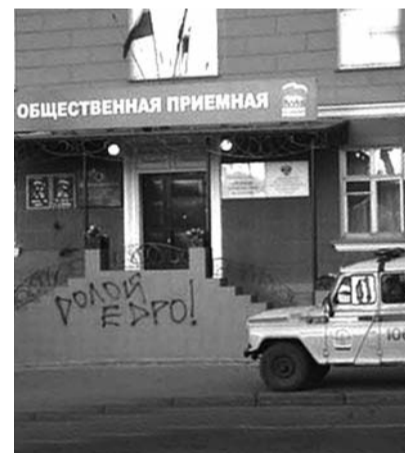
● НА ФОТО: ЗАРОСЛА НАРОДНАЯ ТРОПА

Вам, более высокой партийной инстанции, я пишу с надеждой на восстановление справедливости в распределении должностей в горсовете и на разъяснение политических и моральных принци-