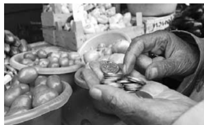
● НА ФОТО: СКОРО ЕДА СТАНЕТ БОГАТСТВОМ

Однако самую большую опасность представляет собой рост населения на планете — с 6,7 до 9 млрд. человек, что случится уже в ближайшем будущем. Самый большой прирост произойдет в тех регионах, которые уже сейчас испытывают сложности с тем, чтобы себя прокормить. В настоящее время в списке ООН фигурируют 77 стран с такого рода