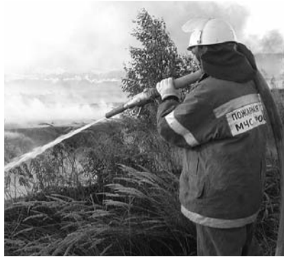
● НА ФОТО: ОДИН НА ПОЖАРЕ НЕ ВОИН

отвечают за десятки гектаров. Ясное дело, что при всем их профессионализме полностью проконтролировать такую