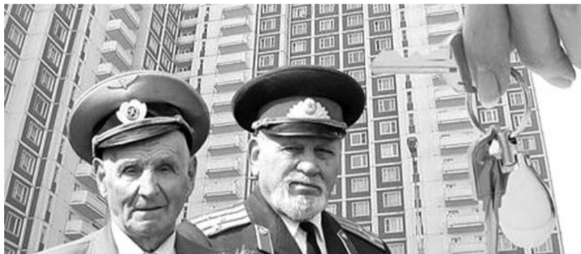
● НА ФОТО: СПРАВЯТ ЛИ ВETERANЫ НОВОСЕЛЬЕ?