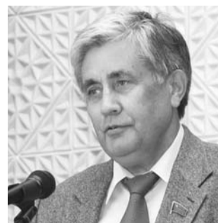
● НА ФОТО: ВАЛЕНТИН ШУРЧАНОВ

О депутатской вертикали КПРФ и новом органе взаимодействия между депутатами-коммунистами Сибири мы побеседовали с членом президиума, секретарем ЦК КПРФ, депутатом Государственной думы Валентином ШУРЧАНОВЫМ .