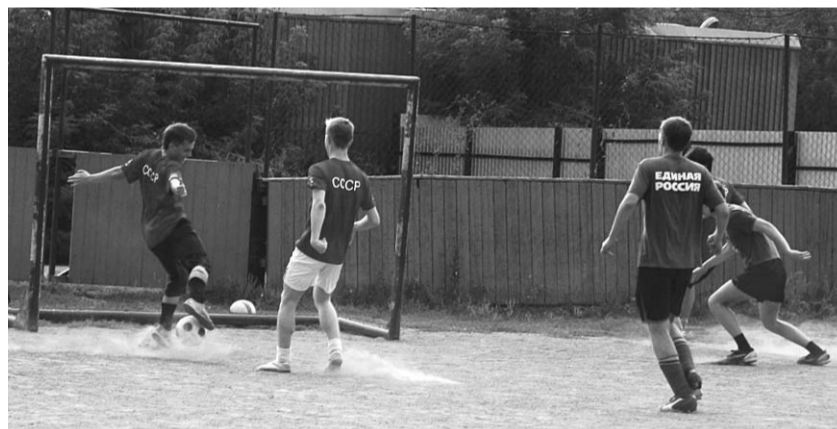
● НА ФОТО: ГОЛ В ПУСТЫЕ ВОРОТА