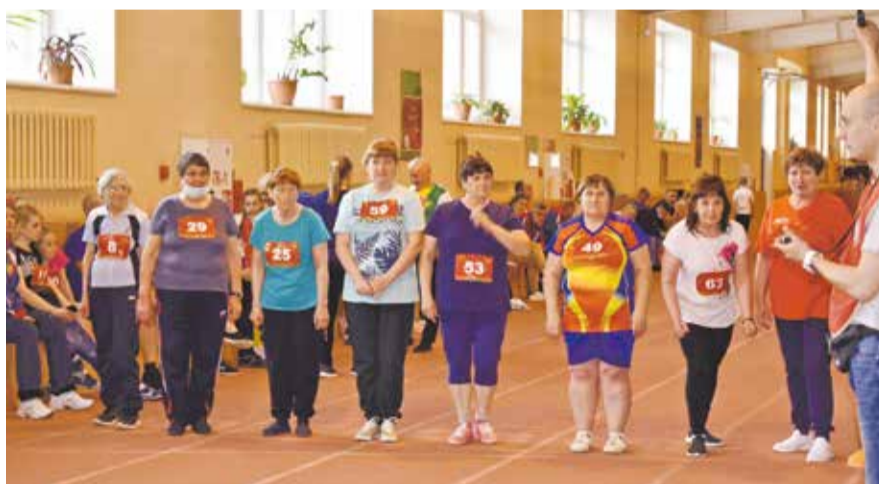
НА ФОТО: УЧАСТНИКИ ФЕСТИВАЛЯ «ГОТОВ К ТРУДУ И ОБОРОНЕ»

— Я в конце марта получил положение о конкурсе. За район мы выступаем давно, всегда готовы были принять участие. Но мы особо не ожидали, что выиграем, — я два раза переболел, ехал ослабленный, дочка была самой младшей из участниц, — рассказал коммунист.