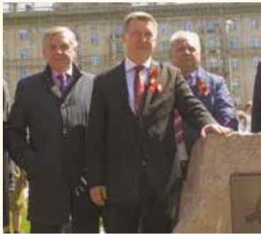
НА ФОТО: МЭР НОВОСИБИРСКА АНАТОЛИЙ ЛОКОТЬ НА ОТКРЫТИИ ЗАКЛАДНОГО КАМНЯ

— Мы закладываем новую традицию в череде мероприятий 9 мая. Появляется еще одно знаковое место, куда будут приходить новосибирцы, чтобы поклониться трудовому подвигу сибиряков. В этом великая историческая справедливость.