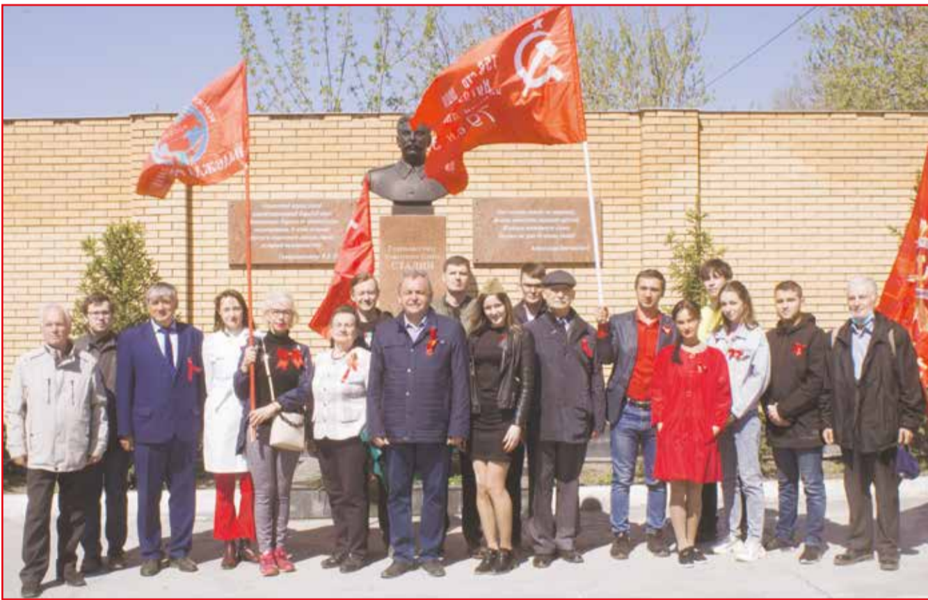
НА ФОТО: НОВОСИБИРСКИЕ КОММУНИСТЫ НА ВОЗЛОЖЕНИИ В ЧЕСТЬ ДНЯ ПОБЕДЫ