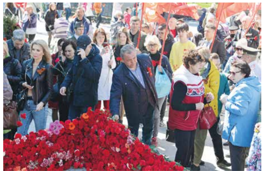
НА ФОТО: НОВОСИБИРЦЫ ВСЬ ДЕНЬ НЕСЛИ ЦВЕТЫ К ВЕЧНОМУ ОГНЮ

— Праздник остался всенародным, потому что Великую Отечественную войну выиграл советский народ. День Победы — это праздник, который прошел через каждую семью. В свое время