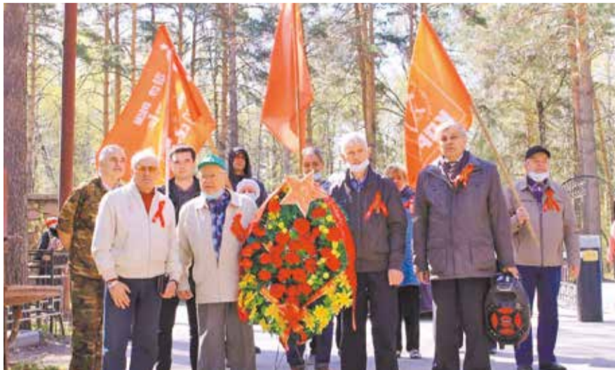
НА ФОТО: КОММУНИСТЫ ЗАЕЛЬЦОВСКОГО РАЙОНА НА МЕМОРИАЛЕ «РАНЕНЫЙ ВОИН»

Районные отделения КПРФ 9 мая провели множество мероприятий, почтив память победителей в Великой Отечественной войне — советских воинов и тружеников.