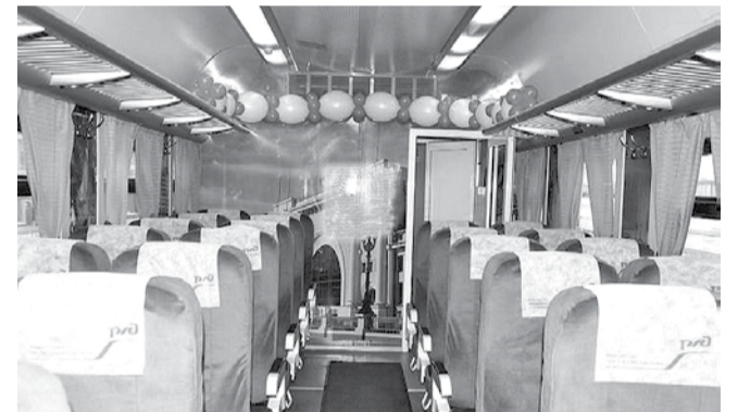
НА ФОТО: ВАГОН НОВОГО ПЕЗДА

Мэр Анатолий ЛОКОТЬ принял 14 декабря участие в церемонии запуска новых пассажирских поездов на линиях железнодорожных сообщений «Новосибирск-Барнаул» и «Новосибирск-Томск».