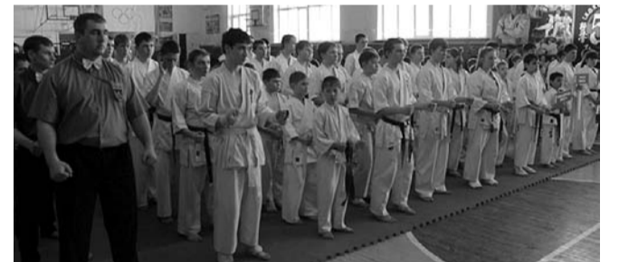
НА ФОТО: УЧАСТНИКИ СОРЕВНОВАНИЙ