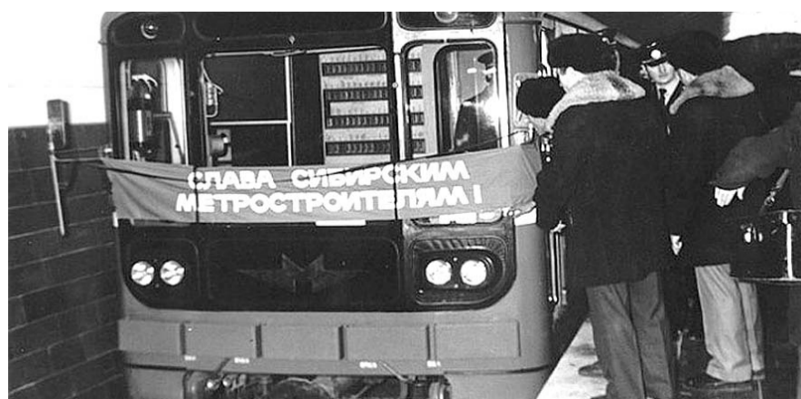
НА ФОТО: НОВОСИБИРСКИЙ МЕТРОПОЛИТЕН — ЕДИНСТВЕННЫЙ ЗА УРАЛОМ

Николай ХОЛОДОВ, первостроитель Новосибирского метро