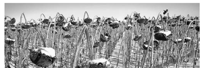
НА ФОТО: УРОЖАЙ, КОТОРЫЙ НЕ УСПЕЛИ УБРАТЬ, ПРОПАДАЕТ