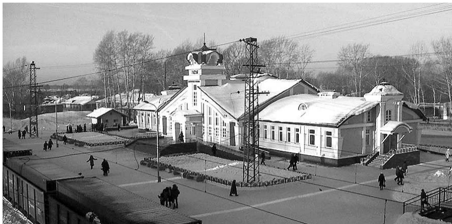
НА ФОТО: ВОКЗАЛ НА СТАНЦИИ «МОШКОВО»