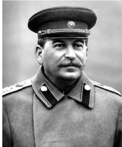
НА ФОТО: ИОСИФ СТАЛИН

революция, ни НАПОЛЕОН , никто другой не сделали в истории столько, сколько сделал Сталин. С его именем связано существование всех нас. Победы Гитлер СССР, уже не было бы русских, не было бы уже французов, англичан, американцев. Как хотите, он гениален еще и потому, что сумел сделать в годы последней мировой войны своими союзниками и англичан, и американцев, и французов».