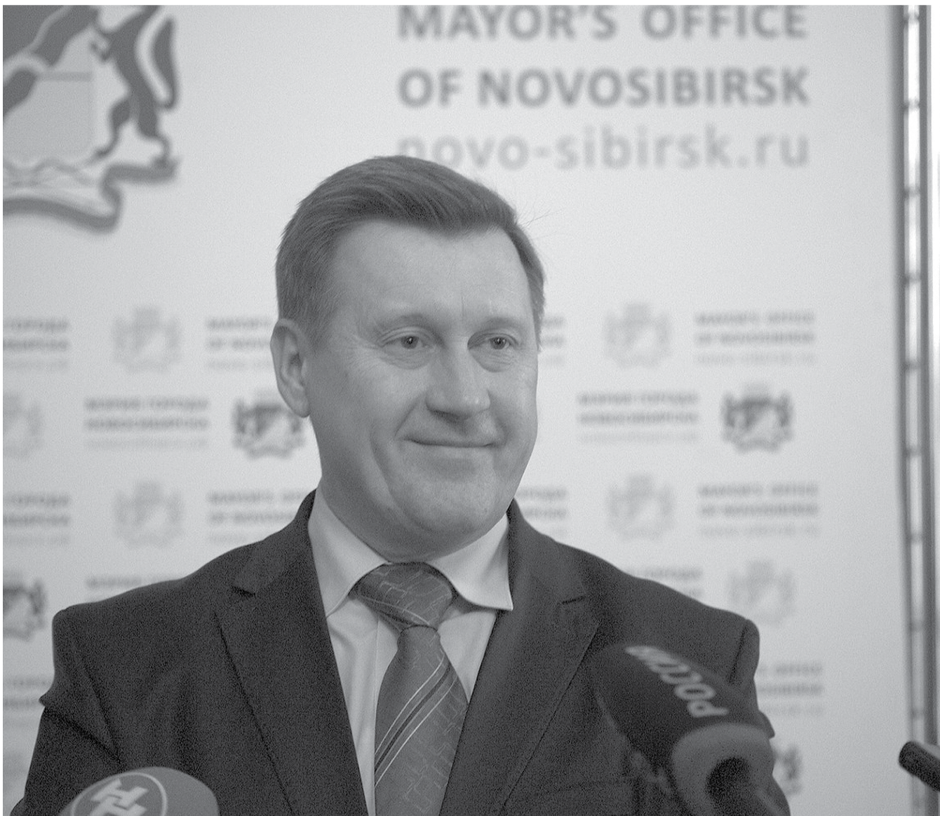
НА ФОТО: МЭР НОВОСИБИРСКА АНАТОЛИЙ ЛОКОТЬ