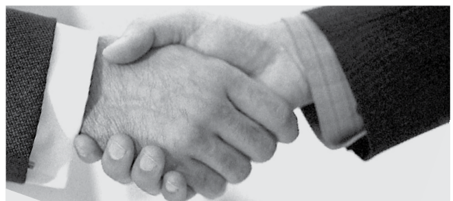
НА ФОТО: ВЛАСТЬ БУДЕТ УЧИТЫВАТЬ МНЕНИЕ ОБЩЕСТВА