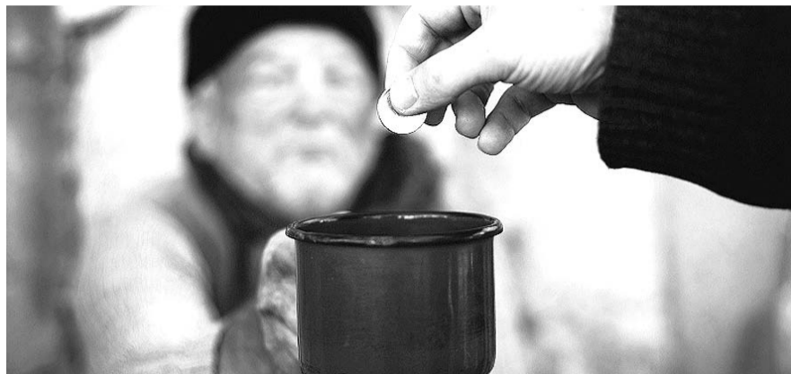
НА ФОТО: УРОВЕНЬ БЛАГОСОСТОЯНИЯ НАСЕЛЕНИЯ ПАДАЕТ