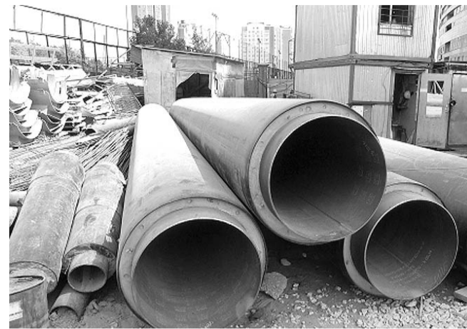
НА ФОТО: В 2015 ГОДУ В НОВОСИБИРСКЕ ПОМЕНИЛИ 100 КМ. ТЕПЛОТРАСС

— Бюджет остается социально ориентированным, — отметил Анатолий