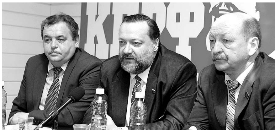
НА ФОТО: НА ПРЕСС-КОНФЕРЕНЦИИ

— Мы понимаем, что в связи с кризисной ситуацией в экономике наибольший прирост будет наблюдаться в оборонной промышленности. Приоритет ВПК не случаен — с одной стороны — это обеспечение национальной безопасности, с другой — это самое высокотехнологичное производство. Когда мы писали Закон «О промышленной политике», то не случайно