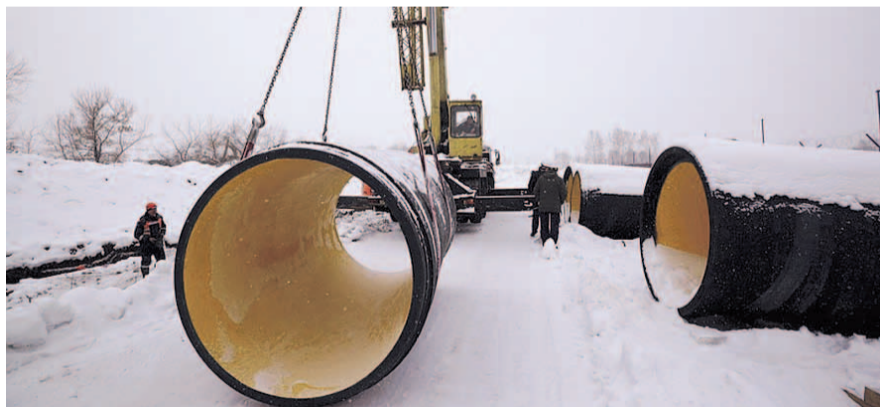
НА ФОТО: СТРОИТЕЛЬСТВО НЕ ОСТАНАВЛИВАЕТСЯ В ЛЮБУЮ ПОГОДУ

«Мы к теплу не сильно привычные, так все из Сибири. Нормально реагируют, все греются какое-то время, дальше выходим, работаем; нормально. В данном случае сейчас происходит монтаж железобетонных труб, ливневого коллектора. И, соответственно,