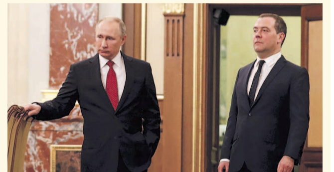
НА ФОТО: ПЕРЕД ОБЪЯВЛЕНИЕМ ОТСТАВКИ