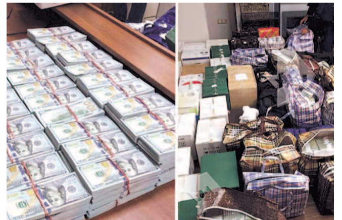
НА ФОТО: НАУЧИЛИСЬ ВОРОВАТЬ МИЛЛИОНЫ, МИЛЛИАРДЫ, ТРИЛЛИОНЫ, ОСВОЯТ И КВАДРИЛЛИОНЫ?