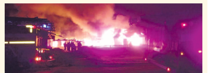
НА ФОТО: СЛУЧАЙНОСТЬ ИЛИ ЗЛОЙ УМЫСЕЛ?