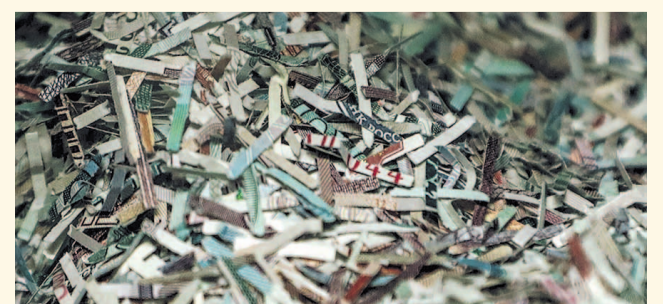
НА ФОТО: «ЛАПША» ИЗ ВЕТХИХ КУПЮР