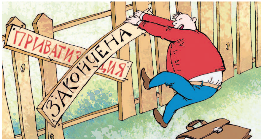
НА ФОТО: НАЛТАЙ, КОМУ НЕ ХВАТИЛО

финансовый сектор — доля государства в банке ВТБ сократится до 50%, плюс одна обыкновенная именная акция. Изменения коснутся производителей алкогольной продукции — власти продадут «Росспиртпром» (75% плюс 1 акция) и «Кизлярского коньячного завода» (до 50%). Будет приватизирована и судоходная компания «Современный коммерческий флот» — государство уступит 75% собственности.