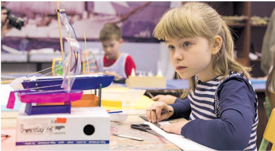
НА ФОТО: «ДРАМКРУЖОК, КРУЖОК ПО ФОТО, ХОРКРУЖОК...» — КАК ВЫБРАТЬ ЧТО-ТО ОДНО?

Но практика в соседних регионах, где уже внедрен проект, показывает, что сертификат сильно ограничен суммой и его стоимость едва покрывает один кружок. Иногда родителям и вовсе приходится доплачивать самостоятельно.