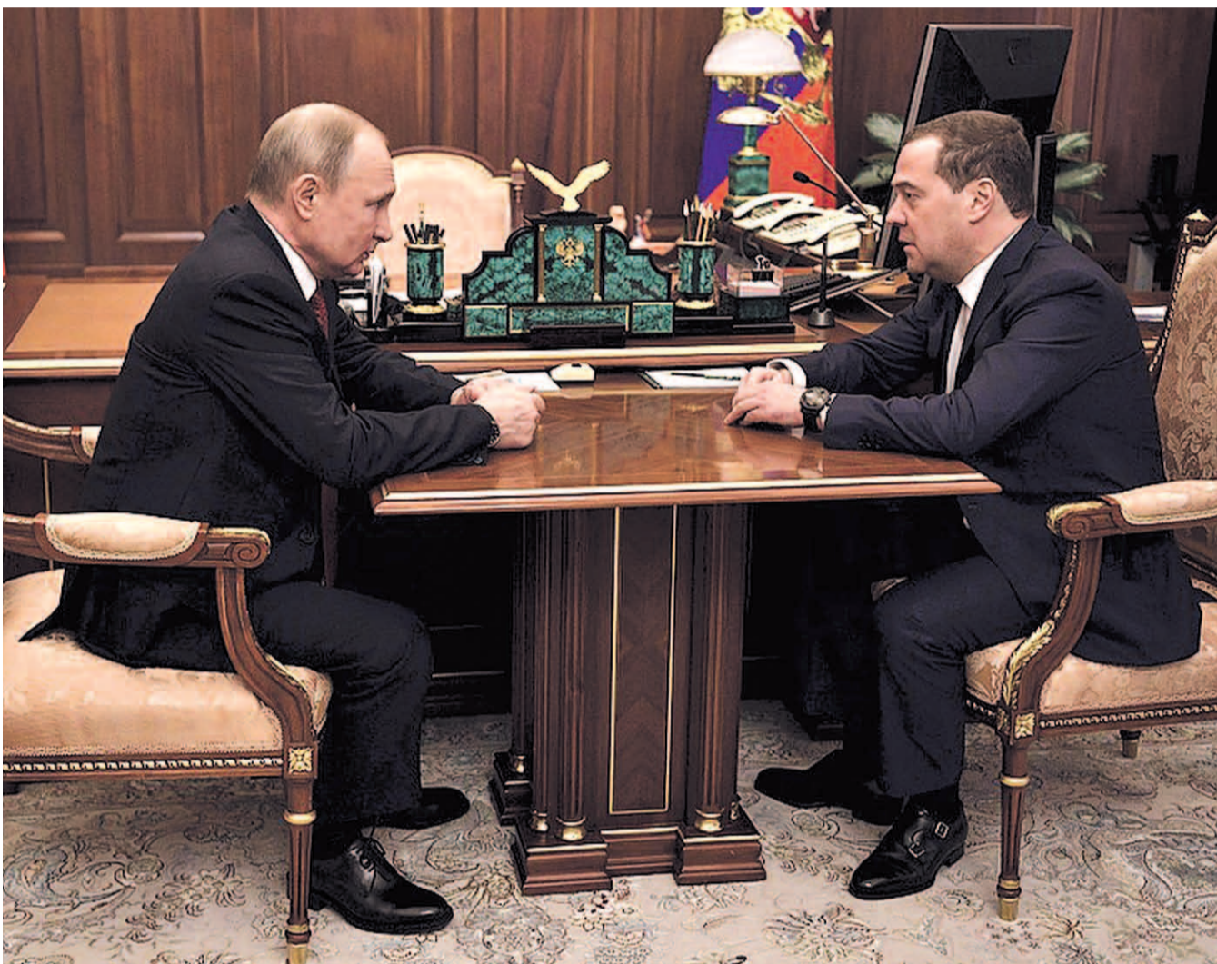
НА ФОТО: ДМИТРИЙ МЕДВЕДЕВ БОЛЬШЕ НЕ БУДЕТ ВОЗГЛАВЛЯТЬ ПРАВИТЕЛЬСТВО РОССИЙСКОЙ ФЕДЕРАЦИИ