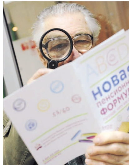
НА ФОТО: ЕСТЬ ЛИ ШАНС ПОЛУЧИТЬ ПЕНСИЮ?

— Государство после того, как население страны молча проглотило пенсионную реформу, продолжает дальше наступать на права людей. В чем суть