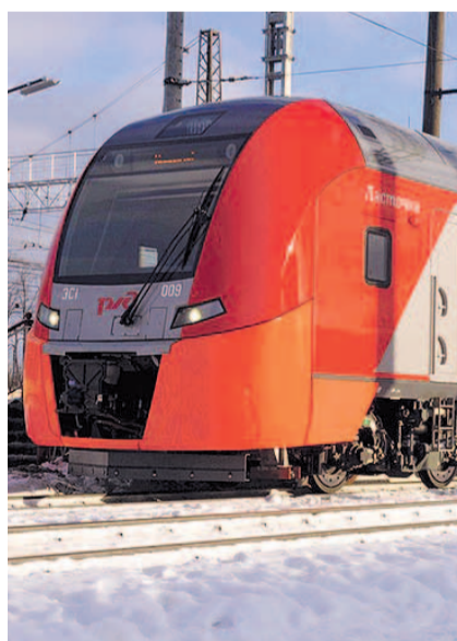
НА ФОТО: «ЛАСТОЧКИ» ЛЕТАТ В СИБИРЬ

— В этом году также планируем открыть управленческий комплекс по станции Убинская. Также в декабре прошлого года парк подвижного состава, курсирующего в Новосибирской области, пополнили два современных электропоезда серии ЭП2Д. В третьей декаде января поступит третий электропоезд, который будет работать в Новосибирске на южном направлении. Кроме этого, ждем два электро-