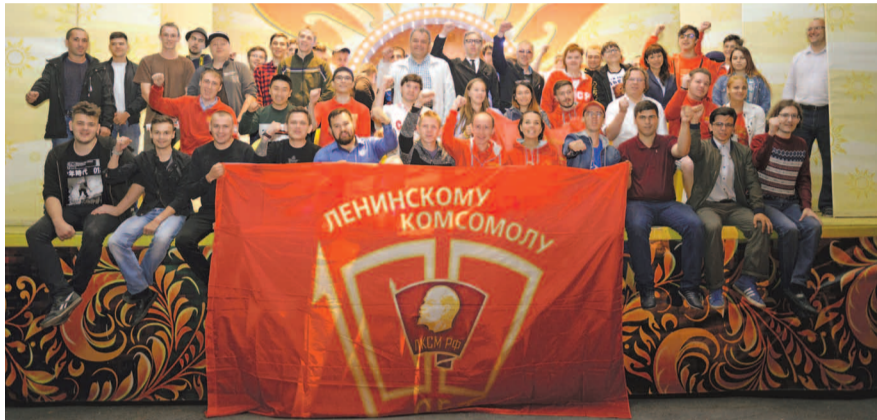
НА ФОТО: СЕГОДНЯШНИЕ КОМСОМОЛЬЦЫ ДОСТОЙНЫЕ ПРОДОЛЖАТЕЛИ ДЕЛА СВОИХ ПРЕДШЕСТВЕННИКОВ

Многие знают, что комсомол был создан 29 октября 1918 года. Но на самом деле I Всероссийский съезд, который состоялся 103 года назад в Москве, был только началом большого пути по развитию крупнейшей молодежной организации. В регионах процесс создания отделений комсомола был долгим.