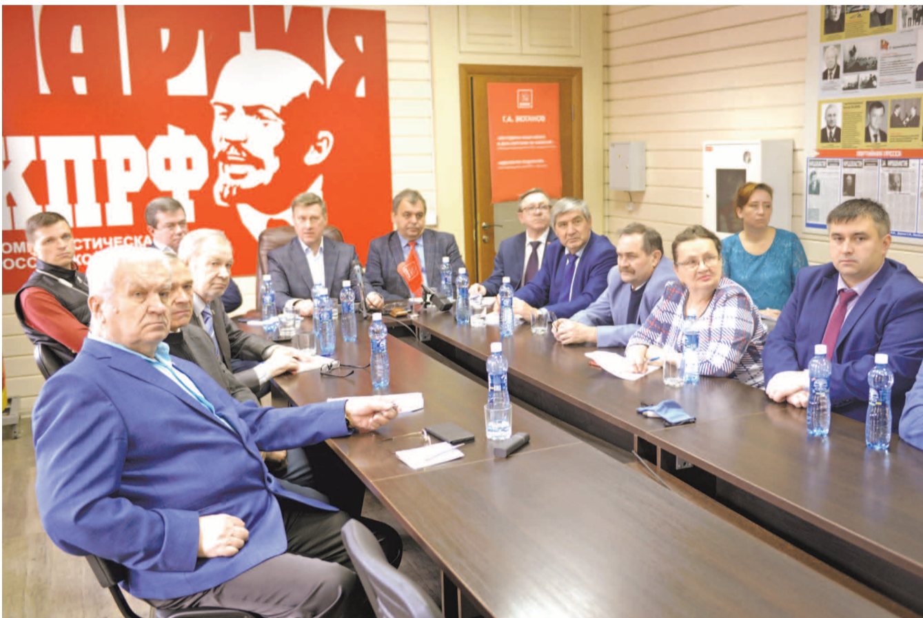
НА ФОТО: НОВОСИБИРСКИЕ КОММУНИСТЫ ПРИНИМАЮТ УЧАСТИЕ В XI ПЛЕНУМЕ ЦК КПРФ