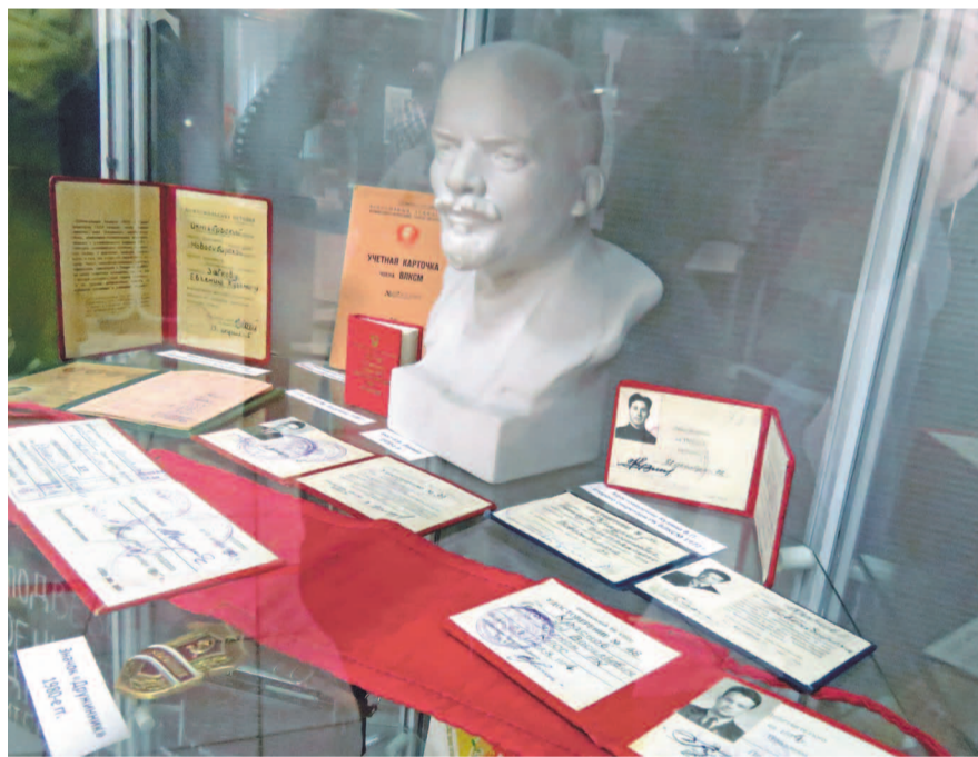
НА ФОТО: ВЫСТАВКА К 100-ЛЕТИЮ ГОРОДСКОГО КОМСОМОЛА ЖДЕТ ГОСТЕЙ

Экспозиция посвящена партийной работе и активному досугу комсомольцев Центрального района в советские годы. Это единственный районный комитет, который смог сохранить комсомольское знамя до наших лет.