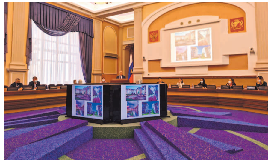
НА ФОТО: ДЕПУТАТЫ-КОММУНИСТЫ ПРЕДЛОЖИЛИ РЕШЕНИЕ ПРОБЛЕМЫ ДЕФИЦИТА ЛЕКАРСТВ

— Создается такое впечатление, что крупный бизнес намеренно форси-