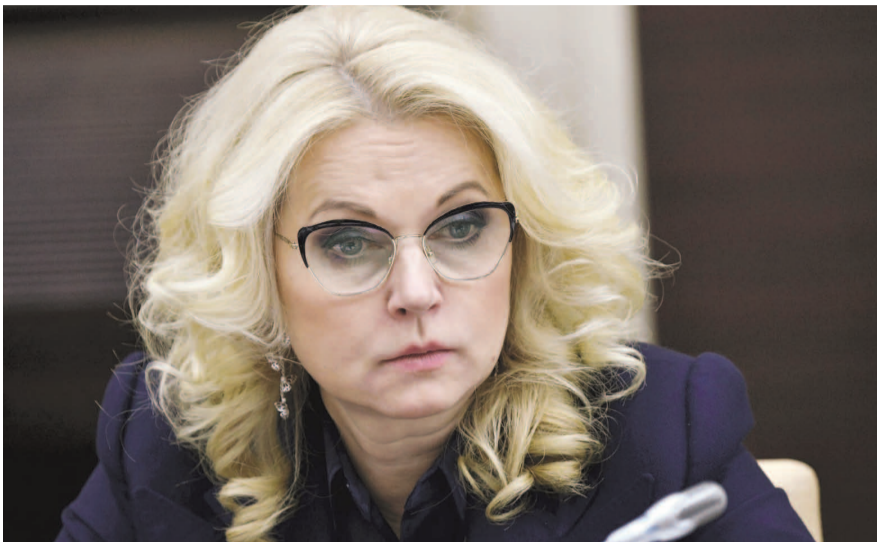
НА ФОТО: ГЛАВНЫЙ КРИТИКАН МЕДИЦИНЫ СССР ТАТЬЯНА ГОЛИКОВА

Хотя ранее руководители страны признавали заслуги советской медицины. Даже Владимир ПУТИН в мае 2020 года, проводя совещание по санитарно-эпидемиологической обстановке, с гордостью отмечал, что «Советский Союз разрушили, а созданную им систему не удалось». Но,