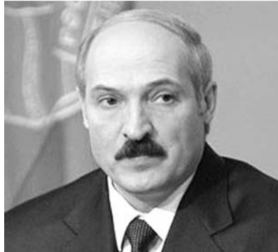
● НА ФОТО: АЛЕКСАНДР ЛУКАШЕНКО

Президент Белоруссии призывает депутата «сделать все, чтобы не допустить надлома братских уз и разрыва союзных