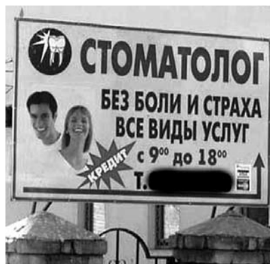
● НА ФОТО: НАМ РАДЫ, ЕСЛИ МЫ ПЛАТИМ

В запале он послал меня к «абрамычам», что находятся в руководстве города, к ЗЮГАНОВУ — он, де, репрессировал, пусть и зубы вставляет; что мое