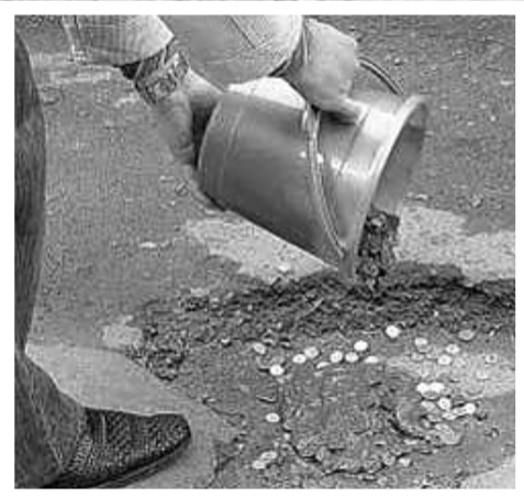
● НА ФОТО: ДЕНЬГИ В ЗЕМЛЮ — ПРИНЦИП «РАБОТЫ» ВЛАСТИ И ДОРОЖНИКОВ