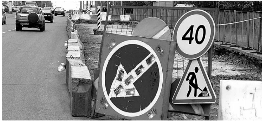
● НА ФОТО: СТРОИМ АБЫ КАК, ГЛАВНОЕ — ОСВОИТЬ ДЕНЬГИ

Когда новосибирские чиновники «освоили» первый миллиард, то в 2008 году разразился скандал. Полпред президента в Сибири генерал Анатолий КВАШНИН потребовал провести проверку качества дорог в Новосибирске. Управление «Ростехнадзор» исполнило приказ, результаты были обескураживающими. Новосибирские автомобилисты на своем ежедневном опыте могут оценить состояние городских дорог, но одно дело — наши ощущения, и совсем другое — это четкие и точные данные официальной проверки по поручению полпреда. Это был диагноз.