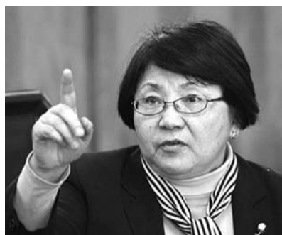
● НА ФОТО: ПРЕЗИДЕНТ ПЕРЕХОДНОГО ПЕРИОДА РОЗА ОТУНБАЕВА

участке, руку проголосовавшего помечали особым маркером, чтобы предотвратить повторное голосование, но механизм этот несовершенно, хотя данных о нарушениях в воскресенье днем не поступало, рассказал Анатолий Локоть.