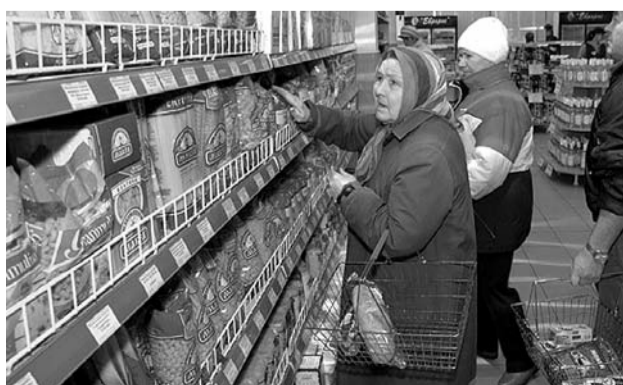
● НА ФОТО: ЦЕНЫ «КУСАЮТСЯ»

— Способы, конечно, есть, и главный из них — это развитие собственного сельского хозяйства и производства. Но, опять же, упирается все в то, что в эти сферы нужно вкладывать деньги