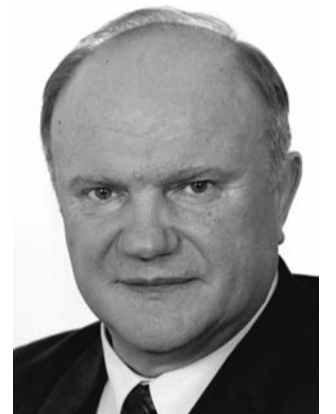
● НА ФОТО: ЛИДЕР КПРФ

В интервью агентству «Интерфакс» Председатель ЦК КПРФ Геннадий ЗЮГАНОВ сообщил, что на предстоящей встрече с президентом он намерен высказаться по трем темам.