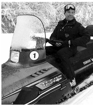
● НА ФОТО: ЕЩЕ ОДИН РАБ НА ГАЛЕРАХ

Ведь какие перспективы раскрываются с внедрением нанотехнологий! Представьте себе нанотанк или наносамолет: его вроде бы и не видно, а он есть. Хотя бы потому, что деньги-то потрачены огромные. Это очень верно, что вы поручили такое важное дело Чубайсу. Толик молодец! Ведь это он всех нас, глупых, сделал собственниками. А то бы мы все так в нищете и прозябали бы. А как он ловко с монополией расправился! Ну, с этой Единой энергетической системой — проклятым коммунистическим наследием. У многих вместо «лампочек Ильича» сразу свечки загорелись. Оно как-то даже привычнее. А какая конкуренция разгорелась на рынке продажи электричества! Многие благодарные не понимают этого. Если бы не Чубайс, может быть, пришлось бы платить за