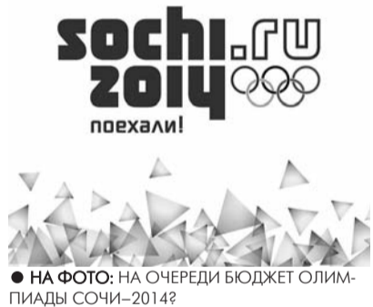
● НА ФОТО: НА ОЧЕРЕДИ БЮДЖЕТ ОЛИМПИАДЫ СОЧИ-2014?

Подготовка спортсменов по единому календарному плану неэффективна и ведет к коррупции, считает СП. Так, фирмы, насчитывающие в штате несколько человек, ежегодно получали до 3,5 млрд. руб. на финансирование подготовки спортсменов. Аудиторы нашли случаи закупки товаров по госконтракту без конкурса, причем с участием нескольких посредников, и подсчитали,