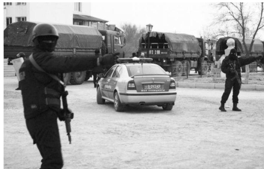
НА ФОТО: В ЖАНОЗЕН ВВЕДЕНА АРМИЯ И ОБЪЯВЛЕНО ЧРЕЗВЫЧАЙНОЕ ПОЛОЖЕНИЕ