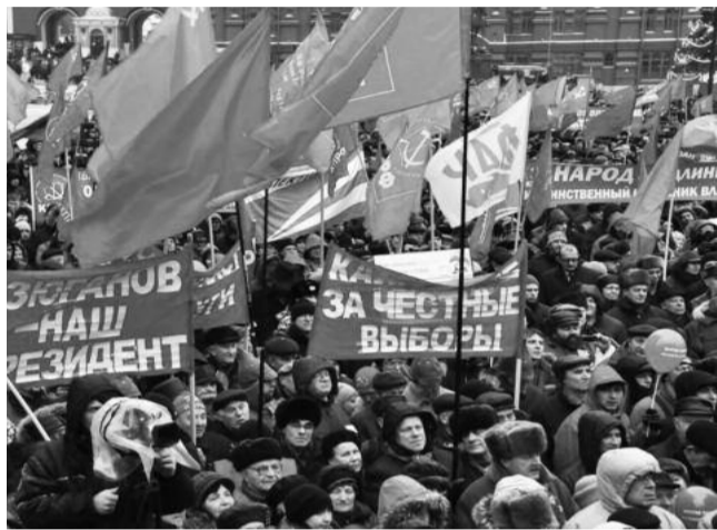
● НА ФОТО: В МИТИНГЕ ПРИНЯЛО УЧАСТИЕ ДО 20 ТЫС. ЧЕЛОВЕК

18 декабря в Москве на Манежной площади состоялась митинг протеста против фальсификации результатов выборов депутатов Государственной думы шестого созыва. Перед участниками акции выступил Председатель ЦК КПРФ Геннадий Зюганов.