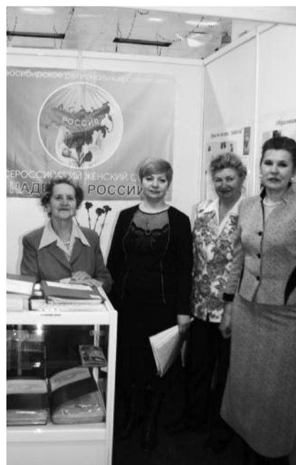
● НА ФОТО: ДЕЯТЕЛЬНОСТЬ НОВОСИБИРСКОГО ОТДЕЛЕНИЯ ВЖС УЖЕ ОТМЕЧАЛАСЬ ГРАНТОМ АДМИНИСТРАЦИИ

— Не секрет, что мы в основном ориентировались на сельские школы, т.к. они бывают обделены вниманием, не всегда могут участвовать в мероприятиях, проводимых в областном центре по понятным причинам отдаленности и как бы «второсортности». Но мы-то знаем, как творчески, нестандартно мыслят дети в сельских школах, если у них есть учителя-патриоты! Активно участвовали в конкурсе школы Баганского района, городов Бердска, Искитима.