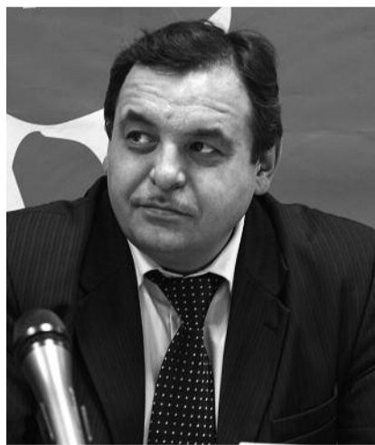
● НА ФОТО: РЕНАТ СУЛЕЙМАНОВ

Делегат Всероссийского съезда КПРФ, секретарь Новосибирского обкома КПРФ Ренат СУЛЕЙМАНОВ поделился впечатлениями о работе съезда и рассказал о его задачах.