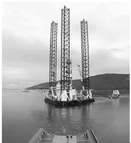
● НА ФОТО: ПЛАТФОРМА «КОЛЬСКАЯ»