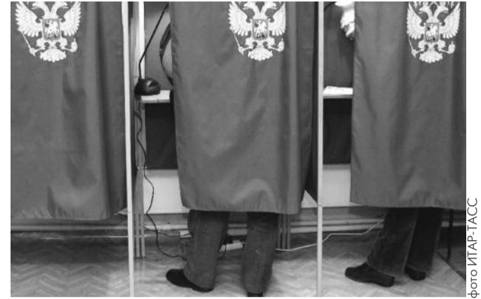
● НА ФОТО: ДО ВЫБОРОВ ПРЕЗИДЕНТА ОСТАЛОСЬ ДВА МЕСЯЦА

Если говорить о разнице предпочтений избирателей, то нельзя исключать тот факт, что в городе люди более свободны в выборе источников информации о политической ситуации, глубже ощущают ее. Более реально воспринимают программы партий. Имеют больше возможностей быть информированными не только из телевидения. Более живо ощущают всякое реформаторство на собственном кармане, и более адекватно реагируют на это. Менталитет же селян остается замкнутым «внутренним мирком». Они более зависимы и управляемы. Существуют здесь прочные основы для нужных результатов. Это, прежде всего, увещевания местного начальства, резюме зажиточных сограждан, преуспевающих латифундистов. Всякого рода кивания на методики распределения денежных субсидий, дарованных муниципалитетам сверху, — основной аргумент делать селян более покладистыми и вынуждать их довольствоваться малым. Пример. Поселок Мирный все 20 лет отдает большинство голосов только либерал-реформаторам. Но до сих пор его жители не могут добиться того, чтобы в уличном освещении у них вновь вспыхну-