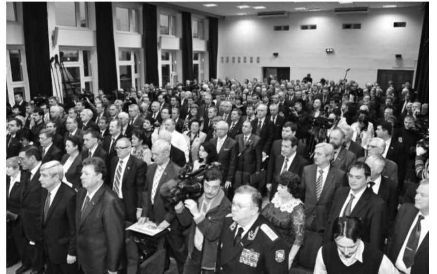
● НА ФОТО: ДЕЛЕГАТЫ СЪЕЗДА