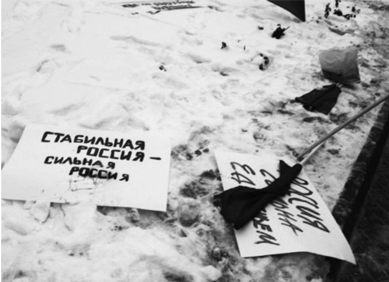
● НА ФОТО: ПОСЛЕ ОКОНЧАНИЯ МИТИНГА ЛОЗУНГИ И ПЛАКАТЫ УЧАСТНИКИ ПОБРОСАЛИ В СНЕГ