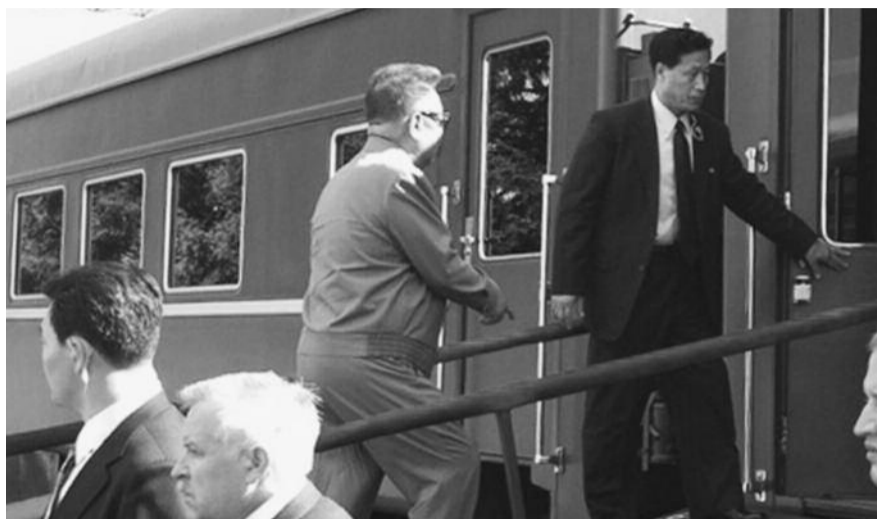
● НА ФОТО: В АВГУСТЕ ЭТОГО ГОДА КИМ ЧЕН ИР БЫЛ ПРОЕЗДОМ В НОВОСИБИРСКЕ

По данным AP, северокорейский лидер страдал от диабета и болезни сердца. Однако о здоровье он заботился не сильно — много