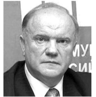
● НА ФОТО: ЛИДЕР КПРФ

Лидер КПРФ Геннадий ЗЮГАНОВ призвал российских коммунистов возглавить народные протесты против политики властей, предупредив об опасности «оранжевой революции».