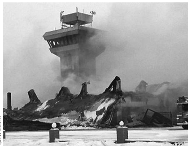
● НА ФОТО: ЗДАНИЕ АЭРОПОРТА «ЧЕРЕМШАНКА» ПРЕВРАТИЛОСЬ В ПЕПЕЛ

В Красноярске в понедельник утром сгорел аэропорт «Черемшанка», обслуживавший внутренние рейсы. По предварительным данным, пострадавших в результате ЧП нет. Само двухэтажное кирпичное здание аэровокзала вместимостью до 500 человек восстановлению не подлежит, сообщает агентство ИТАР-ТАСС со ссылкой на МЧС.