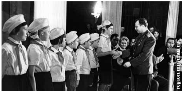
НА ФОТО: ДК ИМ. С. М. КИРОВА. ПИОНЕРЫ И ЮРИЙ ГАГАРИН, Г. МУРМАНСК. 1965 Г.

19 мая 1922 года Вторая Всероссийская конференция комсомола приняла решение о повсеместном создании пионерских отрядов. Это день впоследствии стал Днем пионерии.