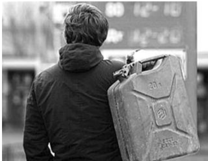
● НА ФОТО: ПОРА ДОСТАВЛЯТЬ КАНИСТРЫ?

Если верить информации эксперта, президента Союза нефтегазопромышленников Геннадия ШМАЛЯ , добрую половину из тонны нефти при переработке у нас