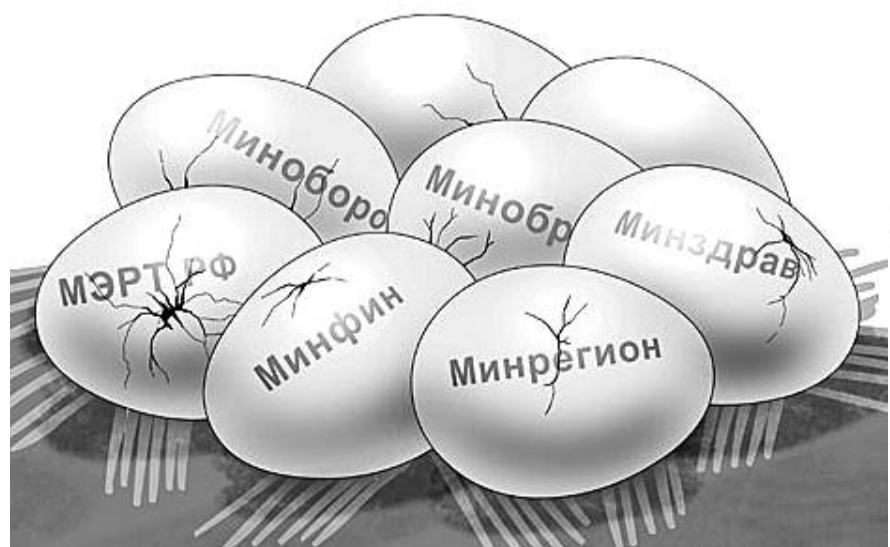
НА РИС.: ИМИДЖ «ПРАВИТЕЛЬСТВА ОБЕЩАНИЙ» ТРЕЩИТ ПО ШВАМ