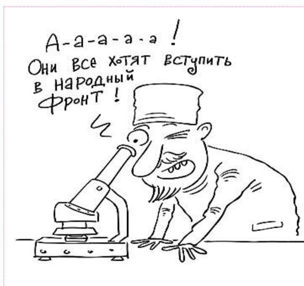
карикатура Сергея ЕЛКИНА