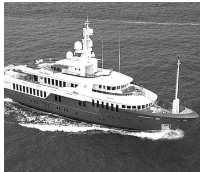
НА ФОТО: ЯХТА Д. МЕДВЕДЕВА СТОИТ ОКОЛО 40 МЛН ДОЛЛАРОВ

По свидетельству пассажиров, пока они терпели бедствие, мимо без остановки прошли три судна — танкер «Волганефть», баржа и скоростной теплоход «Метеор»