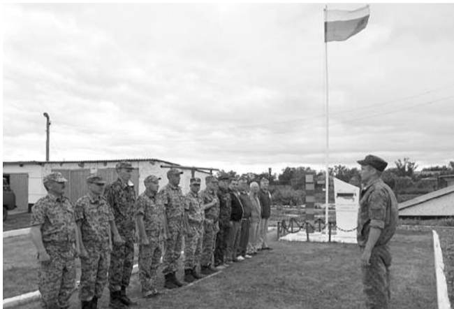
■ НА ФОТО: ГРАНИЦА НА ЗАМКЕ!