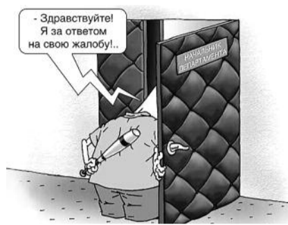
● НА РИС.: ПОСЛЕДНИЙ АРГУМЕНТ?

По каждому из трех лекарств по предварительным звонкам аптеки в течение