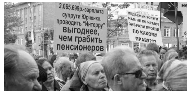
● НА ФОТО: ВОПРОСЫ ПЕНСИОНЕРОВ К ВЛАСТИ ОСТАЮТСЯ БЕЗ ОТВЕТА

На этот раз власть забаррикадировалась от пенсионеров еще основательнее — пространство перед облминистрацией было разграничено металлическими турникетами на своеобразные «загоны», вход в которые контролировали сотрудники в штатском.