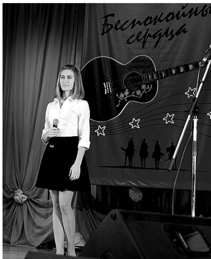
НА ФОТО: НА ФЕСТИВАЛЕ

— Комсомольская, патриотическая песня — это не эстрадная песня. Комсомол — это не «тусовка» по интернетам, это — суровая школа жизни. Комсомол — это великие стройки, это