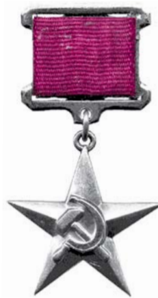
НА ФОТО: ЗВЕЗДА ГЕРОЯ ТРУДА

50. По железным дорогам было перевезено полтора миллиона вагонов эвакуированных грузов. История мирового промышленного развития не знала ничего подобного.