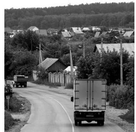
НА ФОТО: БАРЫШЕВО