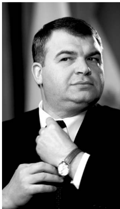
НА ФОТО: ЭКС-МИНИСТР СЕРДЮКОВ

Анатолий Сердюков будет курировать деятельность трех холдингов: Объединенная двигателестроительная корпорация (ОДК), «Технодинамика» и концерн «Радиоэлектронные технологии» (КРЭТ). Эти холдинги производят агрегаты и системы для авиационной промышленности и военно-промышленного комплекса. Три