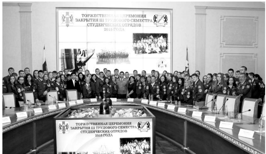
НА ФОТО: СТУДОТРЯДЫ В МАЛОМ ЗАЛЕ ПРАВИТЕЛЬСТВА НОВОСИБИРСКОЙ ОБЛАСТИ