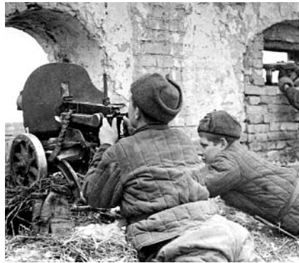
● НА ФОТО: СТАЛИНГРАДСКАЯ БИТВА — одно из крупнейших сражений войны

Соотношение сил на советско-германском фронте в этот момент, к осени 42-го года, было таким: 266 дивизий численностью, 6,2 млн. человек, свыше 70 тысяч орудий и минометов, 6 600 танков и штурмовых орудий, 3 500 боевых самолетов и 194 боевых корабля у противника; 6,1 млн. человек, 72,5 тыс. орудий и минометов, 6 014 танков, 3 088 боевых самолетов у Красной Армии. В стратегическом резерве Ставки к этому периоду накопилось 25 дивизий, 13 танковых и механизирован-