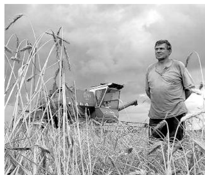
● НА ФОТО: РАБОТЫ НА СЕЛЕ НЕТ

Наш корреспондент попросил прокомментировать ситуацию с рабочими местами на селе первых секретарей районных местных отделений КПРФ в Новосибирской области.