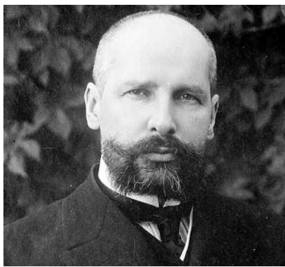
● НА ФОТО: ПЕТР СТОЛЫПИН

ный заговор и потребовал отстранить от работы в Думе 55 депутатов социал-демократической фракции, а 16 из них предать суду. II Дума была распущена, одновременно царским указом был утвержден новый избирательный закон. Это был государственный переворот. 37 депутатов — членов РСДРП были арестованы и осуждены. III Дума, избранная по новому закону, состояла в основном из представителей правящих классов. Народное представительство в Думе закончилось.