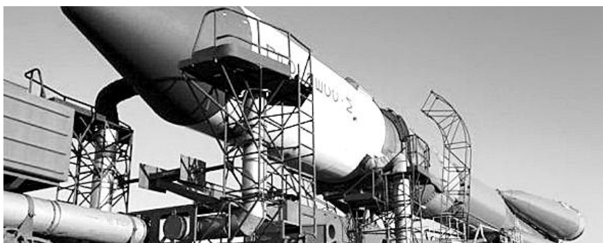
■ НА ФОТО: ОБЛОМКИ КОСМИЧЕСКОГО ГРУЗОВИКА «ПРОГРЕСС» УПАЛИ НА АЛТАЕ

■ 18 августа 2011 года не вышел на расчетную орбиту новейший телекоммуникационный спутник «Экспресс-АМ4». Аппарат был затоплен в Тихом океане в марте 2012 года.