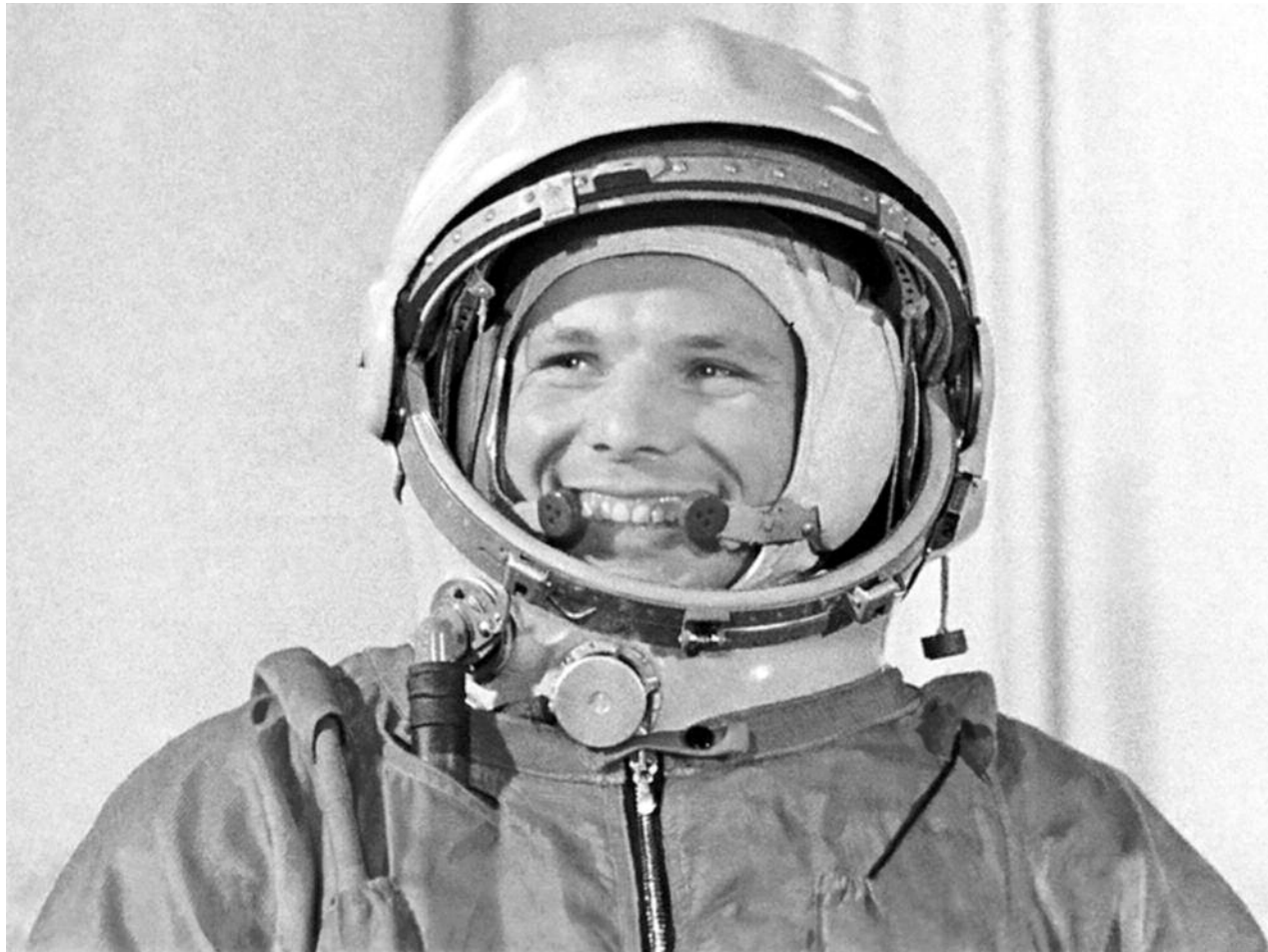
● НА ФОТО: 12 АПРЕЛЯ 1961 ГОДА В КОСМОС ПОЛЕТЕЛ ПЕРВЫЙ В МИРЕ КОСМОНАВТ — КОММУНИСТ ЮРИЙ ГАГАРИН