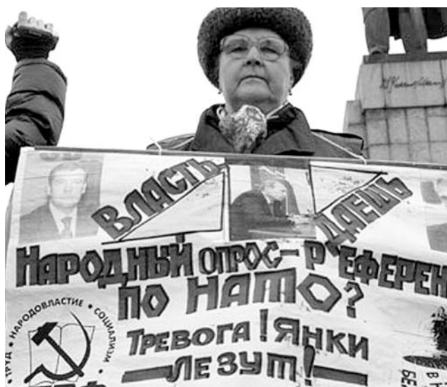
● НА ФОТО: УЛЬЯНОВСКИЕ КОММУНИСТЫ ГОЛОДАЛИ ПРОТИВ НАТО

Департамент информации и печати МИД РФ в очередной раз выступил с заявлением, что «ряд политических сил вбрасывают в