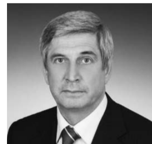
НА ФОТО: И.И. МЕЛЬНИКОВ

В КПРФ не признают результаты выборов в Верховную Раду Украины, заявил первый заместитель Председателя ЦК КПРФ, первый вице-спикер Госдумы Иван МЕЛЬНИКОВ