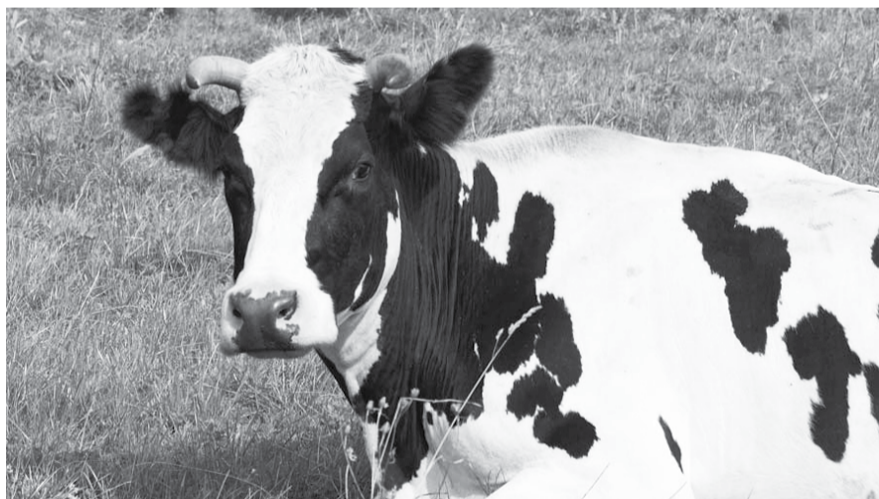
НА ФОТО: КОРОВЬЕ БЕШЕНСТВО СМЕРТЕЛЬНО ОПАСНО ДЛЯ ЧЕЛОВЕКА

Коровье бешенство — болезнь, приводящая к необратимым, летальным изменениям в головном мозге зараженных животных. Инкубационный период от 30 месяцев до 8 лет. Передается при употреблении в пищу мяса больных животных, вызывает скрепи у овец и болезнь Крейцфельда-Якоба у людей. Впервые было зафиксировано в Великобритании в 1986 году, изучение началось в 1970-х. Считается, что эпизодия была вызвана скармливанием скоту мясо-костной муки, изготовленной из останков «инфицированных» животных, в частности, овец. Было выявлено более двух сотен смертей людей (на февраль 2009) от нового варианта болезни Крейцфельда-Якоба.