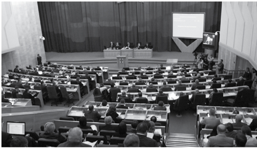
НА ФОТО: СЕССИЯ ЗАКСОБРАНИЯ НОВОСИБИРСКОЙ ОБЛАСТИ