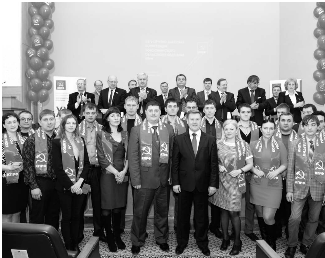
НА ФОТО: НА КОНФЕРЕНЦИИ БЫЛИ ВРУЧЕНЫ ПАРТБИЛЕТЫ БОЛЕЕ, ЧЕМ 40 КОММУНИСТАМ