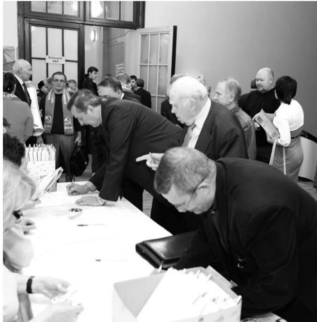
НА ФОТО: ИДЕТ РЕГИСТРАЦИЯ УЧАСТНИКОВ КОНФЕРЕНЦИИ