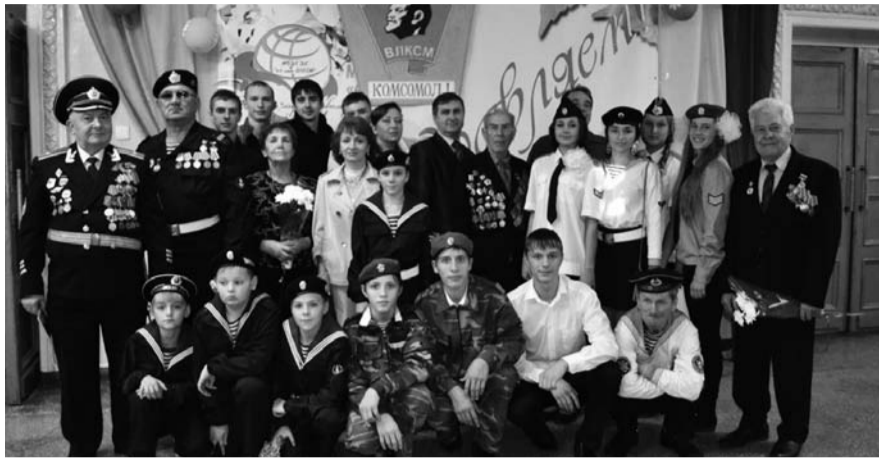
НА ФОТО: КОМСОМОЛЬЦЫ РАЗНЫХ ПОКОЛЕНИЙ СОБРАЛИСЬ ВМЕСТЕ

Уже в фойе чувствовались праздничная атмосфера и торжественный настрой участников мероприятия. Юноши и девушки в военной форме встречали гостей, отвечали на вопросы и сопровождали до места тех, кому это было необходимо. Зал украшен красными лентами, воздушными шарами и баннером с поздравлением. Многие пришли со своими комсомольскими билетами и значками, фотографиями комсомольской юности, делились вос-