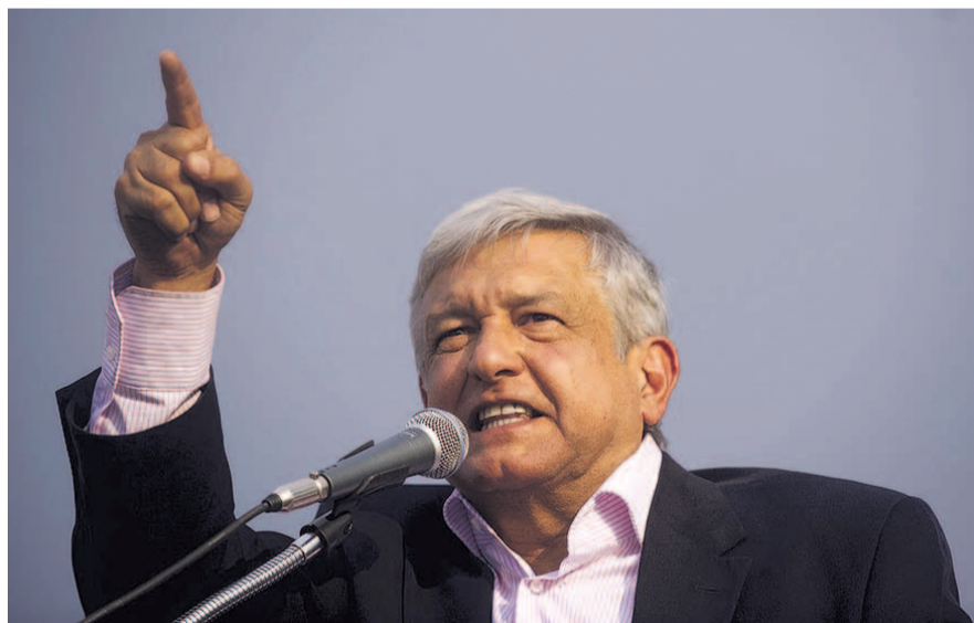
НА ФОТО: БОРЬБА С КОРРУПЦИЕЙ И БЕДНОСТЬЮ — ОСНОВА ПОЛИТИКИ НОВОГО ЛИДЕРА

Среди его предвыборных предложений — объявить амнистию участникам