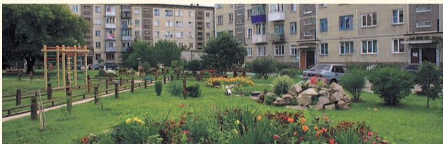
НА ФОТО: ГРЯДЕТ КОМПЛЕКСНОЕ БЛАГОУСТРОЙСТВО ДВОРОВ