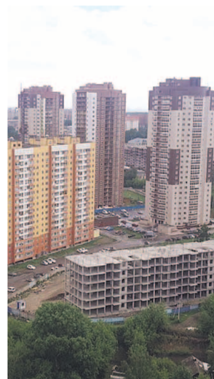
НА ФОТО: ДОЛГОСТРОЙ «ЗАКАМЕНСКИЙ»

— Сразу скажу: то, что предлагает Правительство, не вызывает у людей