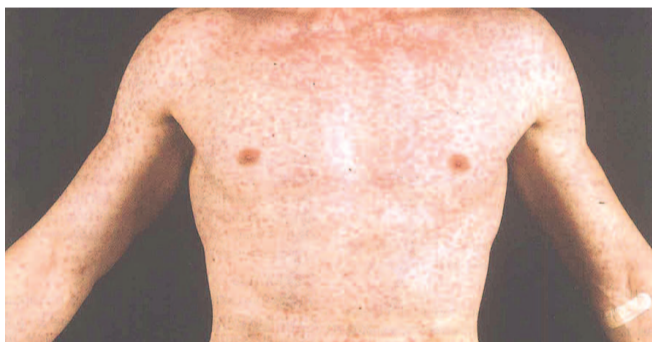
НА ФОТО: ТЯЖЕЛЫЙ СЛУЧАЙ ЗАБОЛЕВАНИЯ

Болезнь, считающаяся после массовой вакцинации в 1967 году побежденной, неожиданно проявила себя в Оби и Толмачево.