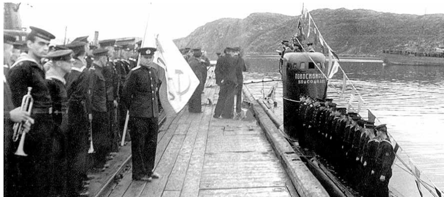
НА ФОТО: СПУСК НА ВОДУ «НОВОСИБИРСКОГО КОМСОМОЛЬЦА»

В годы Великой Отечественной войны связь между сибиряками и моряками укрепились еще больше. Трудящиеся шефствовали над боевыми кораблями и частями Военно-Морского флота.