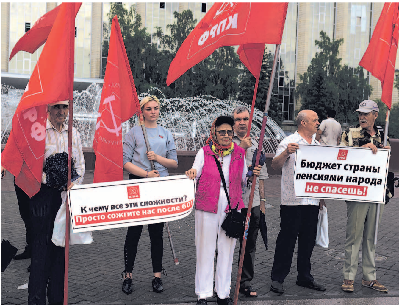
НА ФОТО: ЧЛЕНЫ КПРФ ПРИНИМАЮТ АКТИВНОЕ УЧАСТИЕ В АКЦИЯХ ПРОТЕСТА