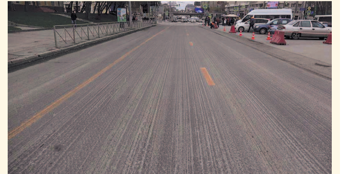
НА ФОТО: НОВЫЙ АСФАЛЬТ КЛАДУТ В НОВОСИБИРСКЕ

3 июня Новосибирск посетил министр транспорта Евгений ДИТРИХ . Одна из целей визита — проконтролировать реализацию программы «Безопасные и качественные дороги».