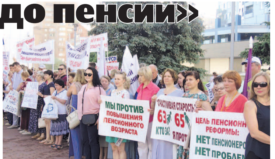
НА ФОТО: МНОЖЕСТВО ГОРОЖАН ГОТОВЫ БОРОТЬСЯ ЗА СВОИ ПРАВА

— Позиция фракции КПРФ однозначна. Мы приняли решение о поддержке резолюции Федерации профсоюзов Новосибирской области. У нас в Новосибирской области, как и во всей стране, будут продолжаться пикеты, митинги. Надо показать организованность масс, борьбу и протест, чтобы не допустить принятия закона. Вариант пенсионной реформы, внесенный Правительством, неприемлем.