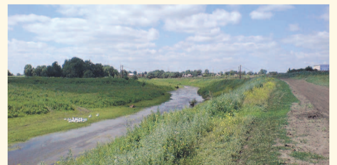
НА ФОТО: КОЧКОВСКИЙ «ГАЙД-ПАРК»