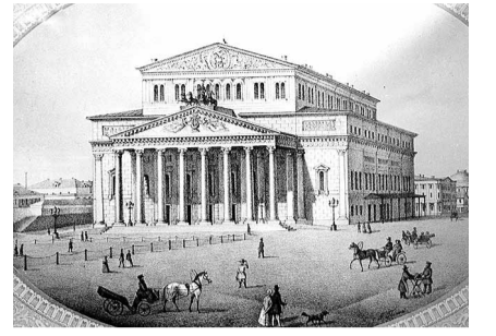
НА ФОТО: БОЛЬШОЙ ТЕАТР

Здание Большого театра внутри не менее великолепно, чем снаружи. Пятизвездный зрительный зал, большая