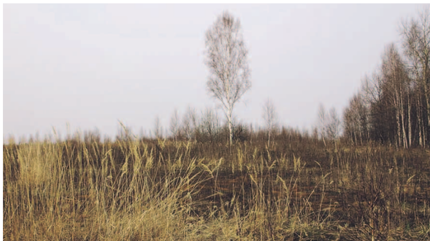
НА ФОТО: МОЖНО БЫЛО БЫ ВЫРАЩИВАТЬ ЛЕСА, НО... НЕЛЬЗЯ!