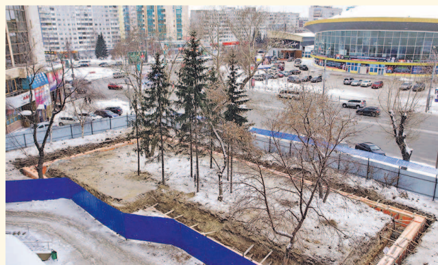
НА ФОТО: ЗАБОР ЗДЕСЬ УБЕРУТ И РАЗОБЬЮТ СКВЕР