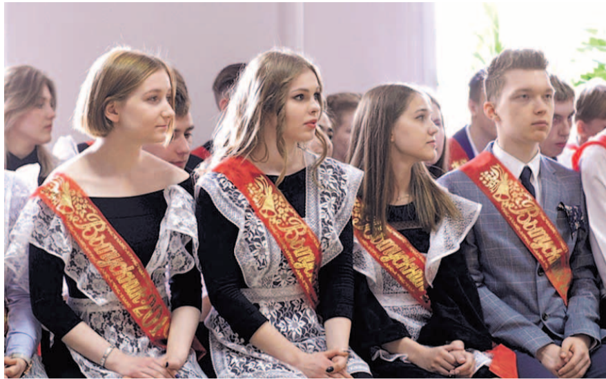
НА ФОТО: РЕБЯТА СТОЯТ НА ПОРОГЕ БОЛЬШОЙ САМОСТОЯТЕЛЬНОЙ ЖИЗНИ

Следующая школа, в которой побывал мэр, находится в Центральном рай-