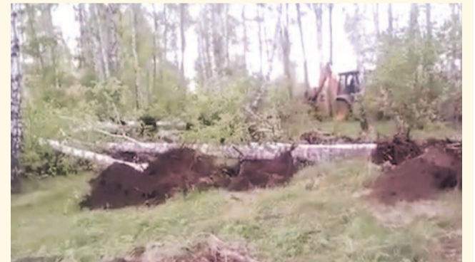
НА ФОТО: ЛЕС «ХОЗЯЕВАМ» НЕ НУЖЕН