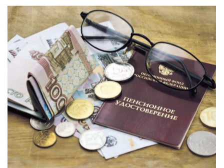
НА ФОТО: КТО ДОСТОИН ПРИБАВКИ К ПЕНСИИ?

В этой связи хотела бы поделиться своими впечатлениями и настроением после посещения майской сессии депутатов Куйбышевского района. В повестке рассматривался вопрос о принятии положения о доплатах к пенсиям председателя Совета депутатов Куйбышевского района, Главе Куйбышевского района. Ежемесячную доплату установили в зависимости от продолжительности периодов замещения муниципальных должностей — от 4 до 9 лет — 55%, а от 14 до 19 — уже 95%.