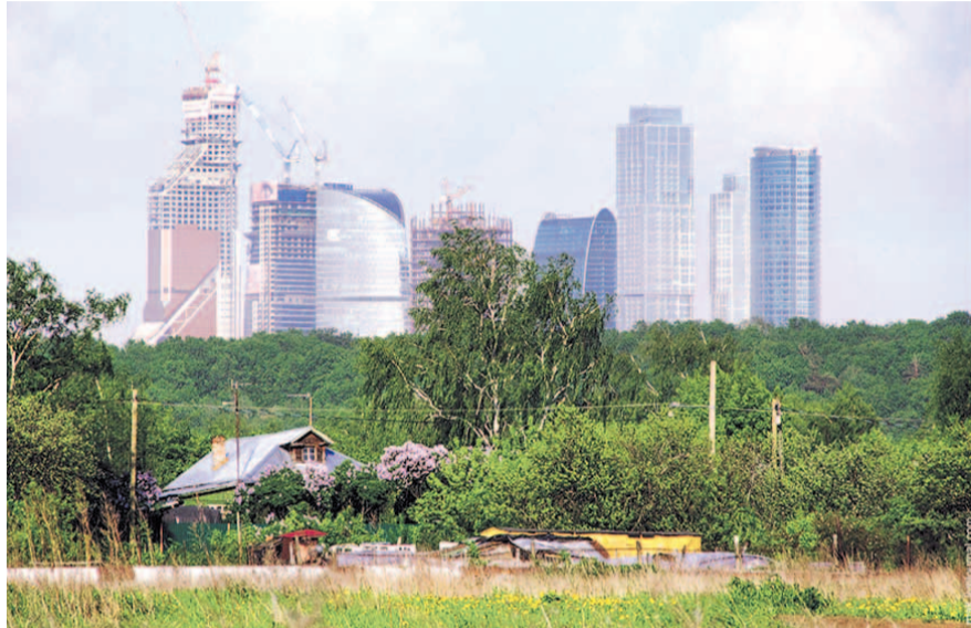
НА ФОТО: МОСКВА И РОССИЯ

Чтобы изменить эту ситуацию в положительную сторону, нужно, как ми-