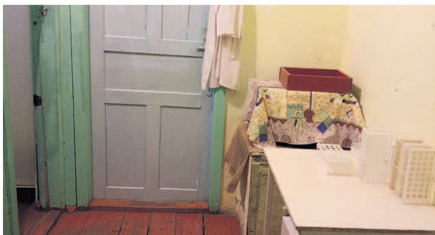
НА ФОТО: БОЛЬНИЧНЫЙ ИНТЕРЬЕР