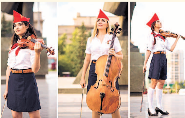
НА ФОТО: ГРУППА SILENZIUM