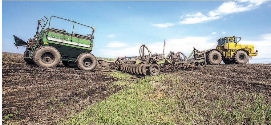
НА ФОТО: ПОСЕВНАЯ В РАЗГАРЕ

О том, что работы идут по плану, уже засеяна половина запланированных площадей, отчитались и в Кочковском