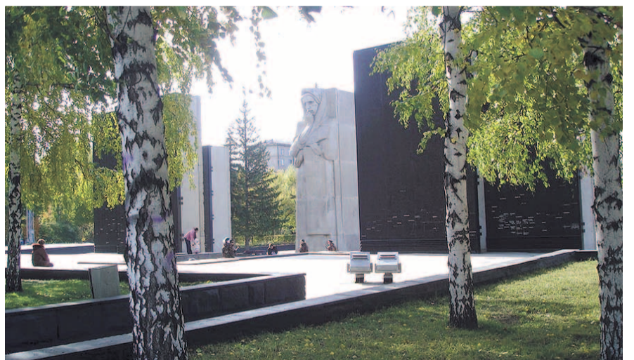
НА ФОТО: МОНУМЕНТ БУДЕТ ОБНОВЛЕН

мобильных новосибирцах. Для них на основной аллее будет проложены тактильная плитка и сделаны мнемосхемы. Помимо этого, будут сделаны пандусы и скаты там, где есть перепады по высотам дорожек, а старые пандусы реконструируют в соответствии с современными требованиями.