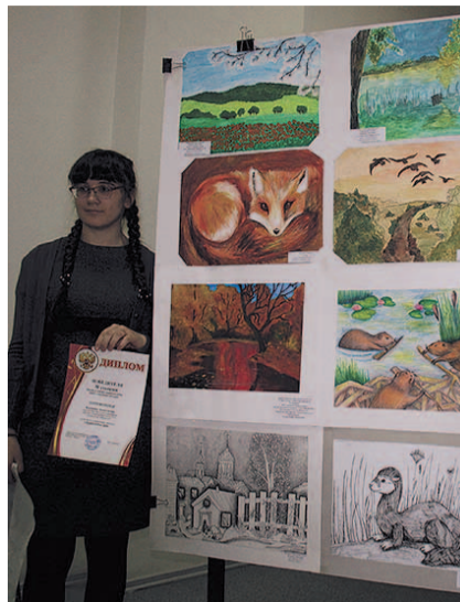
НА ФОТО: ВЫСТАВКА КОНКУРСНЫХ РАБОТ

Она добавила, что важнейшей задачей российского образования является воспитание гражданина, патриота, а одно из проявлений патриотизма — это любовь к родному краю, его природе.