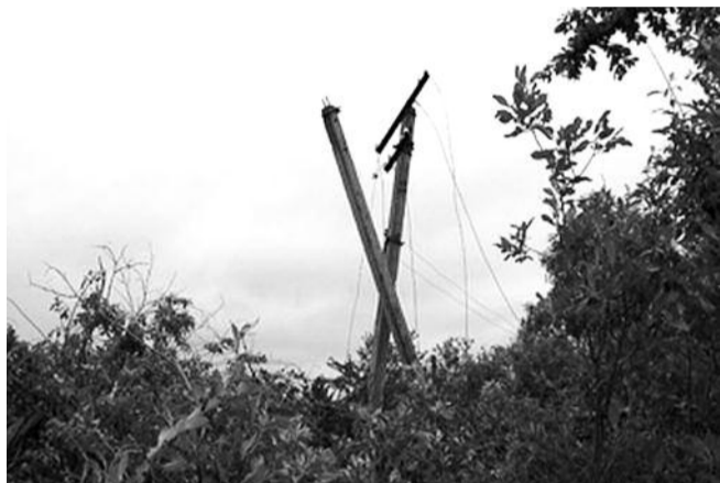
■ НА ФОТО: ПОРЫВЫ ВЕТРА ДОСТИГАЛИ 29 М/С