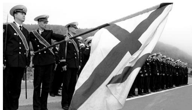
● НА ФОТО: ТРАУРНЫЕ МЕРОПРИЯТИЯ СОСТОЯЛИСЬ ВО ВСЕХ ГАРНИЗОНАХ

Родственники погибших моряков, принимавшие участие в церемонии, спустили на воду венки с фамилиями всех членов экипажа, погибших на борту АПЛ «Курск», и предали морским волнам землю, привезенную из городов, в которых были похоронены члены экипажа «Курска».