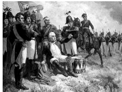
● НА ФОТО: КУТУЗОВ ВО ВРЕМЯ БОРОДИНО (КАРИКАТУРА АНАТОЛИЯ ШЕПЕЛЮКА)

Вторжение иноземных захватчиков вызвало патриотический подъем среди различных слоев русского и других народов России. Война против наполеоновского нашествия стала войной Отечественной. Формировалось народное ополчение. Развернулось партизанское движение.