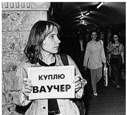
● НА ФОТО: ВЕЛИКОЕ НАДУВАТЕЛЬСТВО

ваучер в российские предприятия и стали их мелкими акционерами. Им повезло больше всего, особенно тем, кто вложил свои средства в «Газпром». Порядка 11% населения ваучеры предпочли подарить, а еще 6% и вовсе не помнят, что произошло с их «ценными» бумагами.