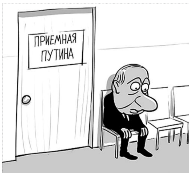
карикатура Сергея ЕЛКИНА / ROUT.RU