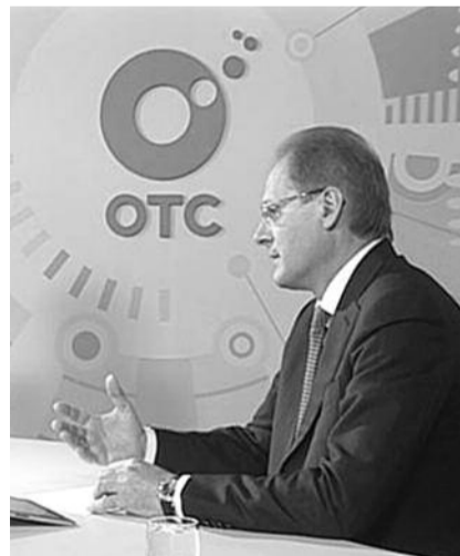
● НА ФОТО: ГЛАВНЫЙ ГЕРОЙ ЭФИРА ОТС

Рабочая группа по контролю за соблюдением закона о равном доступе к СМИ политических партий, представленных в парламенте Новосибирской области, собирается раз в месяц. В нее входят члены