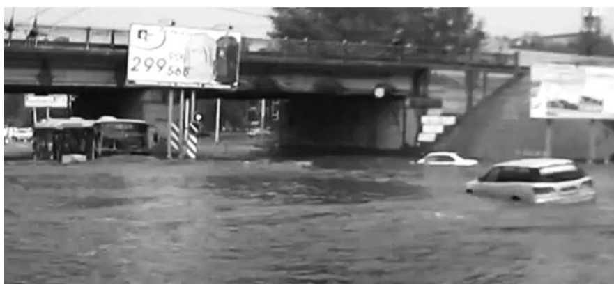
● НА ФОТО: ПО СЛОВАМ ВИЦЕ-МЭРА, ЛИВНЕВЫЕ СТОКИ В «УДОВЛЕТВОРИТЕЛЬНОМ СОСТОЯНИИ»

Читатели предположили, что в МЧС ожидали более серьезных последствий от ливня. В отделе информации и связям с общественностью МЧС по Новосибирской области подтвердили, что действительно, такие ролики были размещены в метрополитене два дня назад, размещение осуществлялось непосредственно из Москвы.