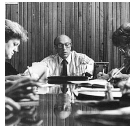
● НА ФОТО: НА СОВЕЩАНИИ