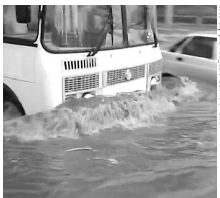
● НА ФОТО: В МЧС ЗАЯВИЛИ, ЧТО ПОДТОПЛЕНИЕ НЕ ЯВЛЯЕТСЯ ЧП

Читатели КПрФНск сообщили, что за день перед ливнем в новосибирском метрополитене транслировались ролики о том, как нужно себя вести во время потопы.