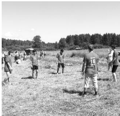
● НА ФОТО: МЕСТО ПРОВЕДЕНИЯ ПРЕДСТАВЛЯЕТ СОБОЙ БОЛЬШУЮ УХОЖЕННУЮ ПОЛЯНУ

— Районные отделения должны будут взять с собой все атрибуты многодневного отдыха на свежем воздухе — такие, как средства для разжигания костра, средства личной гигиены, аптечки и медикаменты. Сотовый телефон зарядить лучше непосредственно перед поездкой.