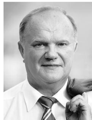
НА ФОТО: ЛИДЕР КПРФ

В Лондоне 12 августа завершилась Олимпиада. На прошедших Играх россияне завоевали 82 медали: 24 золотых, 25 серебряных и 33 бронзовых. Наши спортсмены заняли четвертое место в общекомандном зачете. С большим отрывом по количеству золотых медалей от нас оторвались американцы, китайцы и британцы, занявшие первые три общекомандных места. Итоги прошедшей Олимпиады прокомментировал Председатель ЦК КПРФ Геннадий ЗЮГАНОВ .