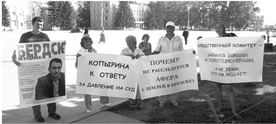
● НА ФОТО: ПИКЕТ ИНИЦИАТИВНОЙ ГРУППЫ ГРАЖДАН В БЕРДСКЕ