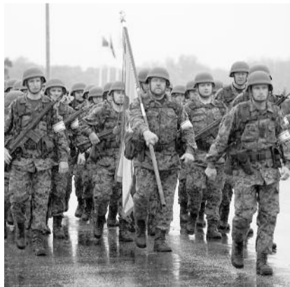
● НА ФОТО: ХОЛОДНО, ЗАТО ОТ ЮДАШКИНА

Таким образом, вопрос относительно формы остается пока открытым. Более того, наблюдатели не исключают, что «легенду» про некачественную форму от известного дизайнера в Минобороны придумали на случай — там устали от бесконечных