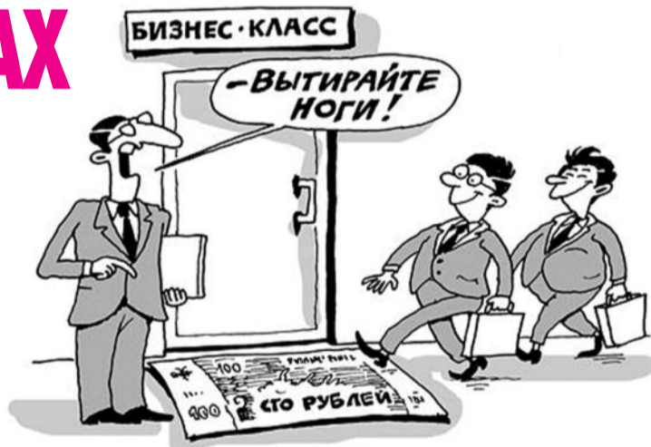
● НА РИС.: КОМУ-ТО СТИПЕНДИЯ — НОГИ ВЫТЕРЕТЬ, А КТО-ТО НА НЕЕ ЖИВЕТ

На сегодняшний день средняя стипендия студента составляет от 1 000 до 1 500 рублей в месяц. В разных вузах существуют также надбавки к стипендии малообеспеченным студентам или тем, кто ведет активную общественную жизнь и хорошо учится. Однако даже это не позволяет студентам посвящать достаточное время учебе. Активист СКМ Надежда ЕМШАНОВА , которая долгое время совмещает учебу в вузе и работу, убеждена, что получить полноценное образование в таких условиях практически невозможно: