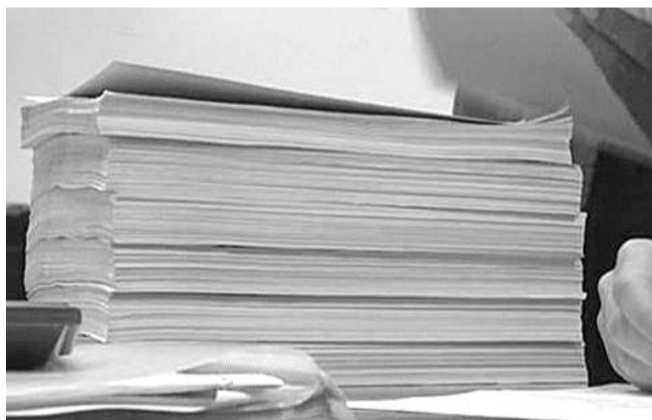
■ НА ФОТО: РЕГИСТРАЦИОННЫЕ ДОКУМЕНТЫ КАНДИДАТОВ КПРФ В ОБЩЕЙ СЛОЖНОСТИ ПРЕДСТАВЛЯЮТ СОБОЙ ВНУШИТЕЛЬНУЮ МАССУ

Завершился ключевой этап избирательной кампании, которая завершится 13 марта, — кандидаты в депутаты и на пост глав администраций сдали документы в избирательные комиссии. Некоторые кандидаты-коммунисты уже зарегистрированы.