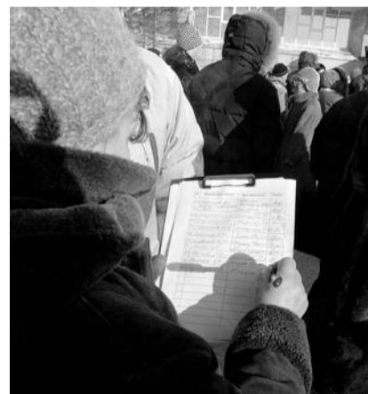
● НА ФОТО: ГУБЕРНАТОРУ — ОТ МЕНЯ!

В октябре 1995 года в России был принят Федеральный конституционный закон «О референдуме Российской Федерации», в котором установлено, что инициатива по проведению референдума принадлежит не менее чем 2 млн. граждан с охватом многих субъектов федерации; на основании этой инициативы Президент с согласия Конституционного Суда РФ назначает дату референдума.