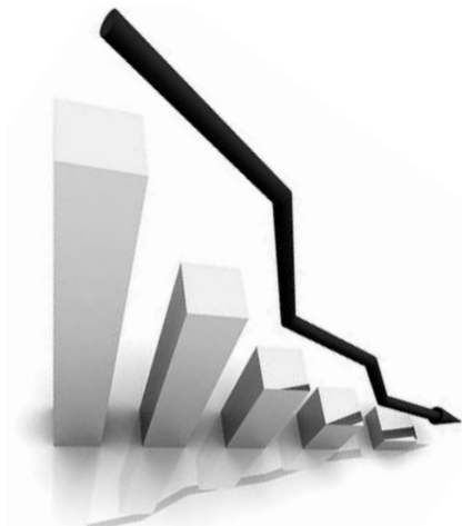
● НА РИС.: ВНИЗ ПО НАКЛОННОЙ...

Рейтинг партии власти получил еще более серьезную пробоину. Если бы выборы состоялись в ближайшее воскресенье, партия власти получила бы 57%,