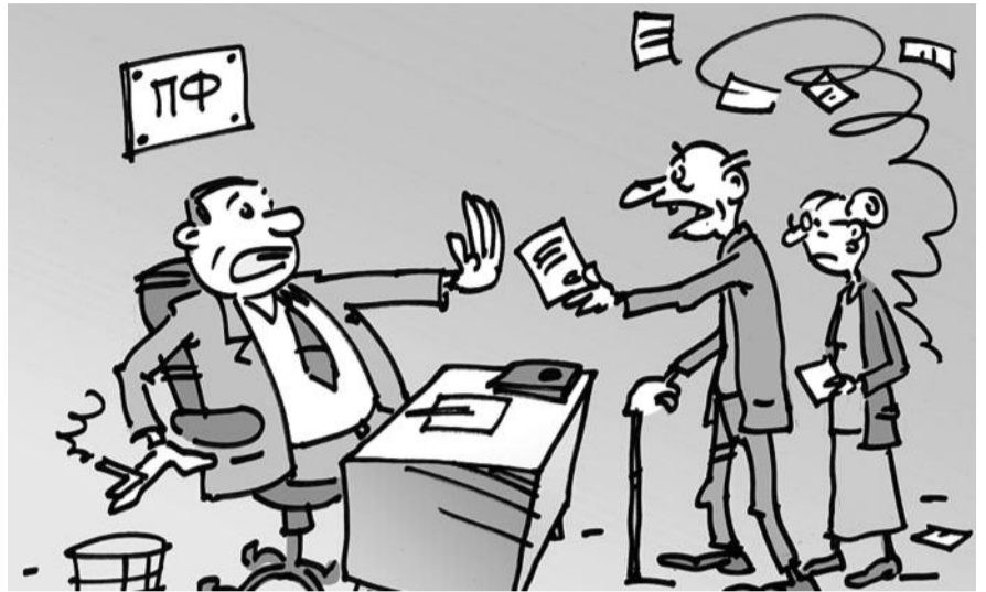
■ НА РИС.: ПОПРОБУЙ — ДОКАЖИ, ЧТО ЗАРАБОТАЛ

Но, как известно, все тайное когда-нибудь все равно становится явным. В