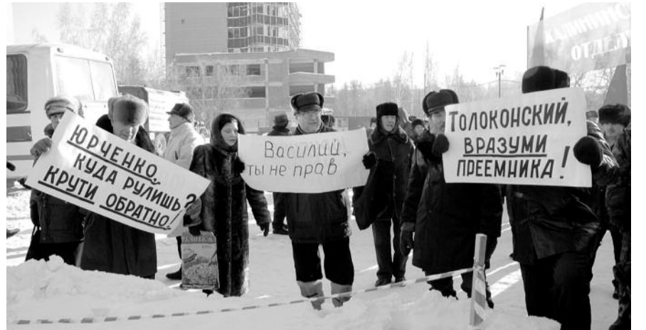
● НА ФОТО: НА ДЕЛЕ ЗА НАРОД — ТОЛЬКО КОММУНИСТЫ (НА МИТИНГЕ 21 ЯНВАРЯ У ГПНТБ)

Достоин сожаления, что наш новоиспеченный губернатор прославил себя тем, что захлопнул последнее окошко радости жизни для тех, чьими руками создавалась слава и мощь нашего государства. Правда, учитывая неудачную попытку пятилетней давности, он оставил старикам 30 поездок, которых многим не хватало даже на 5-7 дней.