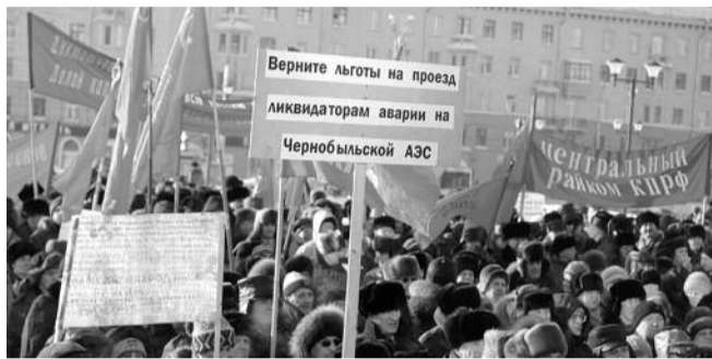
● НА ФОТО: НА ОБЩЕОБЛАСТНОМ МИТИНГЕ 21 ЯНВАРЯ У ГИПТБ

В понедельник, 31 января состоялось очередное заседание Бюро Новосибирского обкома КПРФ, на котором были подведены итоги общеобластного митинга протеста против сокращения количества льготных поездок на транспорте и намечен план дальнейшей работы по этой проблеме. Кроме того, коммунисты обсудили ход избирательной кампании по выборам депутатов и глав городов Новосибирской области.