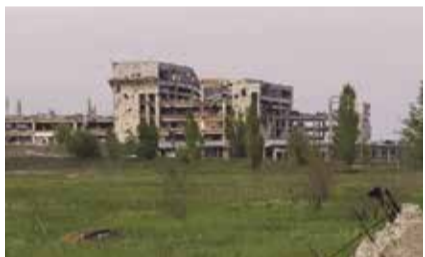
НА ФОТО: СИМВОЛ НЕПОКОРЕННОГО ДОНЕЦКА — ДОНЕЦКИЙ МЕЖДУНАРОДНЫЙ АЭРОПОРТ

Линия фронта пролегает в шести-семи километрах от центра Донецка. Постоянно слышны канонады. Коммунисты посетили