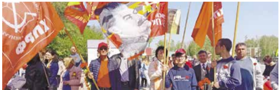
НА ФОТО: КРАСНОЗЕРСКИЙ АКТИВ КПРФ