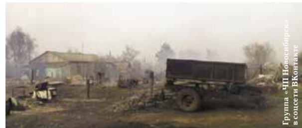
НА ФОТО: ОГОНЬ УНИЧТОЖИЛ 8 ЖИЛЫХ ДОМОВ

В деревне Суздалке Доволенского района в конце апреля произошел крупный пожар. Сгорели несколько домов.