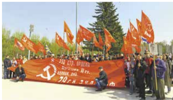
НА ФОТО: НОВОСИБИРСКИЕ КОММУНИСТЫ НА МОНУМЕНТЕ СЛАВЫ

— В рядах Красной армии воины-сибиряки защищали Москву, защищали Сталинград, бились на Курской дуге, освобождали Украину, форсировали Днепр, брали Кенигсберг и Берлин. Но не только на полях сражений прославили себя сибиряки — здесь, в Новосибирске, ковалось оружие Победы, сюда были эвакуированы музейные ценности из Харькова, Киева, Сум, знаменитая панорама «Оборона Севастополя» проходила первую реставрацию в Оперном театре. Все это потом в целостности и сохранности было возвращено на Украину.