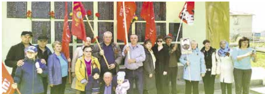
НА ФОТО: КОММУНИСТЫ КУЙБЫШЕВА

В Краснозерском районе помнят, что первая группа жителей района отправилась на фронт 25 июня 1941 года, всего же из 12 тысяч мобилизованных краснозерцев вернулось домой только 7300 человек. Краснозерцы сражались храбро, краеведы находили своих земляков на всех фронтах, каждый третий за время войны был награжден орденами и медалями, пять уроженцев района стали Героями Советского Союза, один — полным кавалером Ордена Славы. В это же время в тылу собрали почти 5 миллионов рублей в фонд Красной армии, отправили бойцам более 1000 пар валенок и полушубков. Сейчас, по данным администрации, в районе остался только один участник Великой Отечественной войны, но дети и внуки