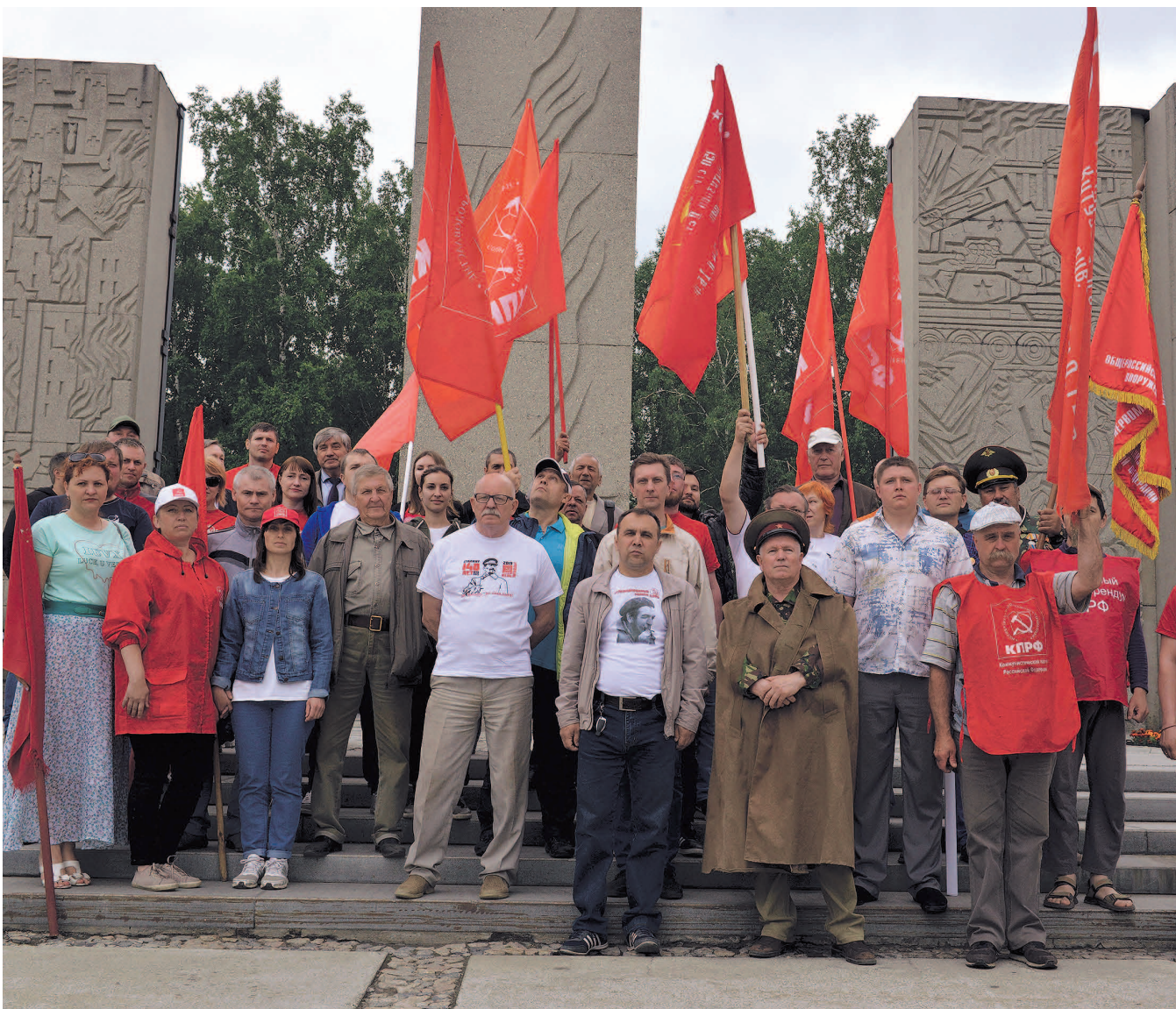
НА ФОТО: АВТОПРОБЕГ КПРФ ФИНИШИРОВАЛ 23 ИЮНЯ НА МОНУМЕНТЕ СЛАВЫ В НОВОСИБИРСКЕ