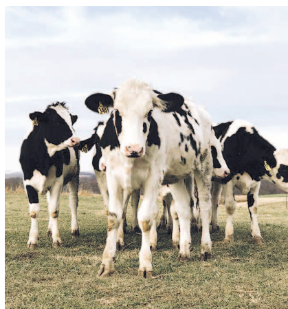
НА ФОТО: ДЛЯ ПОЛУЧЕНИЯ ЗДОРОВОГО СТАДА ТРЕБУЕТСЯ 5-7 ЛЕТ

— Единственным способом оздоровления хозяйства от лейкоза является полная замена инфицированных животных. Для этого хозяйствующему субъекту необходимо вырастить здоро-