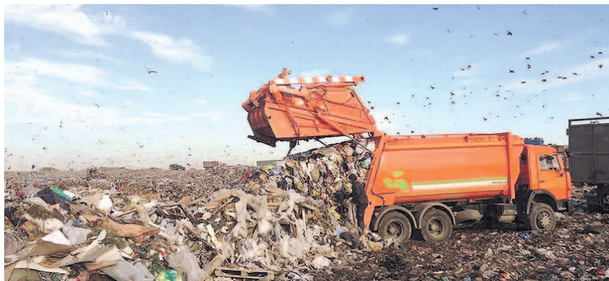
НА ФОТО: ТОННЫ МУСОРА МОГУТ НЕ ДОЕХАТЬ ДО СВАЛКИ

— У нас 25 операторов, которые вывозят мусор, а это информация только по трем. Нужно, чтобы Министерство ЖКХ Новосибирской области запросило данные и понимало, что делать. Иначе механизм будет простой. Если эта контора обанкротится, Министерство ЖКХ будет обязано расторгнуть с ней соглашение. На этот период придется искать, кто будет исполнять обязанности — все равно ведь мусор нужно вывозить.