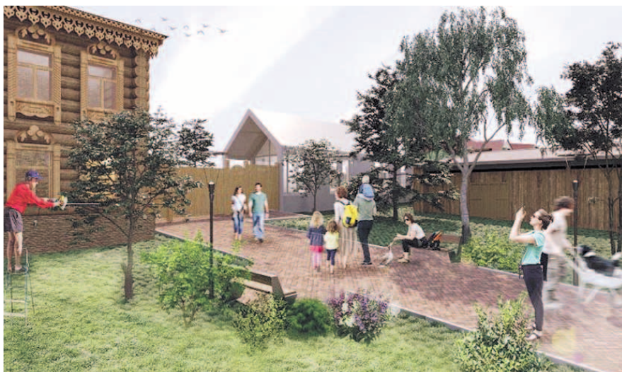
НА ФОТО: В НОВОСИБИРСКЕ ПОЯВИТСЯ УЛИЦА-МУЗЕЙ

— Усадебная архитектура дореволюционного периода становления города рассматривается в проекте как важный ресурс его современного устойчивого развития. Историко-ар-