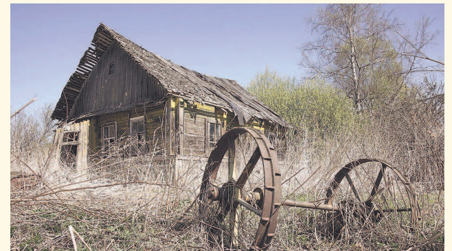
НА ФОТО: СТАРЫЙ ДОМ МОЙ ДАВНО ССУТИЛИСЯ...