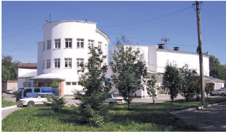
НА ФОТО: ПАМЯТНИК АРХИТЕКТУРЫ КИНОТЕАТРА «МЕТАЛЛИСТ»

Все это случилось благодаря тому, что буквально накануне сноса здание признали выявленным объектом культурного наследия. До сих пор бывший кинотеатр стоит в полуразрушенном состоянии. В мае этого года были обнародованы результаты двух историко-культурных экспертиз. Эксперты диаметрально разошлись во мнениях об