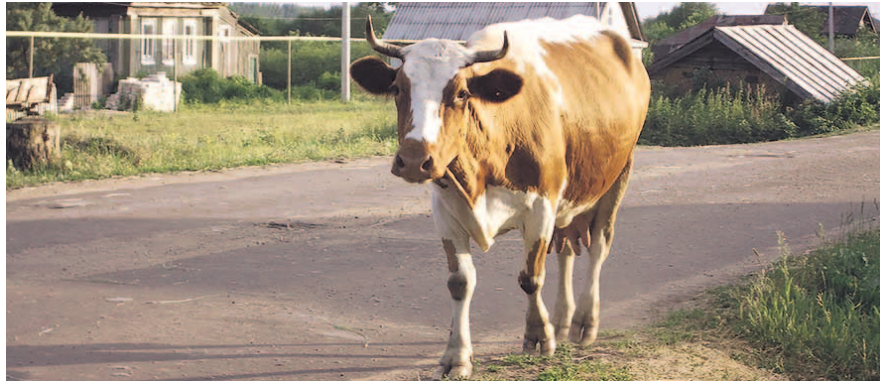
НА ФОТО: СКОТ НА «САМОВЫГУЛЕ» — ИСТОЧНИК ОПАСНОСТИ

На той же комиссии соседи пострадавшей семьи жаловались, что