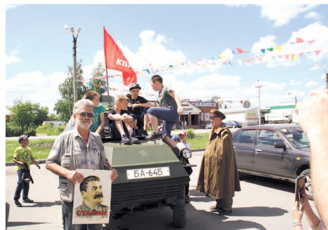
НА ФОТО: ДЕТВОРА С ИНТЕРЕСОМ ВСТРЕЧАЛА РЕТРОТЕХНИКУ

Затем участники автопробега возложили цветы к памятникам воинам и провезли алый стяг Знамени Победы по территории Куйбышевского и Северного районов, как призыв к памяти людей о страшной войне и пониманию, какой ценой далась Великая Победа. В Север-