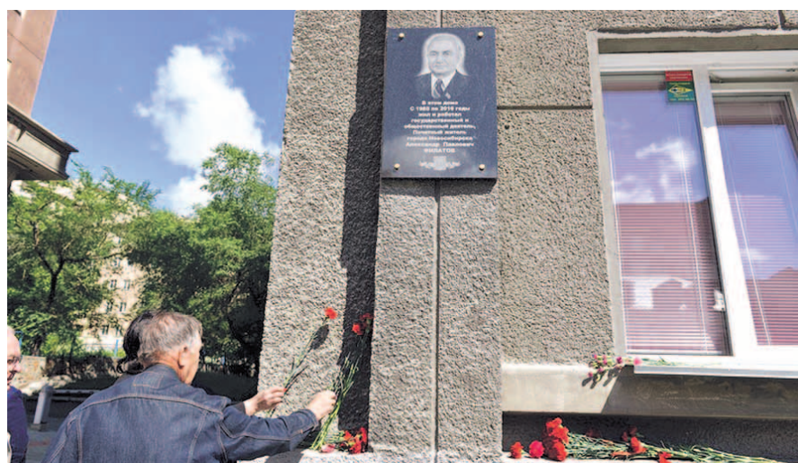
НА ФОТО: НОВОСИБИРЦЫ ПОЧТИЛИ ПАМЯТЬ ВЫДАЮЩЕГОСЯ РУКОВОДИТЕЛЯ ОБЛАСТИ