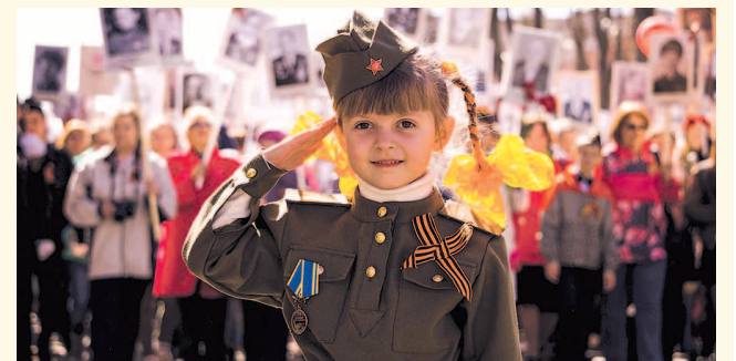
НА ФОТО: НУЖНЫ ЛИ МИЛЛИОНЫ НАСТОЯЩИМ ПАТРИОТАМ?