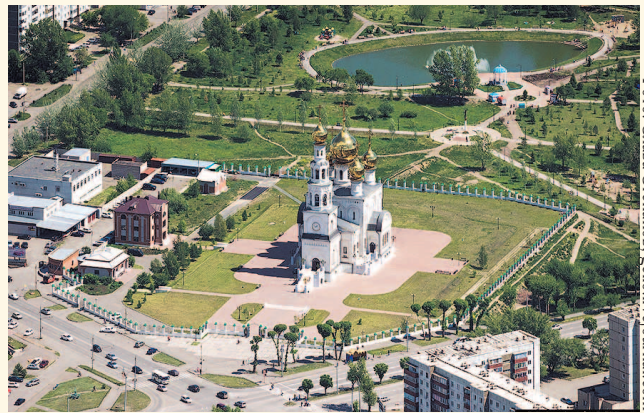
НА ФОТО: ЦЕНТР АБАКАНА