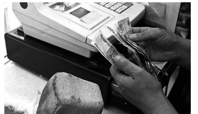
НА ФОТО: ЦЕНЫ ПРОДОЛЖАЮТ РАСТИ