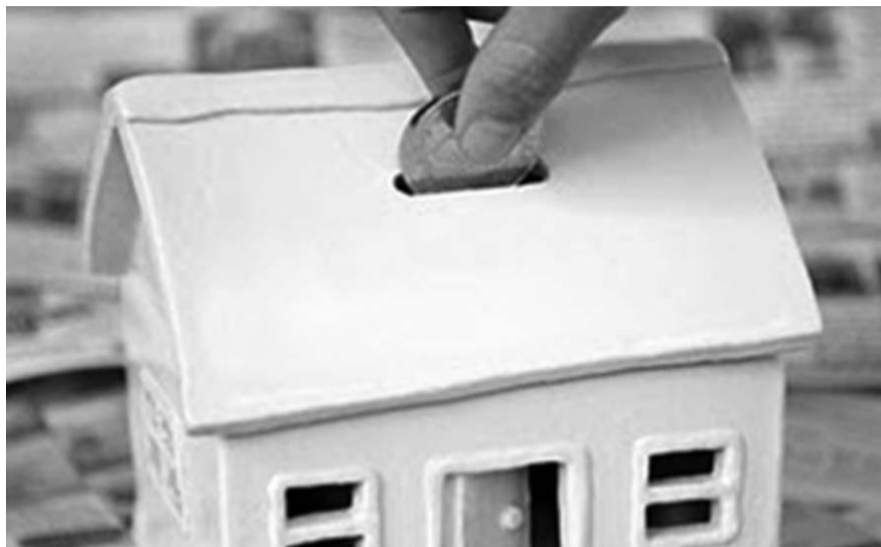
НА ФОТО: БУДУТ ЛИ ЗАЩИЩЕНЫ ДЕНЬГИ НА КАПРЕМОНТ?

— Разумеется, основным вопросом был и остается капитальный ремонт многоквартирных домов и все проблемы, связанные с ним, — говорит депутат Госдумы Александр АБАЛАКОВ. — Многие выступающие говорили, что они сами прекрасно знают, как делать капитальный ремонт, у них есть план работ, а федеральная программа навязывает совершенно другой график. Либо говорили, что ремонт они уже сделали, а их вновь заставляют копить деньги под этим предлогом. Глав-