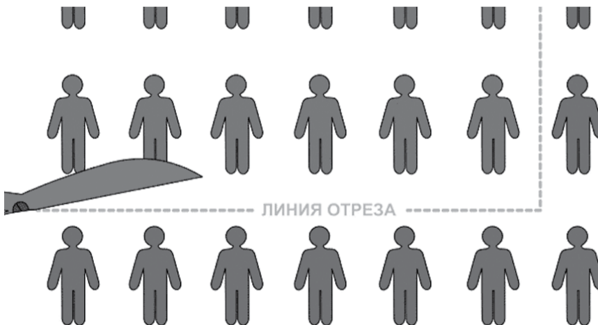
НА ФОТО: ГРЯДЕТ ВАЛ СОКРАЩЕНИЙ

В Новосибирской области начинаются массовые сокращения в связи с кризисом. Так, компания «Региональные электрические сети» планирует сократить в феврале 132 сотрудника, сообщает РБК. По мнению заместителя председателя регионального Законодательного собрания, коммуниста Владимира КАРПОВА , это только начало массовых увольнений и сокращений.