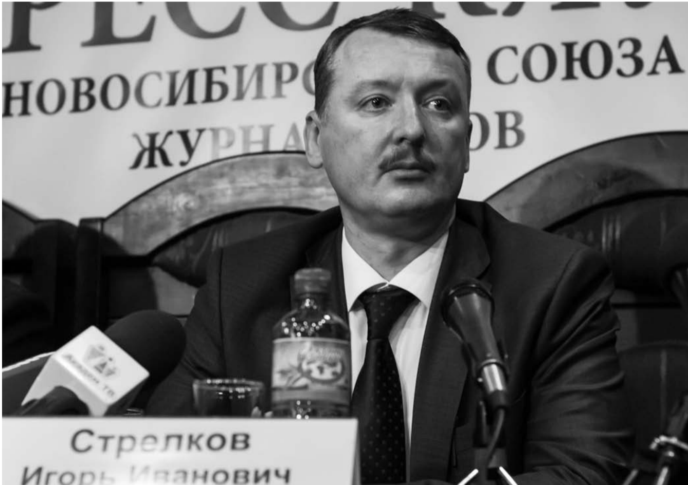
НА ФОТО: ИГОРЬ СТРЕЛКОВ ВСТРЕТИЛСЯ С НОВОСИБИРСКИМИ ЖУРНАЛИСТАМИ