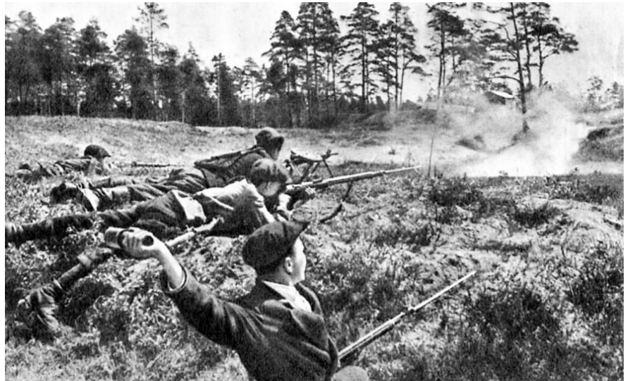
НА ФОТО: ПАРТИЗАНЫ БРЯНСКИХ ЛЕСОВ

Родина высоко оценила выдающийся подвиг брянских партизан и подпольщиков. Свыше 16 тыс. из них были награждены орденами и медалями, 12 удостоены звания Герой Советского Союза, Б. Ж. ЖАБОН и А. А. ТИТОВ — уже в 90-е гг. — звания Герой России. 30 января 1967 г. Указом Президиума Верховного Совета СССР за активное участие в партизанском движении, мужество и стойкость,