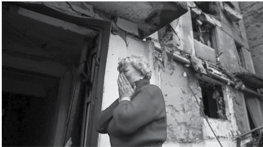
НА ФОТО: РАЗВЯЗАННАЯ КИЕВСКОЙ ХУНТОЙ ВОЙНА ПРИВЕЛА К ГУМАНИТАРНОЙ КАТАСТРОФЕ

к принятию правильного решения по этому вопросу.