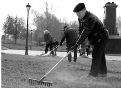
НА ФОТО: СУББОТНИК ВОЗГЛАВИЛ МЭР

Первомайский район. После схода снега коммунисты увидели, что памятник Ленину в сквере им. АКСЕНОВА пришел в удручающее состоя-