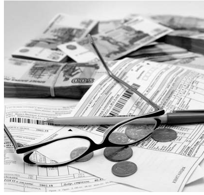
НА ФОТО: ПЛАТИМ, А ЧТО ВЗАМЕН?

Статья 4. Порядок предоставления компенсации.