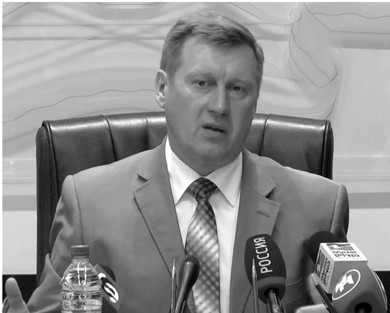
НА ФОТО: АНАТОЛИЙ ЛОКОТЬ НА ПРЕСС-КОНФЕРЕНЦИИ