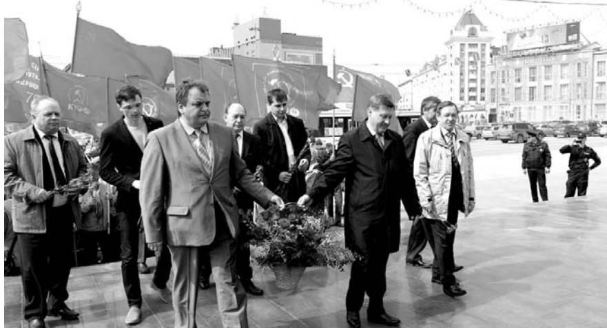
НА ФОТО: КОММУНИСТЫ ВО ГЛАВЕ С МЭРОМ ВОЗЛОЖИЛИ ЦВЕТЫ К ПАМЯТНИКУ ЛЕНИНУ

Ленина. Именно поэтому враги России в Новосибирске совершали акты вандализма над памятниками Ильичу. Сегодня мы делаем все, чтобы памятники были в порядке. Я отдал все распоряжения, чтобы именно в эти дни правоохранительные органы уделили особое внимание безопасности в Новосибирске, и особенно безопасности памятников. Если где-то вы видите попытки осквернить памятники нашего народа, смело звоните в правоохранительные органы.