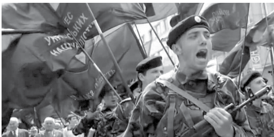
НА ФОТО: ПО УКРАИНЕ СНОВА МАРШИРУЮТ ФАШИСТЫ

— Мы вышли в поддержку коммунистов Украины в связи с принятием законов, приравнивающих коммунизм к нацизму. Приближается 70-летие Великой Победы, и сейчас мы видим, как развернулась борьба против признания очевидного — решающей роли