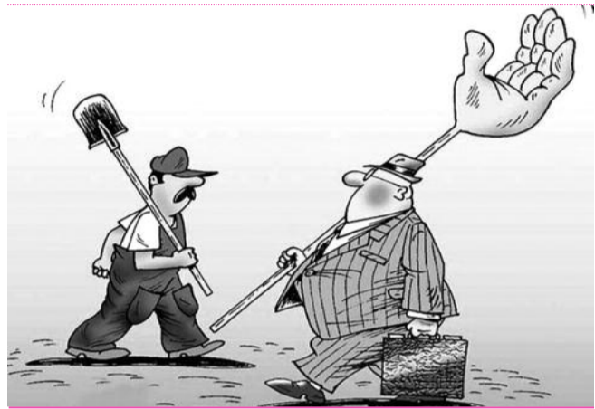
● НА РИС: «ГРЕБИТЕ, ЧИНОВНИКИ, ГРЕБИТЕ»

Госдума во втором чтении приняла закон, внесенный Президентом МЕДВЕДЕВЫМ , который изменяет Уголовный кодекс РФ. Наказание за «нетяжкие, малозначительные преступления» теперь будет менее суровым. Тюремные сроки по «популярным» статьям заменят денежные штрафы. Особенно вольготно будут себя чувствовать любители экономических преступлений. Украл, выпил, ... заплатил штраф. Украл, и еще раз выпил. Свобода.