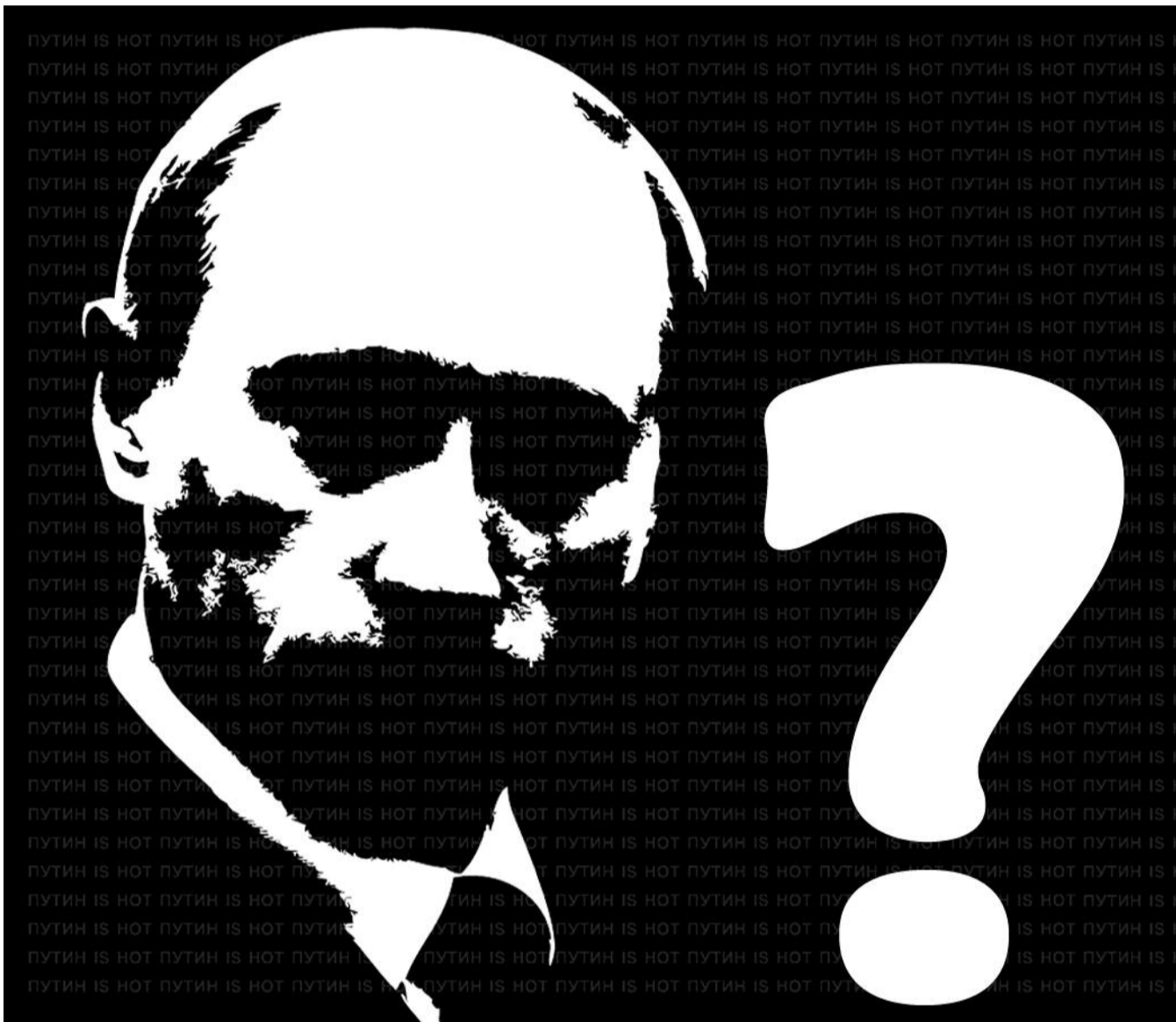
● НА РИС.: У КОММУНИСТОВ НАКОПИЛОСЬ МНОЖЕСТВО ВОПРОСОВ К ГОСПОДИНУ ПУТИНУ