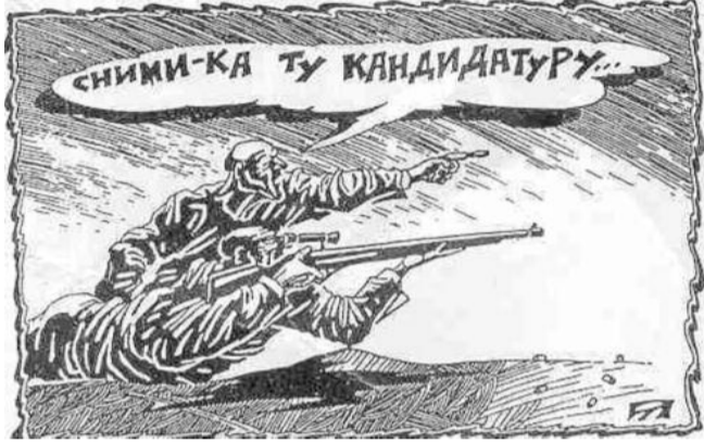
■ НА РИС.: НА ВЫБОРАХ В КОЛЫВАНИ ДЕЙСТВУЮТ ВОЕННЫЕ ЗАКОНЫ?

ДЕКАБРЬ 2005 г. Выборы депутатов в Государственную думу и в Совет депутатов Колыванского района. За сутки до выборов в ночь с 9 на 10 декабря совершен поджог усадьбы первого секретаря райкома. В огне пожара заживо сгорели две стельные коровы, более 20 кур. Убита собака. А в акте расследования пожара отражено замыкание электропроводки. Вывод: не ту собаку убили ударом твердого предмета по голове. Вторая, гулявшая без привязи, разбудила хозяина, но было поздно.