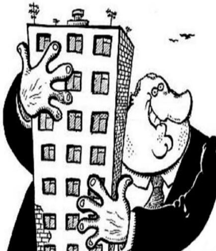
● НА РИС.: ВТОРАЯ ВОЛНА «ПРИВАТИЗАЦИИ»

Так, российская металлургия ушла от государства за 214 млн. долларов. Смешные цифры. Один лишь Норникель сегодня стоит более 52 млрд. долларов. Всего же за годы своего существования Норникель заработал для своих владельцев более 23 млрд. долларов — таким образом, он окупился уже примерно в 130 раз. А Новолипецкий металлургический комбинат принес свыше 11 млрд. долларов — его можно признать чемпионом по самоокупаемости: около 350 раз. Нефтянка ушла с молотка за 639 млн. долларов, что в нынешних ценах — 927 млн. долларов. Сегодня столько стоит чуть более 1,5% акций ЛУКОЙЛа. К июлю 2008 года проданы практически все электроэнергетические активы более чем за 830 млрд. рублей. Условием распродажи были масштабные инвестиционные программы по строительству новых мощностей и сетей, однако разразившийся практически сразу кризис нарушил планы инвесторов. Не нарушились только планы по повышению тарифов для потребителей. Такие же «итоги» наблюдаются в машиностроении, пищевой промышленности и других отраслях.