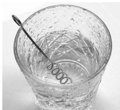
● НА ФОТО: В АКАДЕМГОРОДКЕ ЗНАЮТ, КАК ОБЫЧНАЯ ВОДА СТАНОВИТСЯ ЗОЛОТОЙ

Кроме того, на комиссии были обсуждены проблемы, возникающие при постановке приборов учета на транзитных домах, и тарифы на горячее водоснабжение в домах