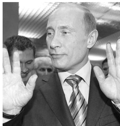
● НА ФОТО: «У ВАС ЕСТЬ КО МНЕ ВОПРОСЫ?»

Какие меры планирует предпринять Правительство РФ по развитию отечественного ОПК для укомплектования Российской Армии современными образцами военной техники?