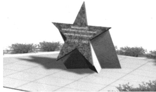
● НА ФОТО: МАКЕТ ПАМЯТНОГО ЗНАКА ГЕРОЯМ ОТЕЧЕСТВА