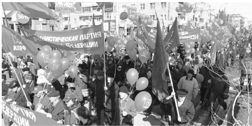
● НА ФОТО: ПЕРВОМАЙСКАЯ КОЛОННА КПРФ ПРОШЛА ПО КРАСНОМУ ПРОСПЕКТУ В 2008 ГОДУ

Но ведь есть еще площадка на Ленина, пусть не перед оперным, но тоже довольно удобная — Первомайский сквер. Там КПРФ уже не раз проводила свои мероприятия — опять скажете вы. Есть, ответят вам в мэрии, однако Первомайский сквер «закрыт на спецобслуживание». На этой площадке проводят свое мероприятие организаторы креативной «Монстрации». Ребятам пойти совершенно некуда, поэтому праздновать они будут в Первомайском сквере. Ну, это вообще форменное безобразие — скажете вы. Отнюдь. Молодым, как говорится, везде у нас дорога. Особенно, если их акцией можно заполнить опасный вакуум.