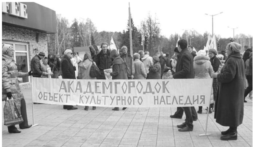
■ НА ФОТО: ОБЩЕСТВЕННОСТЬ АКАДЕМГОРОДКА ПРОТИВ ВЫРУБКИ ЛЕСА