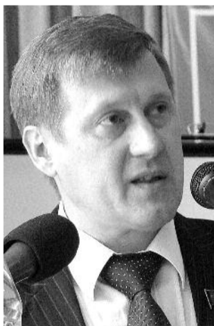
● НА ФОТО: АНАТОЛИЙ ЛОКОТЬ

— По факту «Фонд содействия реформированию ЖКХ» начинает сворачивать свою деятельность, уменьшает финансирование субъектов РФ, — заявил Анатолий Локоть. — В частности, в Новосибирске в этом году объемы финансирования, по сравнению с прошлым, уменьшились в 10 раз. В связи с этим ко мне приходит очень много обращений от избирателей и от депутатов различного уровня. В Совет депутатов города Новосибирска я направил свое обращение с просьбой продлить сроки действия фонда.