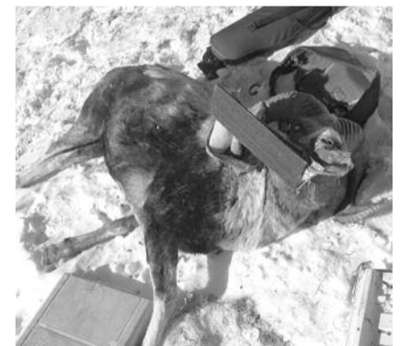
■ НА ФОТО: ЖЕРТВА НЕЗАКОННОЙ ОХОТЫ

Руководитель республиканского отделения надеется, что это происшествие послужит хоть каким-то уроком для власти имущих. Однако, по словам Ромашкина, несмотря на это громкое происшествие, настроения у многих чиновников таковы, что люди про-