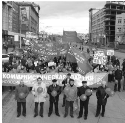
● НА ФОТО: ПЕРВОМАЙ-2009