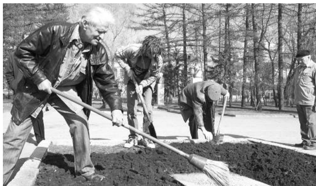
● НА ФОТО: ЛЕНИНСКИЙ СУББОТНИК—2010

Традиционный Ленинский субботник назначен областным комитетом КПРФ на ближайший выходной 23 апреля. Мероприятия по очистке территории пройдут в Сквере Героев революции Центрального района, в Советском районе субботник состоится около ДК «Академия», а в Заельцовском районе — в Ботсаду.