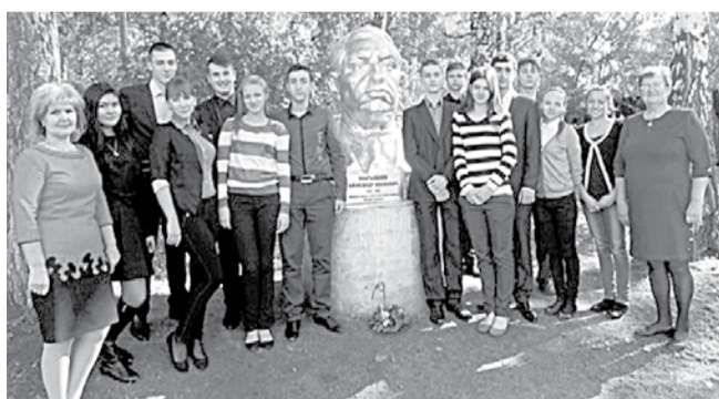
НА ФОТО: ДЕТИ НАМЕРНЫ ПРОДОЛЖАТЬ ЗАБОТИТЬСЯ О ПАМЯТНИКЕ

Восьмиклассники решили отреставрировать памятник, и установить его на территории школы. Эта идея нашла те-