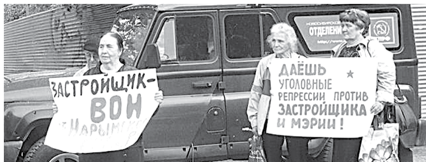
НА ФОТО: НАРЫМСКИЙ СКВЕР ДОЛЖЕН ОСТАТЬСЯ СКВЕРОМ (АКЦИЯ ПРОТЕСТА, 2013 ГОД)

— Нарымский сквер все это время был зоной «боевых действий» между чиновниками и защитниками сквера. Сегодня можно говорить о том, что это все в прошлом. Нарымский сквер