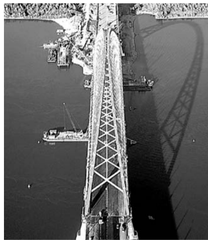
НА ФОТО: ОДНО ИЗ ДОЛГОЖДАННЫХ СОБЫТИЙ — ОТКРЫТИЕ БУГРИНСКОГО МОСТА

Одно из самых долгожданных событий для города — открытие Бугринского моста. Последние работы завершаются, и его открытие должно состояться в запланированные сроки, отметил мэр. Он напомнил, что в церемонии открытия моста 8 октября примет участие Президент России Владимир ПУТИН .