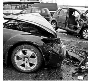
НА ФОТО: ЗА 8 МЕСЯЦЕВ ЭТОГО ГОДА В ДТП ПОГИБ 81 ЧЕЛОВЕК

На состоявшемся 18 сентября заседании комиссии Совета депутатов города Новосибирска по местному самоуправлению наиболее горячо обсуждалась безопасность дорожного движения в городе за первое полугодие.