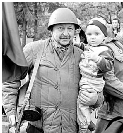
НА ФОТО: ДЕПУТАТ ГОСУДАРСТВЕННОЙ ДУМЫ АЛЕКСАНДР АБАЛАКОВ

Прошел арт-блокпост «АнтиНАТО-2» в поддержку Донбасса