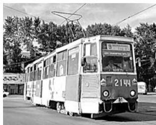
НА ФОТО: СРЕДНИЙ ВОЗРАСТ ОБЩЕСТВЕННОГО ТРАНСПОРТА В НОВОСИБИРСКЕ — 20 ЛЕТ

МКП «Горэлектротранспорт» просит увеличить тариф на проезд в троллейбусах и трамваях в Новосибирске с 16 до 20 рублей. Мэр Новосибирска Анатолий ЛОКОТЬ считает, что тариф можно повысить максимум на 10%, а город