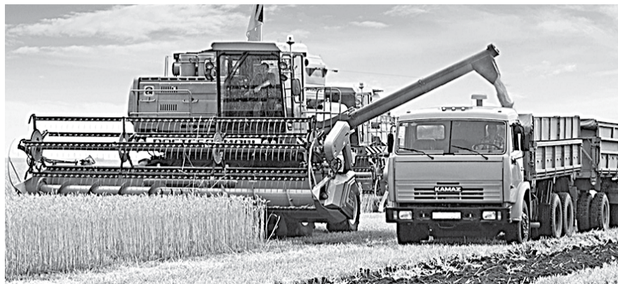
НА ФОТО: АГРАРИИ НЕ УКЛАДЫВАЮТСЯ В СРОКИ

— Уже на протяжении двадцати дней техника простаивает — погода очень влажная. Вчера еще был дождь, и до этого — ни одного дня без дождя. Будем ждать, пока дожди пройдут, еще несколько дней, как минимум, пока все просохнет. Планируем закончить уборочную в начале октября. Если сравнивать с предыдущими годами, то, например, в 2012 году закончили рано, потому что стояла сухая погода, да и урожая было меньше. В этом году мы получили немного помощи от государства — субсидии на гектар пашни. Но вспомните, что сказал ЗЮГАНОВ в Госдуме. Он сказал: да, мы прекратили закупать за границей те же яблоки, однако нашим крестьянам не легче. Америка выделяет 24% на сельское хозяйство, Европа — 30%, а мы — 1%. Это мизерная поддержка, которая несравнима с затратами. Еще такой факт: 80-й бензин практически снят с производства, а ведь на нем едва ли не вся техника работает. Во-первых, двигатели не предназначены для работы