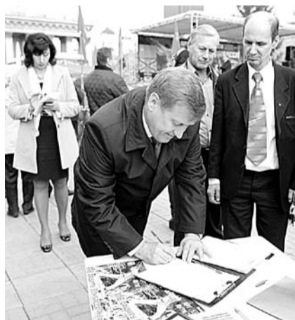
НА ФОТО: А.Е. ЛОКОТЬ ПОДПИСЫВАЕТ ОБРАЩЕНИЕ ЗА НЕЗАВИСИМОСТЬ НОВОРОССИИ

Эти слова были встречены аплодисментами и криками «Ура». Новосибирцы подписывали обращения о признании независимости Донецкой и Луганской народных республик, разбирали красные ленточки, фотографировались с ретро-техникой. На сцене — проверенные временем советские хиты от ансамбля «На-Заре», а после них — выступления депутатов Госдумы от Новосибирской области, членов фракции КПРФ. Если Александр АБАЛАКОВ отметил, что борьба народа Украины с киевским режимом — это борьба в конечном итоге за со-