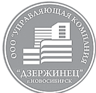
НА ФОТО: НА ЭТУ КОМПАНИЮ ПОСТУПАЕТ МНОГО ЖАЛОБ